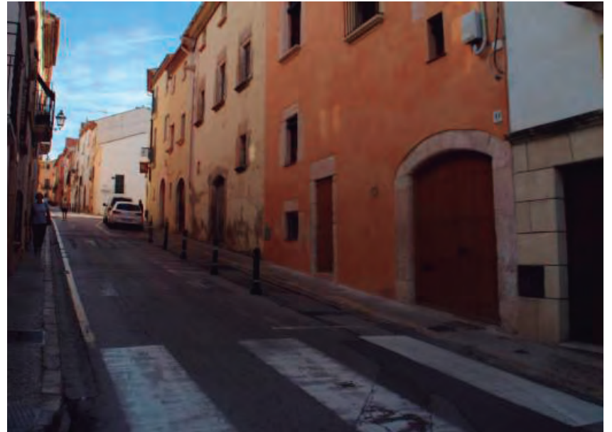
Una imatge actual del carrer de Dalt.

La remodelació està sufragada en part pel Pla d'Acció Municipal (PAM) de la Diputació de Tarragona, amb 400.000 euros. •