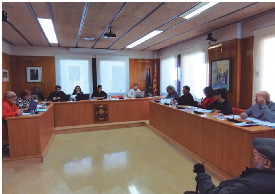
Un imatge del darrer ple municipal.

Pel que fa a les inversions de 2024, s'hi destinen 1.419.000 euros, dels quals 1.373.000 euros d'euros provindran de préstec. Quan a l'abril vinent es conegui la xifra final de romanent de tresoreria aquesta xifra de préstec es podria veure reduïda. Pel que fa a l'endeutament, només pujarà del 9 al 13%, que manté “la bona salut financera” del consistori altafullenc.