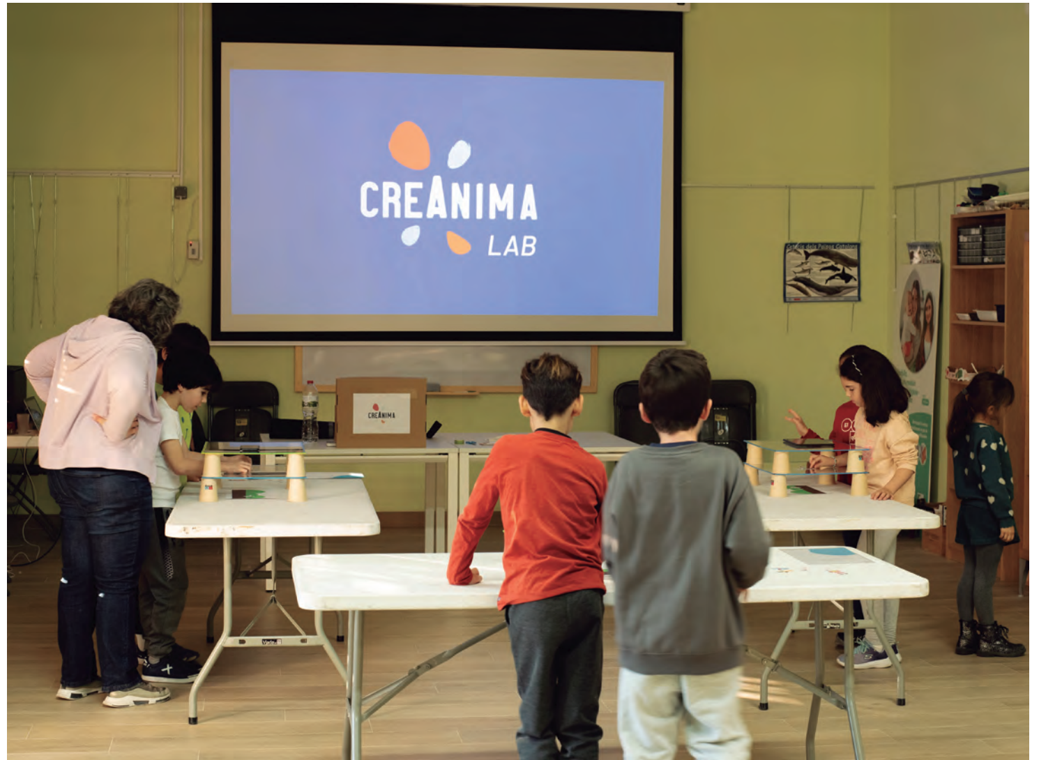
Una imatge del taller CreÀnima LAB, que es va portar a terme el desembre

En aquesta edició, s'han inscrit 145 curtsmetratges procedents de 22 països, dels quals s'han seleccio-