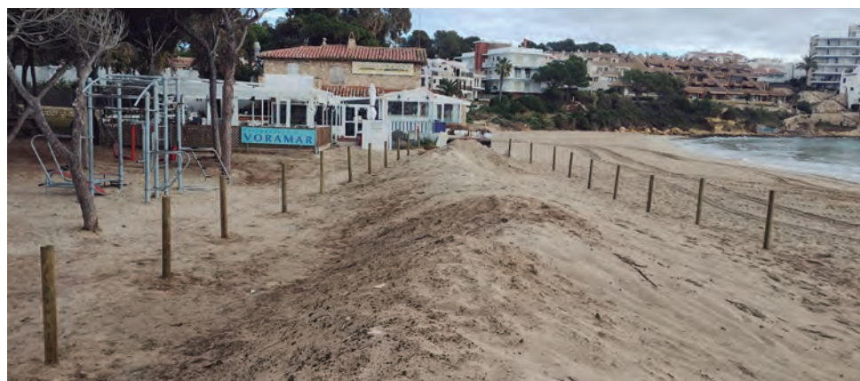
Una imatge de les actuacions fetes al Parc de Voramar, en espera de la plantació de la vegetació.

Per completar l'acció s'instal·larà una passera de fusta per facilitar l'accés entre el parc i la platja, es reubicaran els bancs i papereres i s'instal·larà la senyalització. En absència de temporals aquesta part de la platja podria actuar de reservori eventual de sorra.