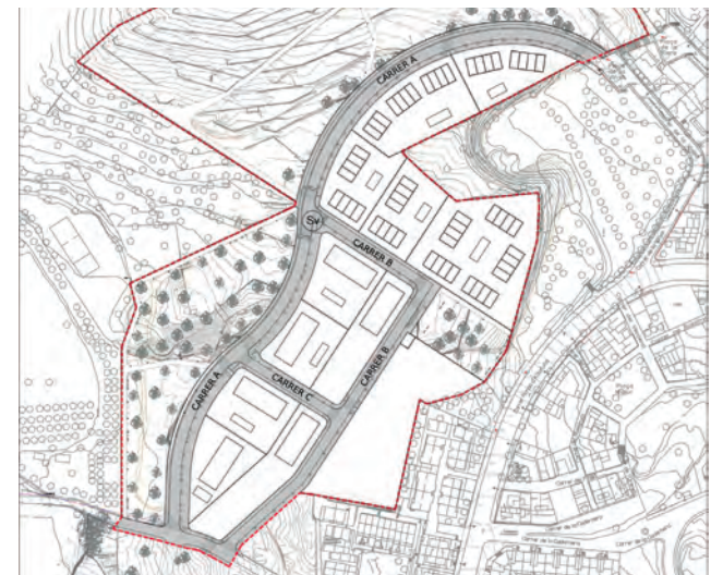
Una imatge dels carrers de Safranars dels quals s'està escollint el nom. / Foto: Ajuntament

Entre el 15 i el 23 de gener es porta a terme la tercera i darrera fase del procés participatiu. Entre les cinc propostes finalistes, cada persona en podrà votar una. Podeu votar a través d'eagora: www.eagora.app/ . •