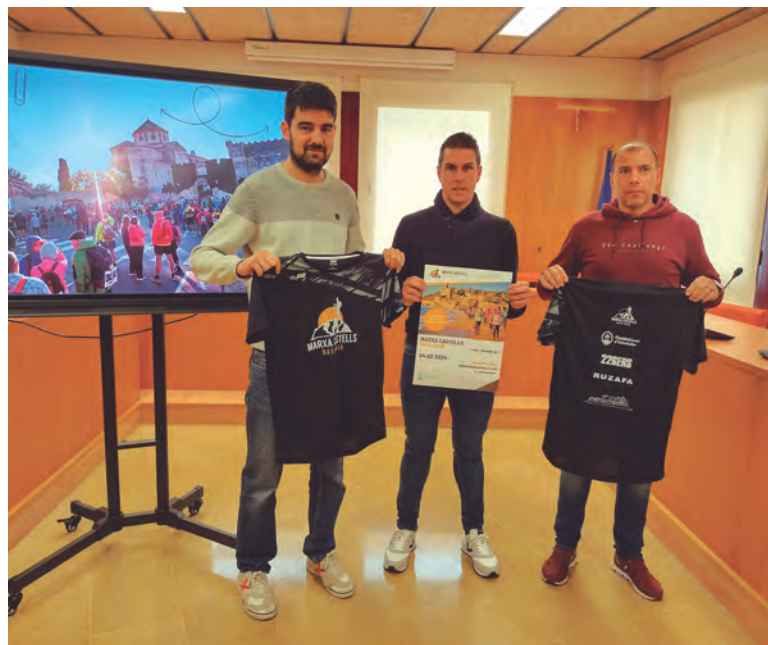
Una imatge de la presentació oficial de la 12a Marxa dels Castells del Baix Gaià.

Les inscripcions i la informació referent a l'esdeveniment es pot consultar al web www.marxacastells.com .