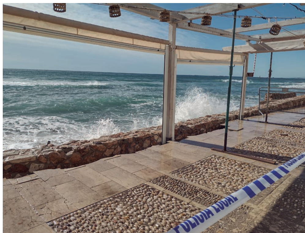
Imatge de la part afectada del passeig marítim. / Foto: Ajuntament

Membres del govern municipal mantenen trobades amb els propietaris d'establiments del passeig per explicar-los la situació i rebre les seves inquietuds. •