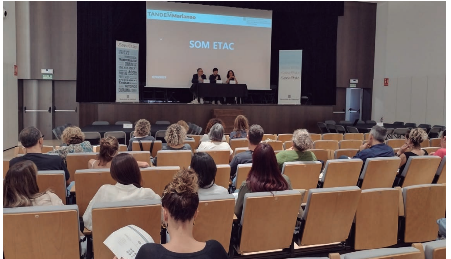
La jornada es va celebrar al Casal la Violeta.

L'objectiu de la sessió era esdevenir un espai grupal on generar reflexió i aprenentatges. I és que aquestes trobades presencials són una bona oportunitat per generar identitat i cultura compartida entre els diferents ETAC. En el seminari es ve reflexionar sobre els rols, funcions i legitimitat dels ETAC, centrant-ho en les diferents composicions d'aquests equips, exemplificant i concretant les tasques que es recullen a la fitxa dels plans, programes i projectes d'acció comunitària.