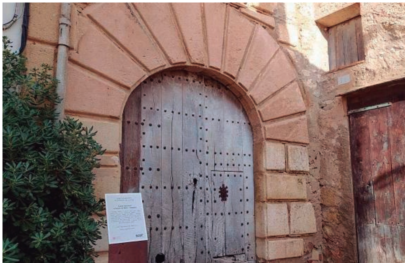
L'antic Hospital de Pelegrins d'Altafulla.

Previsiblement, aquest guardó farà que des d'Altafulla s'impulsin accions per afavorir el co-neixement d'aquest espai i de la figura de Martí i Franquès, que és fill il·lustre de la vila. Igualment, ja s'estan tirant endavant algunes iniciatives al