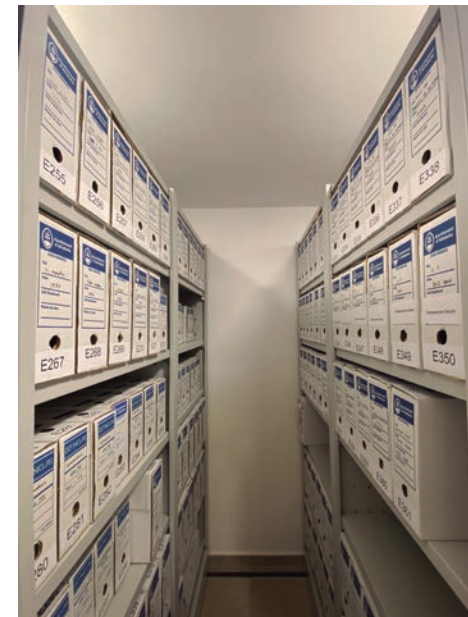
El fons de l'arxiu conté més de 400 metres lineals de documentació.

L'obertura de la Sala de Consulta és la consolidació de la feina iniciada el 2018 i fruit d'esforços per mantenir la documentació en bones condicions, preservar el seu fons documental, el