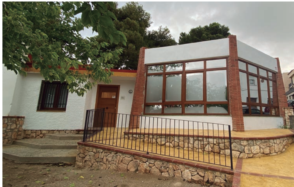
La sala de Consulta de l'Arxiu Municipal està l'antiga llar d'infants de les Escoles Teresa Manero.

El fons documental de l'arxiu, que conté més de 400 metres lineals de documentació, tradicionalment ha estat situat a l'edifici de la plaça del Pou, i encabia documentació històrica