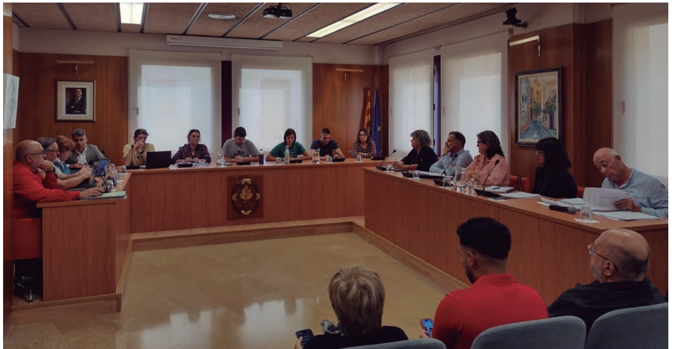
Una imatge del ple municipal de l'Ajuntament d'Altafulla.

El regidor d'Hisenda assenyala que les darreres setmanes estan sent molt intenses per quadrar un