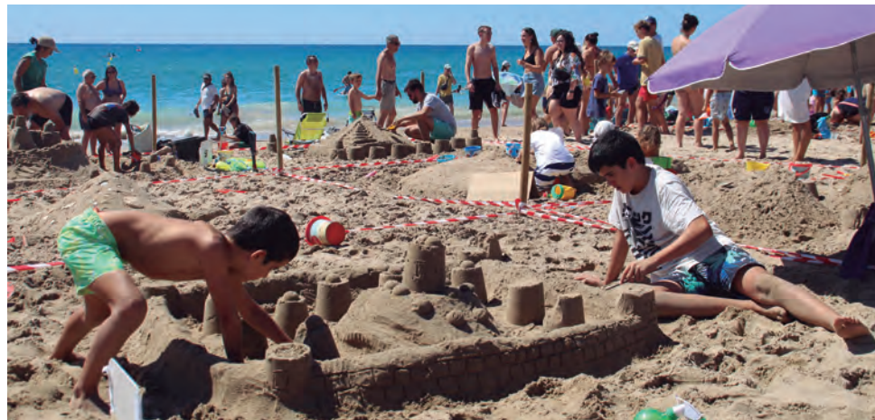
Infants participants al Concurs de Castells de Sorra.

hagut de tot: castells, una piràmide, tortugues, la boca d'un drac, un telèfon, un raïm acompanyat de formatge, tres volcans que treien fum o un cotxe, entre d'altres.