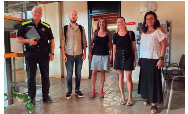
Representants del departament de Justícia participants de la reunió amb el sergent de la Policia Local i la primera Tinent d'Alcaldia.