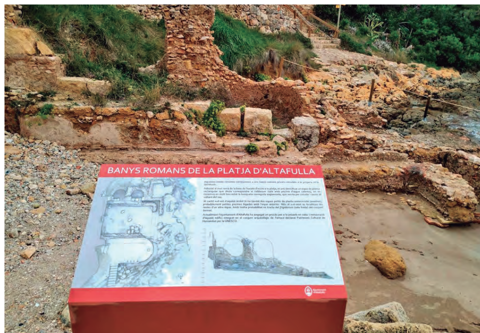
Plafó informatiu de les termes de mar romanes i abalisament.