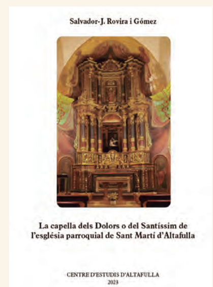
La capella dels Dolors o del Santíssim de l'església parroquial de Sant Martí d'Altafulla

Portada de l'opuscle sobre la capella del Santíssim.