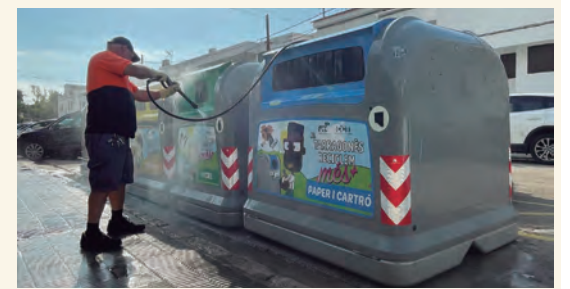
Un dels treballadors de la Brigada Municipal encarregat de la neteja de contenidors.

En aquest sentit, el coalcalde ha dit que "la situació ha millorat respecte a l'any passat, ja que el reforç permet actuar quan fa falta". Amb tot, ha explicat Molinera, "una de les illes més problemàtiques és, precisament, la del carrer Enviada , ja que té diversos establiments comercials al seu voltant i en determinades ocasions els contenidors són plens tot el dia", cosa que provoca males tar al veïnat. Per tot plegat, el consistori ja està fent un seguiment d'aquesta situació i estudia ara oferir un servei més personalitzat als locals. •