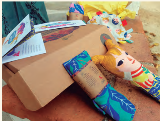
Una mostra dels elements que conformen el lot de benvinguda de la cooperativa Niu.