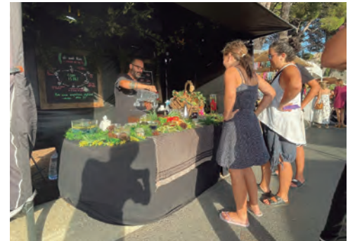
Obertura de la Fira per part de la Corporació Municipal, mestres artesans mostrant l'ofici i paradistes de la 25a edició del certamen.