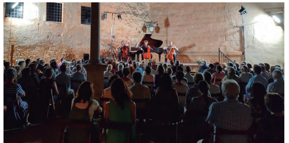
Concert d'homenatge a Pau Casals pel 36è FIM.

Per Arimany i per Maymó, l'acollida que ha tingut enguany el FIM ha estat "un èxit", amb els concerts programats que s'han pogut desenvolupar amb normalitat a la plaça de l'Església, o bé a l'interior del temple parroquial en cas de mal temps, com ha estat