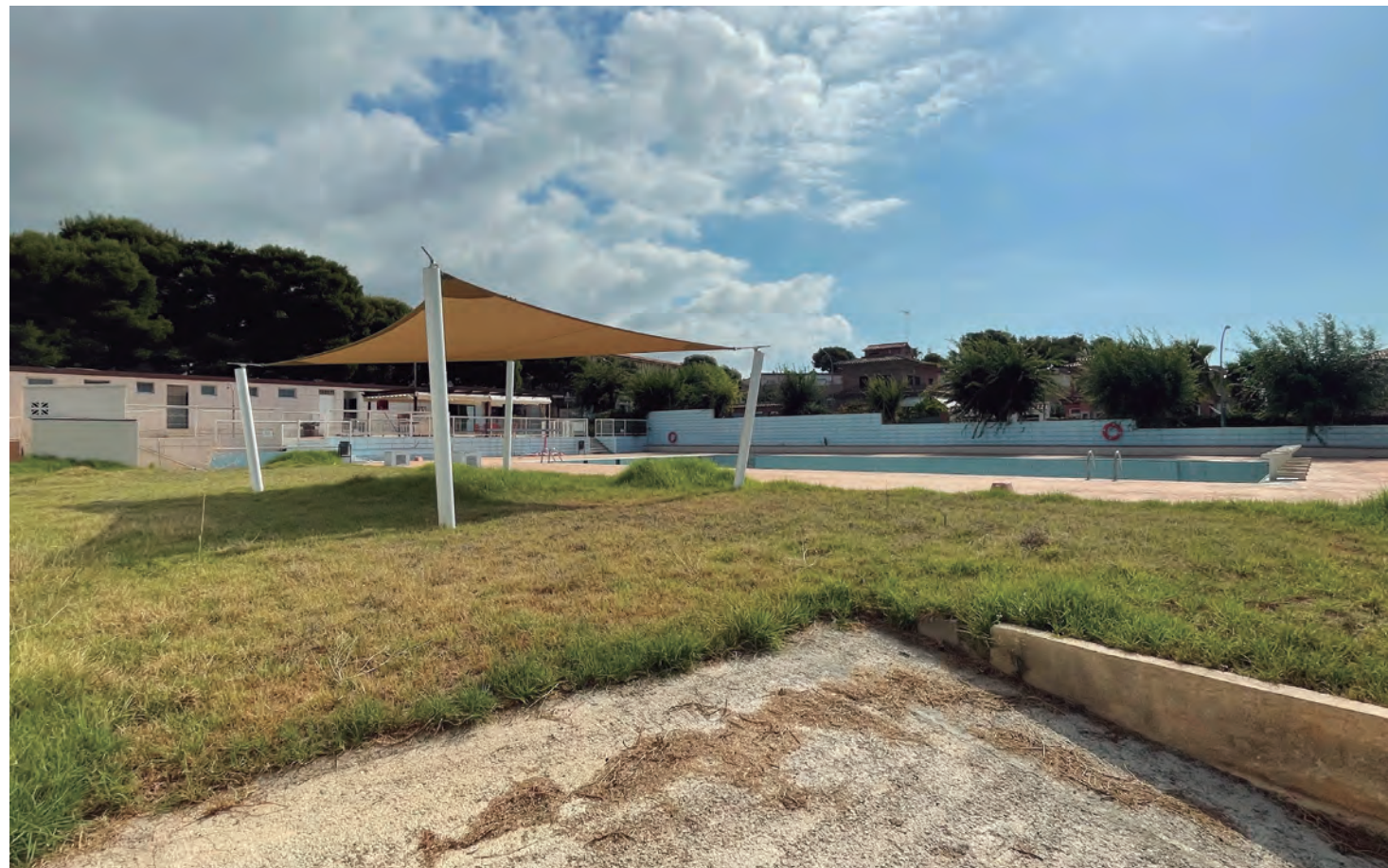
Les instal·lacions de la piscina municipal en el seu estat actual.

Per altra banda, en l'EMC d'urgència s'hi ressenyava una altra partida que