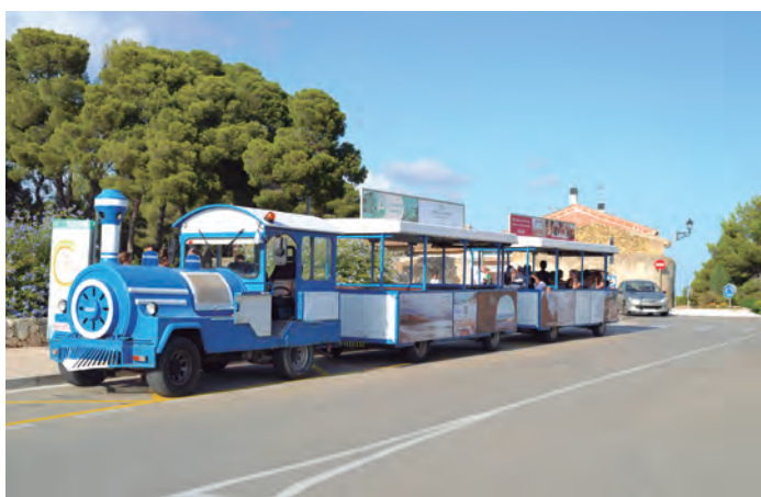
El trenet turístic que està en funcionament aquest estiu.

El trenet turístic d'Altafulla, que va posar-se en marxa per Sant Joan, ha modificat els horaris de servei. El canvi l'han acordat en una reunió l'Ajuntament i l'Associació Turística d'Empresaris i Comerciants d'Altafulla (ATECA), que és qui enguany gestiona el transport mitjançant una subvenció del consistori, i respon a l'ús que en fa la ciutadania.