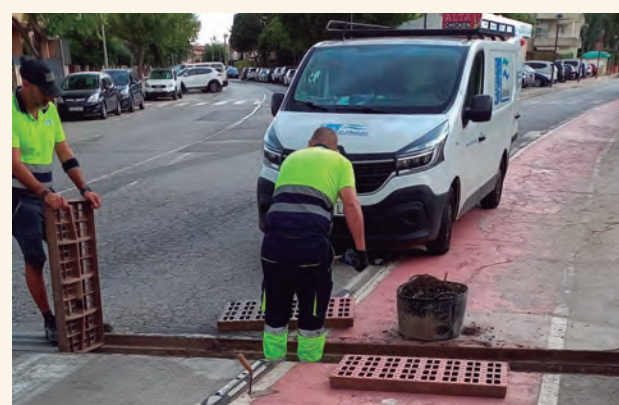
Operaris d'Aigües d'Altafulla netejant embornals de Via Augusta.

Paral·lelament, a finals de juliol, l'empresa mixta Aigües d'Altafulla va iniciar unes tasques complementàries a les habituals per aplicar uns tractaments tant al clavegueram com als embornals dels carrers i evitar així que augmentin les plagues de determinats insectes . Es tracta d'un tractament biològic i que en cap cas és nociu pel medi ambient.