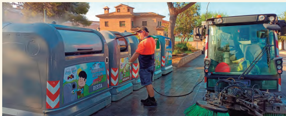
Treballadors de la Brigada netejant i desinfectant una illa de contenidors.

Ajuntament d'Altafulla ha posat en marxa un torn específic de la Brigada Municipal per fer front a l'augment de la generació de residus a la vila en període estival i també al possible incivisme de veïns i visitants. D'aquesta manera, d'una banda un equip format per dos treballadors s'encarrega de revisar els contenidors i les papereres de la vila per evitar que s'acumuli la brossa a la via pública, i de l'altra, dos dies a la setmana es fa una neteja i desinfecció de les illes .