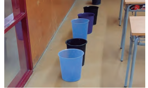
Galledes disposades a l'aula afectada per les goteres i filtracions d'aigua.

La trobada que ha permès traslladar les queixes de la comunitat educativa de l'Institut a Educació s'emmarca en una pri-