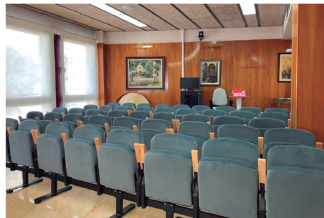
Una part de les primeres cadires que es van comprar per a La Violeta estan instal·lades a la sala de plens.

Les cadires que ara s'han cedit a la companyia són les primeres que l'Ajuntament, aleshores comandat per AA, va comprar de cara a la remodelació del Casal La Violeta. Amb el canvi de govern posterior als comicis del 2019, l'EINA, el PSC i Ara van decidir prescindir-ne per instal·lar-ne unes que fossin mòbils, que són les que hi ha actualment. •