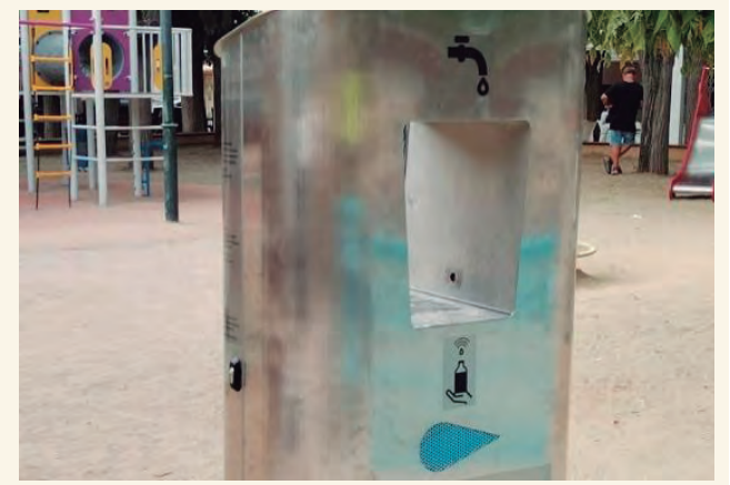
Dispositiu instal·lat a la plaça dels Vents.

Es tracta, per Aran, de fomentar l'ús d'aigua de l'aixeta per beure. I per això recentment, durant el mercat setmanal s'ha dut a terme un tast d'aigües. El resultat ha estat que més de la meitat de la gent no ha estat