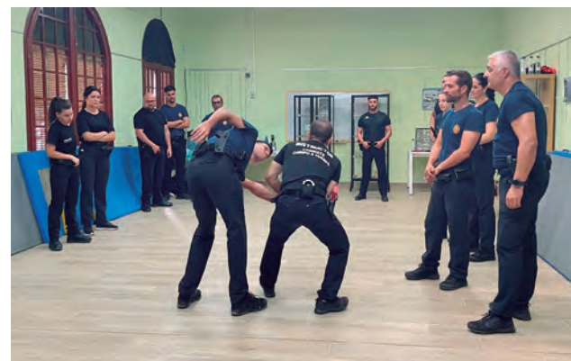
Els agents durant la formació.