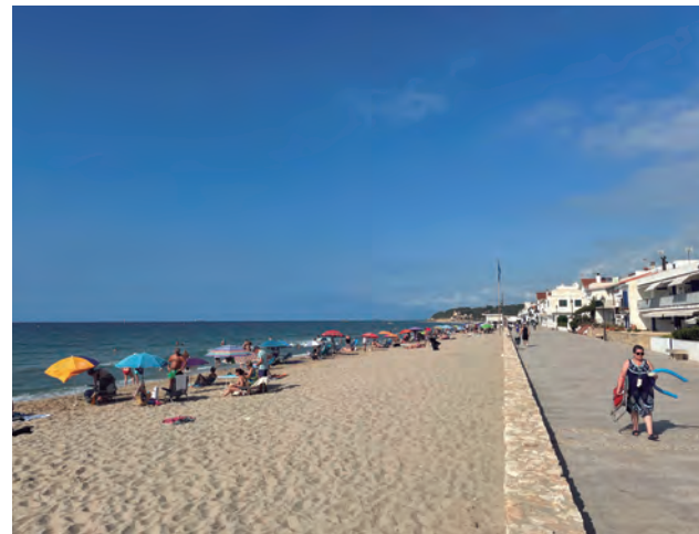
Platja d'Altafulla.

Les reserves "calentes", com les anomena Lloret, disminueixen a l'agost, quan hi ha més previsió per part dels clients segurament perquè tenen constància d'aquest augment de turisme generalitzat en el vuitè mes de l'any i per no quedar-se sense plaça. •