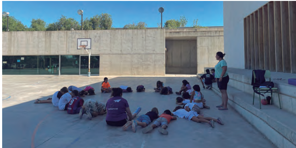
Darrer dia d'activitats del casal d'estiu al pati de La Portalada.