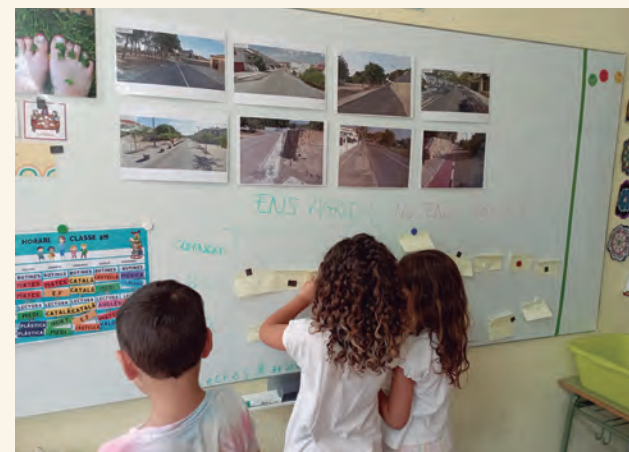
Treball amb l'alumnat de La Portalada en una de les fases del projecte de camins escolars.

La voluntat del consistori és donar a conèixer aquests plantejaments i els resultats de les primeres fases del projecte en una Audiència Pública que tindrà lloc a principis de setembre i coincidint amb la celebració de la Setmana Europea de la Mobilitat. A l'acte hi prendran part membres de la L'Escamot Cooperativa, que és la consultoria de mobilitat activa i sostenible que capitaneja el projecte. En aquesta sessió també es donaran a conèixer els detalls de la implantació d'aquests camins i les millores que caldrà realitzar a la via pública per fer que els camins siguin amables i segurs . •