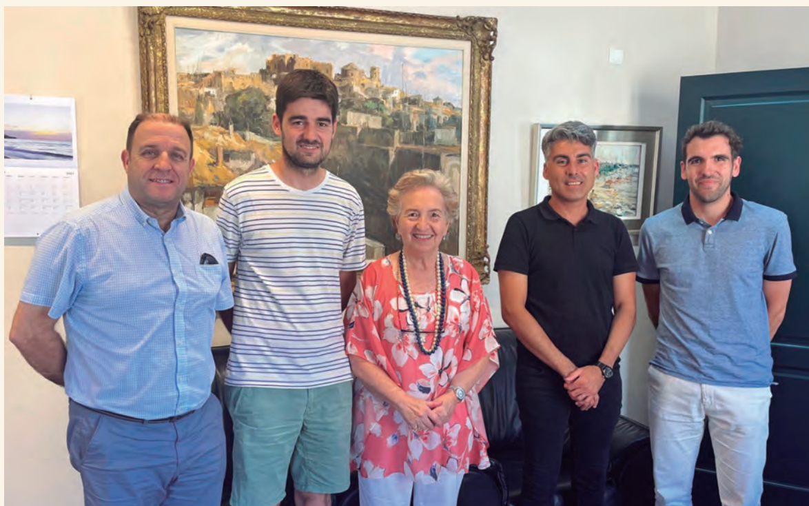
La reunió entre l'Ajuntament i la Cambra de Comerç va fer-se al despatx d'alcaldia.