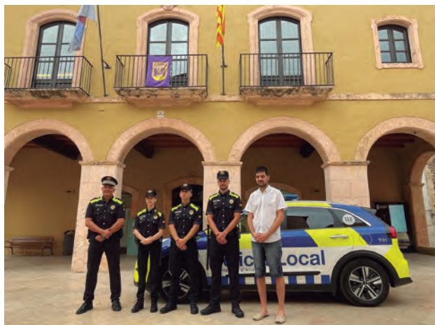
Acte de presentació dels agents de reforç de la Policia Local.

La Policia Local d'Altafulla ja disposa dels agents de reforç per fer front a la temporada d'estiu, una època de l'any que el municipi pràcticament triplica la població fruit de l'arribada de turistes i veïns de segona residència. De fet, aquesta és una pràctica habitual pel moment que es travessa , i ara s'han incorporat al cos policial un total de tres efectius que han de permetre atendre totes les necessitats del servei de cara a les properes setmanes.