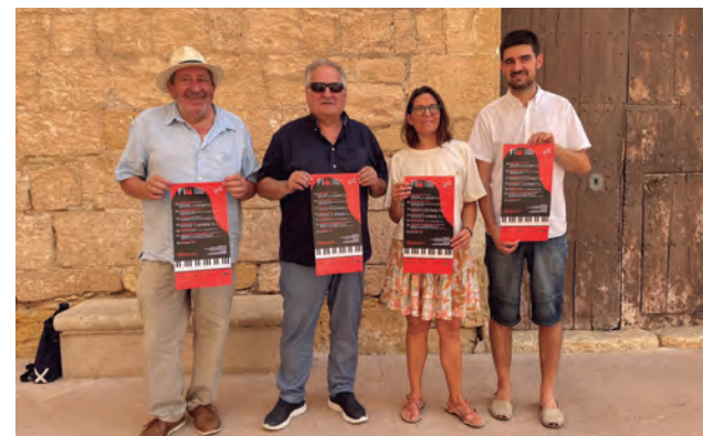
Acte de presentació del 36è FIM, a la plaça de l'Església.

Les propostes d'enguany tenen en comú, majoritàriament, la presència del piano en gran part d'elles. Així mateix, destaca un concert homenatge a Pau Casals , quan es compleixen 50 anys de la seva mort, o el de ' Les 4 estacions ' de Vivaldi, que compta amb la peculiaritat d'estar acompanyat d'una explicació breu