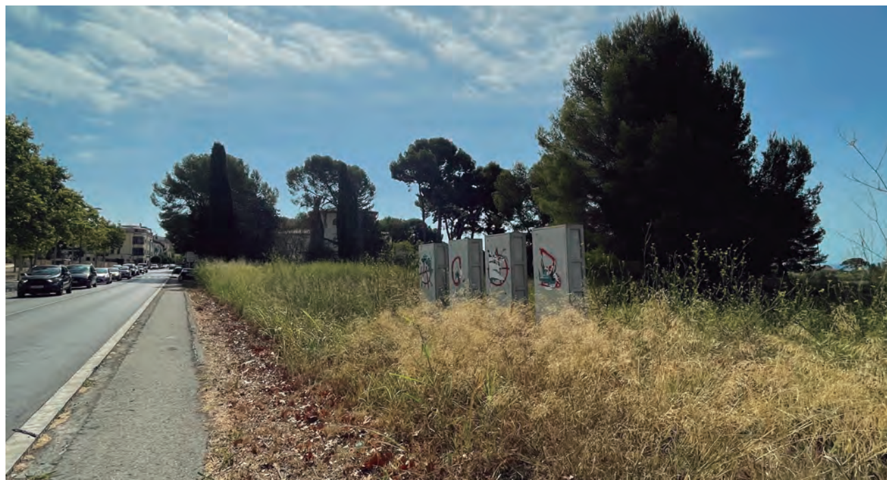
La Cabana en el seu estat aquest mes d'agost.

Altres modificacions del POUM que van prosperar el 31 de juliol són la del carrer de l'Isidrot i Baixada de la Cova o la de la plaça Nova . Igualment, també es va aprovar fer un canvi d'usos en diferents edificis catalogats del municipi per permetre que