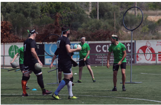
Una jugada durant el Torneig del Drac Maragda de Quadball, al Joan Pijuan.

Per segon any consecutiu l'Estadi Municipal Joan Pijuan d'Altafulla ha acollit el Torneig del Drac Maragda de Quadball. La cita ha comptat amb una setantena d'esportistes que s'han aplegat per la naturalesa benèfica de l'esdeveniment i la passió que tenen per aquest esport. Un dels responsables del torneig, l'altafullenc