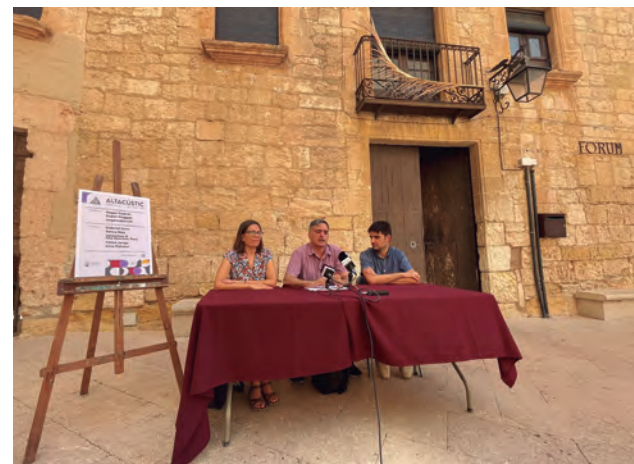
Presentació del 10è Festival Altacústic a la plaça de l'Església.

El director artístic assegura que amb aquest programa, l'Altacústic "es reinicia com a espai d'exhibició de l'escena emergent independent". Pel que fa al públic, Kike Colmenar destaca que majoritàriament