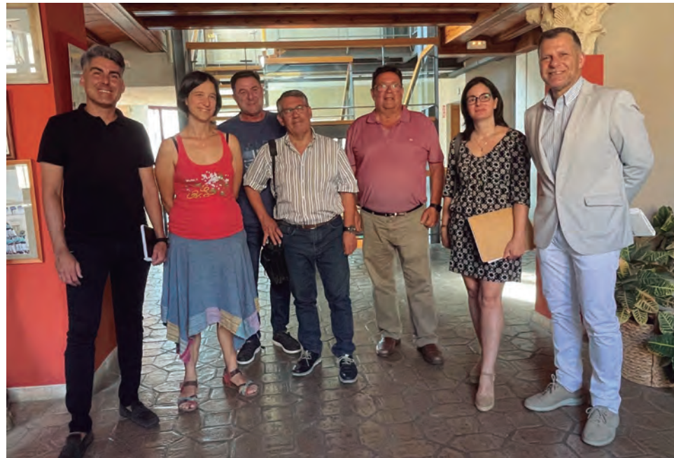
Fotografia de grup després de la reunió entre l'Ajuntament i l'Associació EiG.