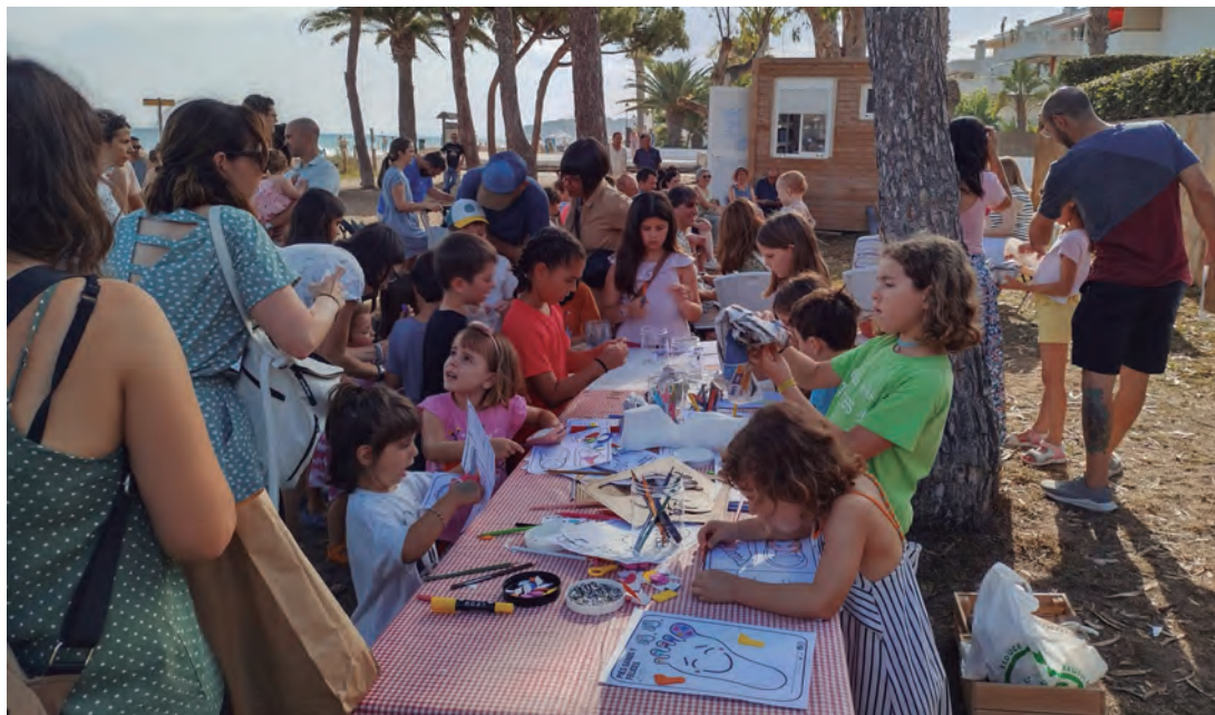
Activitats per al públic infantil a la Bibliomar.

Igualment s'han programat un seguit d'activitats paral·leles per dinamitzar la Bibliomar, tant tallers familiars i infantils, com contacontes i presentacions de llibres. El servei roman obert tot l'estiu de dilluns a divendres, de 17h a 20h, i també els dimecres al matí, de 10h a 13h. •