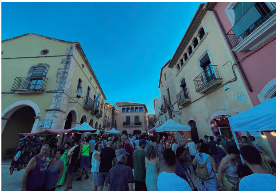
La plaça del Pou durant la Nit de Bruixes a la jornada de dissabte.

El coordinador de l'esdeveniment també ha valorat positivament el desenvolupament de les xerrades i les activitats com els rituals, que han aplegat xifres destacables de públic. Per exemple, a Sebastià d'Arbó el van escoltar a l'era de l'Hospital més de 200 persones, mentre que el ritual final per tancar la fira, a càrrec de la bruixa dels Pirineus, Imma del Destí, va ser seguit per uns 300 assistents. •