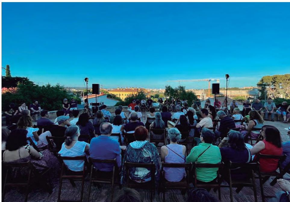
El professor Sebastià d'Arbó durant la conferència a l'Era de l'Hospital.