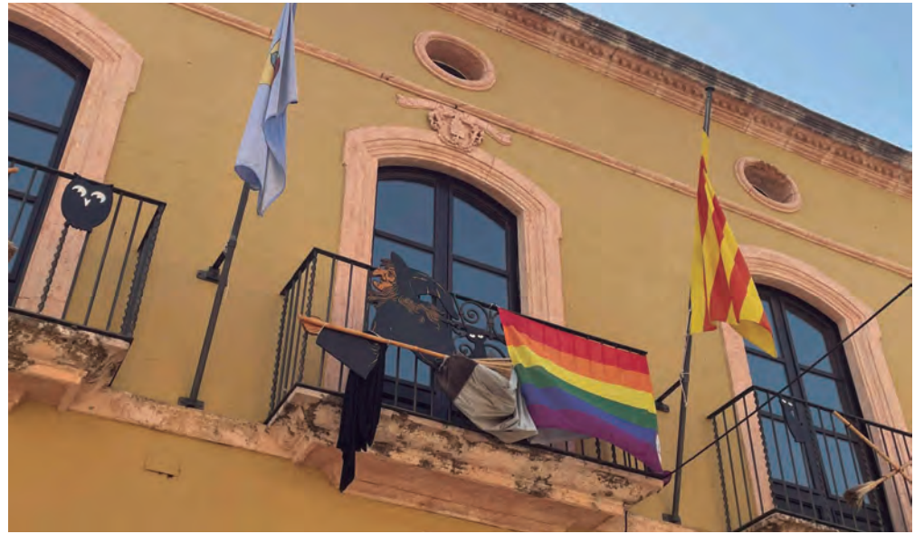
Bandera de l'arc de Sant Martí al balcó de la Casa de la Vila.