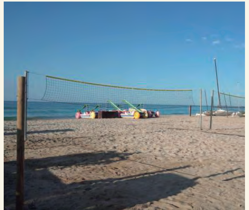
Xarxes de volei platja, a tocar del Club Marítim.

La zona esportiva sobre la platja d'Altafulla ja és una realitat i pot gaudir-se des del cap de setmana de Sant Joan. Dues pistes de voleibol presideixen l'espai que s'ha habilitat al costat de la zona de varada del Club Marítim per al gaudi dels veïns que vulguin torrar-se al sol mentre practiquen esport.