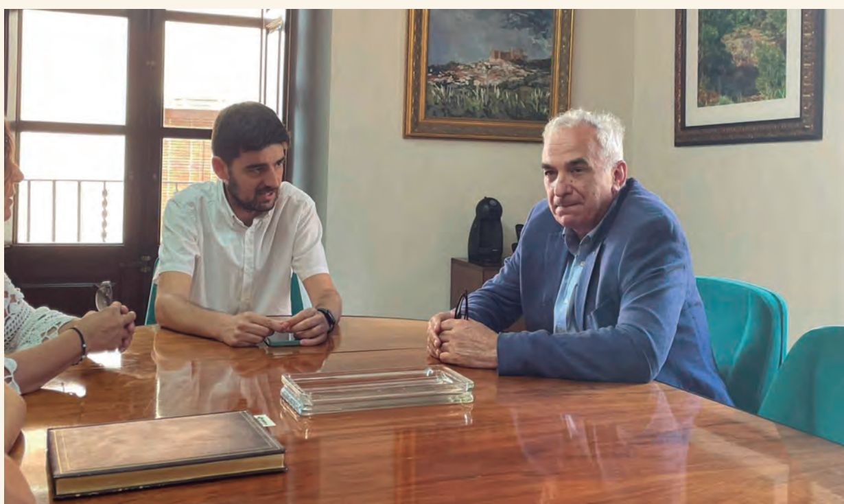
Àngel Xifré a la reunió amb l'equip de govern d'Altafulla a la sala de comissions.

L'Ajuntament d'Altafulla vol posar fil a l'agulla a diferents projectes de la vila, i per fer-ho cal tenir en compte les diferents administracions del territori que hi poden donar suport, com per exemple la Generalitat de Catalunya. És per això que, aprofitant la visita a Altafulla del delegat del Govern a Tarragona, Àngel Xifré, s'han posat sobre la taula diverses qüestions en les quals el consistori requereix la col·laboració del Govern català.