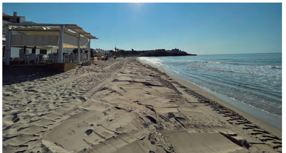
Maquinària treballant a la platja per tal d'anivellar la sorra.