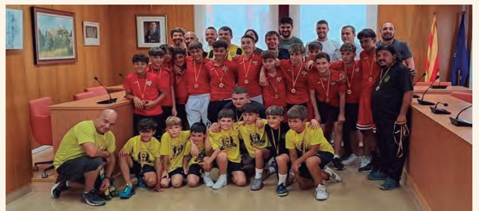
Rebuda institucional als equips del CE Altafulla que han pujat de categoria aquesta temporada.

L'Ajuntament d'Altafulla ha fet una recepció oficial als tres equips del CE Altafulla que enguany han aconseguit l'ascens de categoria : el Benjamí 'A' i l'Infantil 'A', que s'han proclamat campions de lliga i són nous equips de Primera Divisió, i els Veterans, que han pujat a la Segona Divisió de F11 del MiniFutbol Tarragonès.