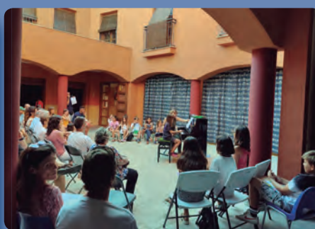
Audició de piano

És molt important escoltar-se els uns als altres