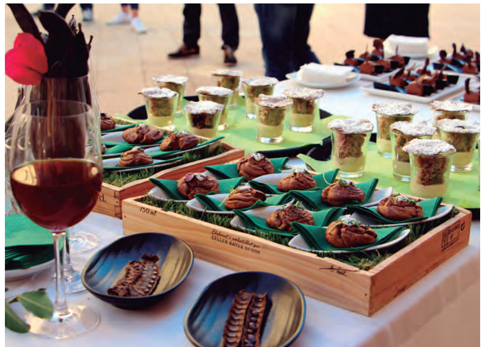
Degustació de plats elaborats amb garrofa a la plaça del Pou.

Està previst que representants d'EiG visitin Altafulla en els propers mesos amb la intenció de conèixer les instal·lacions de què disposaran, així com els establiments d'allotjament per als participants