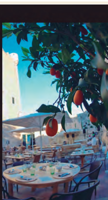
PATI DELS TARONGERS