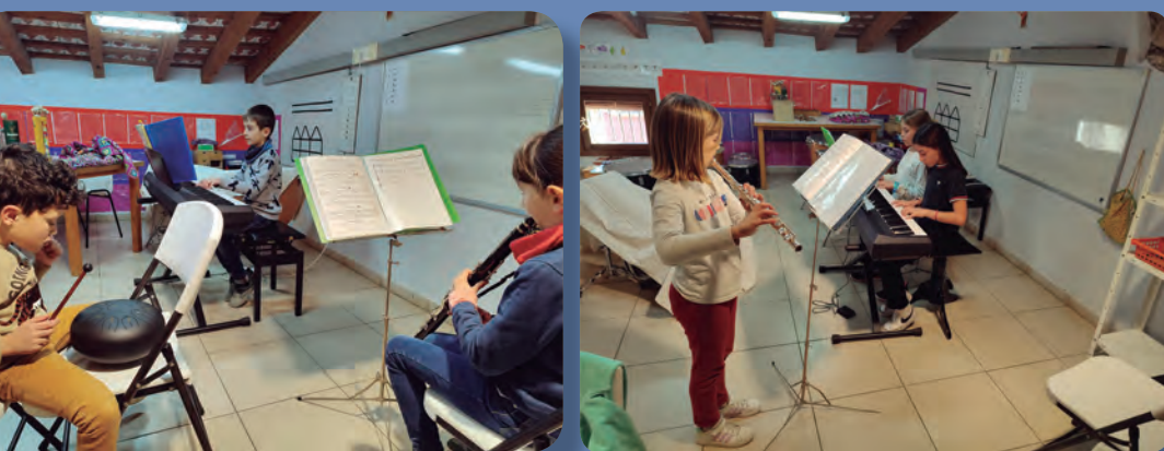
Trio de cambra

La Cambra ve de molt antic, quan s'anava a tocar per divertir la gent rica Cambra vol dir habitació, per això és un grup tan petit. La Cambra ve de molt antic, quan un conjunt musical petit anava a tocar per divertir la gent rica a casa seva perquè no hi havia tele. Jo faig Cambra i al meu grup som dos músics: piano i percussió. A Cambra aprenem a estar coordinades, també a tocar millor música i a corregir els nostres errors.