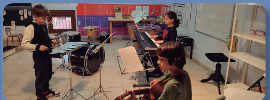
Grup de cambra