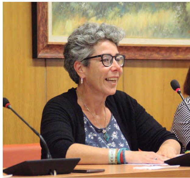
Natalia Sanz.