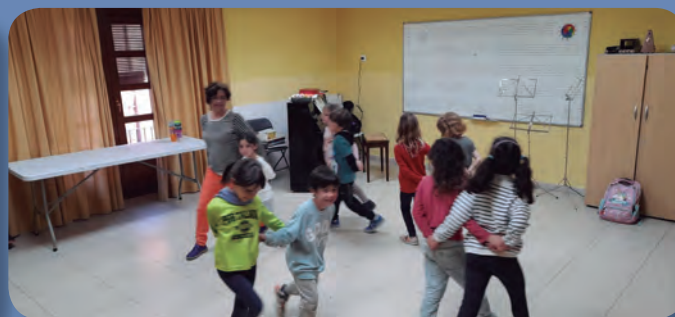
Cos i moviment