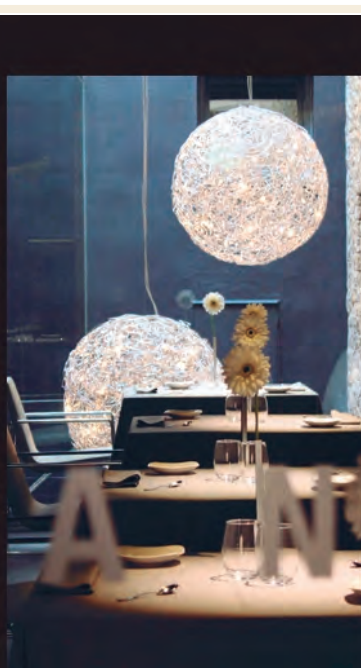
BRUIXES DE BURRIAC BY JAUME DRUDIS