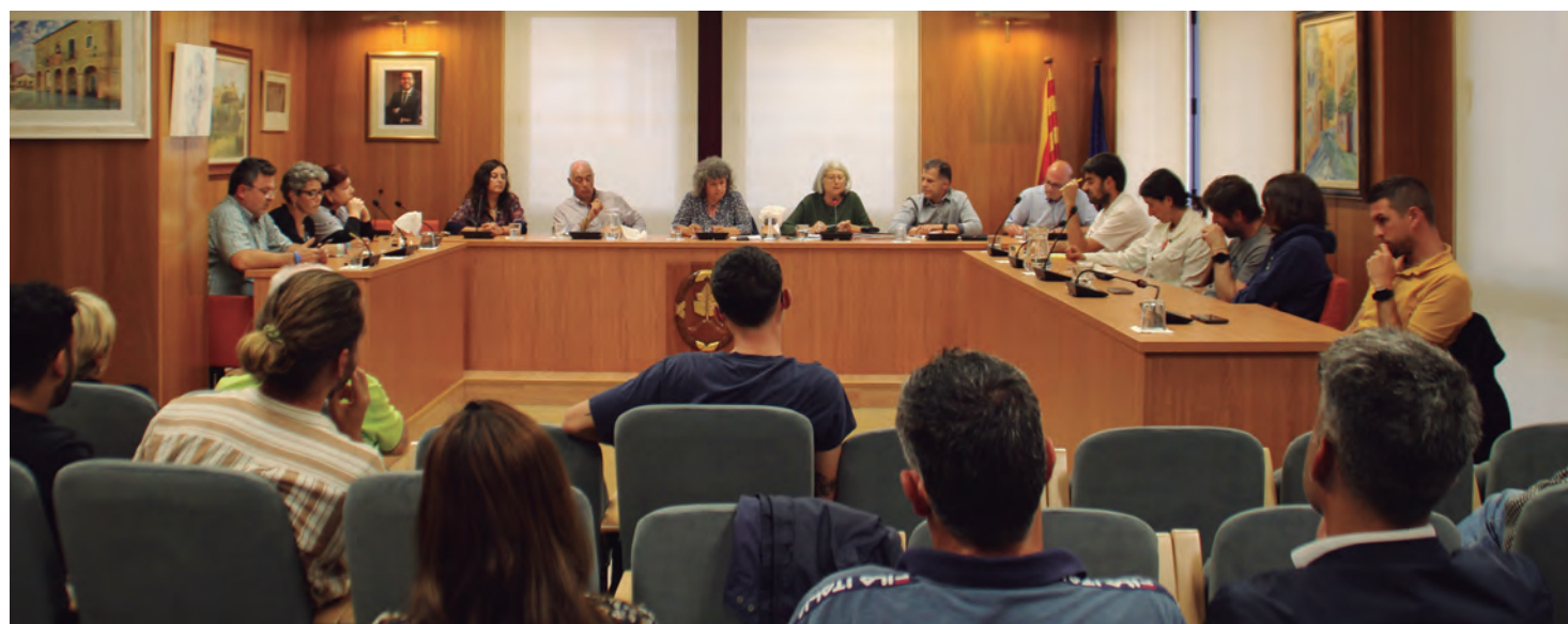
Ple ordinari de maig.

El més important, per la despesa econòmica que suposa, ha sigut l'aprovació del projecte de millora i adequació del canal de la rasa per a gestionar les avingudes d'aigua a través d'aquesta infraestructura, i mitigar les inundacions al barri marítim. Un projecte valorat en 864.000 euros , i que ha sigut aprovat inicialment per passar a ser exposat públicament. Si un cop exposat no es presenten al·legacions, l'aprovació s'eleva a defini-