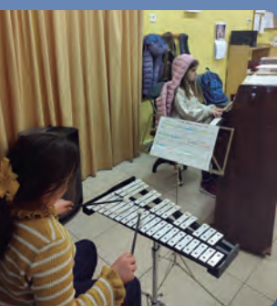
Violí i cambra