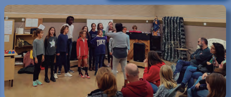
Audició coral grans

Jo faig música per recordar el meu pare que també era músic