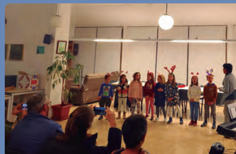
Coral petits a l'esplai