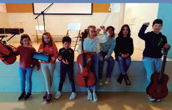
Audició al Roquissar

Jo volia tocar la guitarra perquè el meu cantant preferit toca