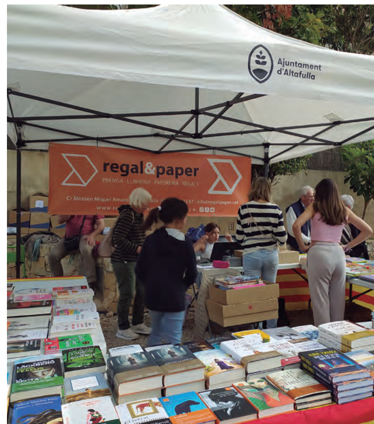
Imatges de la celebració de la fira i activitats de Sant Jordi, al recinte de l'avinguda Marquès de Tamarit.