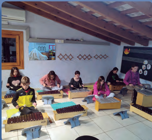
Grup Orff 3