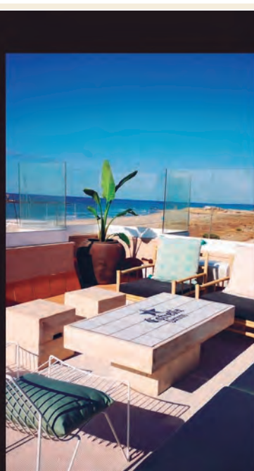
MARITIME BEACH CLUB