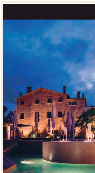
MASIA CAN MARTI