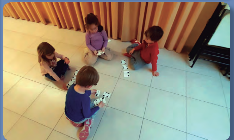
5 anys els més petits!