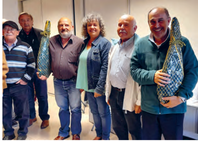
Un total de 34 parelles de dòmino de diferents municipis del Camp Tarragona van omplir l'Open de Dòmino al Centre d'Entitats.