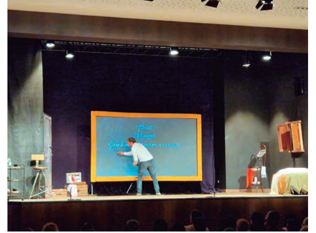
'Trampes de Zorro', la proposta teatral km0 que va omplir la Violeta.