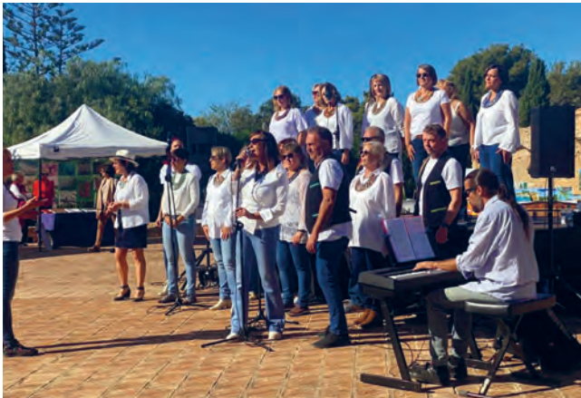
Concert de Gaià Gospel al Mercat d'Art al carrer, a l'Era del Senyor. / Foto: Ajuntament