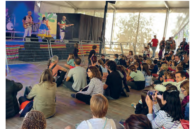
Espectacle infantil 'Lolo, on ets?' amb el grup de versions en català Cat Rock al Parc del Comunidor on grans i petits van xalar de valent.