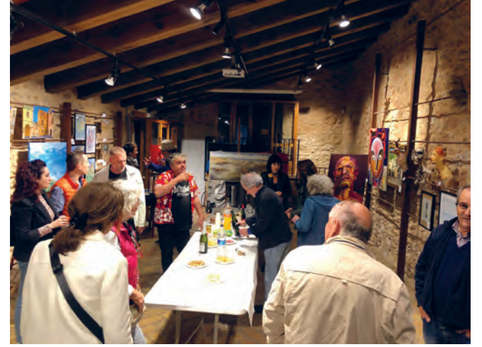
Inauguració de l'exposició col·lectiva de tardor del Cercle Artístic. La podreu veure dissabtes i diumenges fins el 20 de novembre.