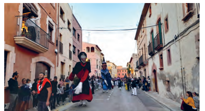
La cercavila amb Gegants i Nans d'Altafulla, Bastoners d'Altafulla, Grup de Diablers Petits d'Altafulla, Castellers d'Altafulla, Grallers d'Altafulla, Grallers de l'Escola de Música; i amb motiu dels 10 anys dels Diablers Petits va venir com a convidada la Colla infantil dels Diablers del Catllar.