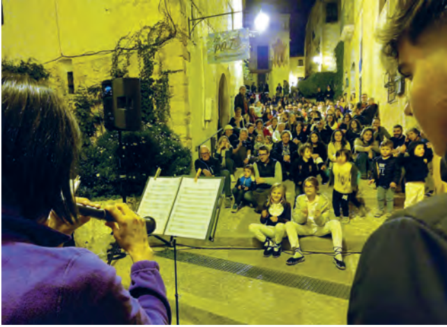
Meravellós concert de gralles amb grallers del Baix Gaià: Grallers del Catllar, grallers de la Torre, gralleres dels Bastoners d'Altafulla i Grallers d'Altafulla.