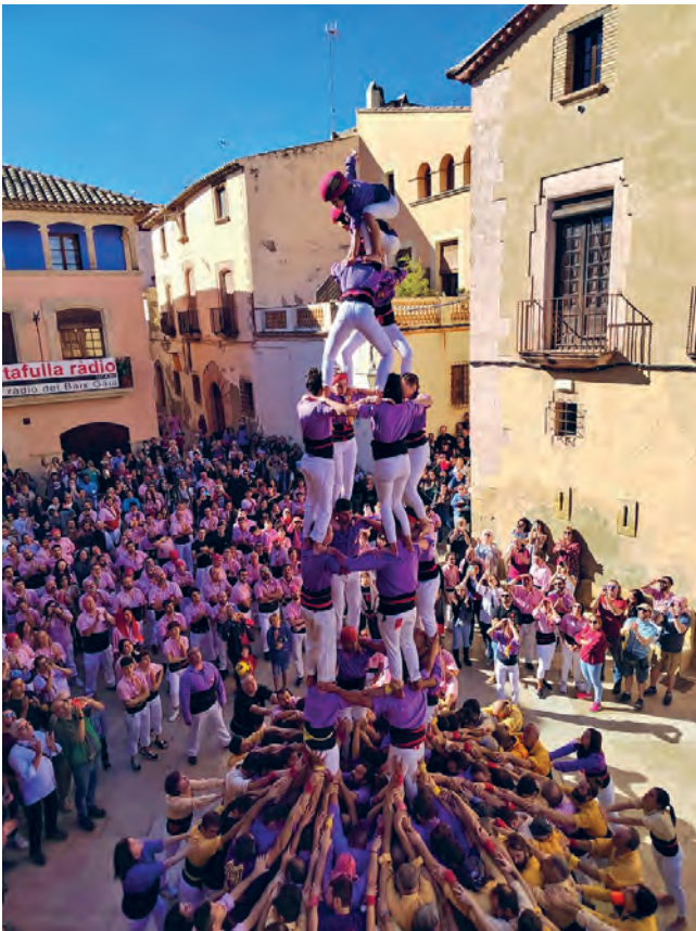
Els Castellers d'Altafulla van descarregar el 4d7, 5d6 i el pilar de 5 en la Diada Castellera de Sant Martí.