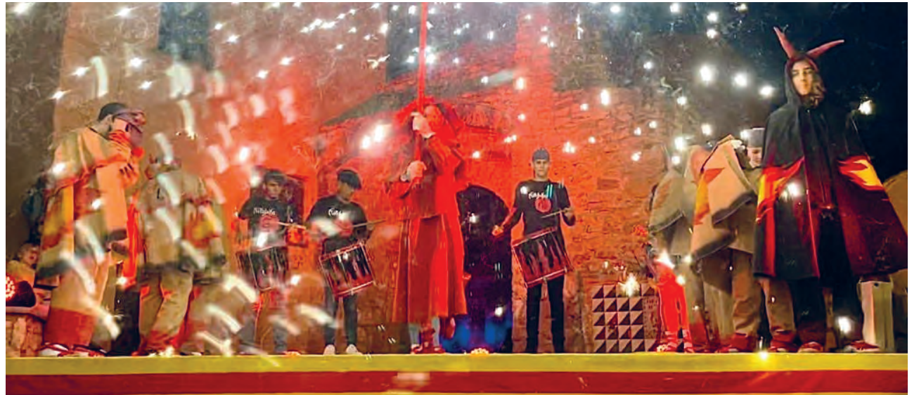
El Correfoc, la carretillada i els versots dels Diablers Petits van culminar el primer cap de setmana de la Festa Major de Sant Martí.