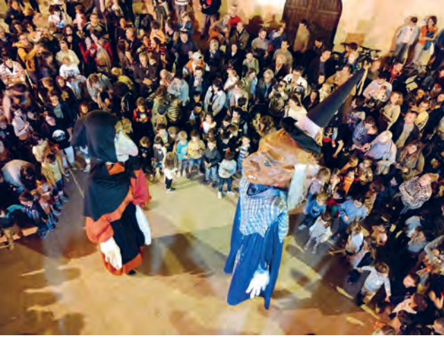
La gran novetat de la Festa Major de Sant Martí, el 'Despertar dels Gegants' que va exhaurir les 200 campanetes que havien posat a la venda.