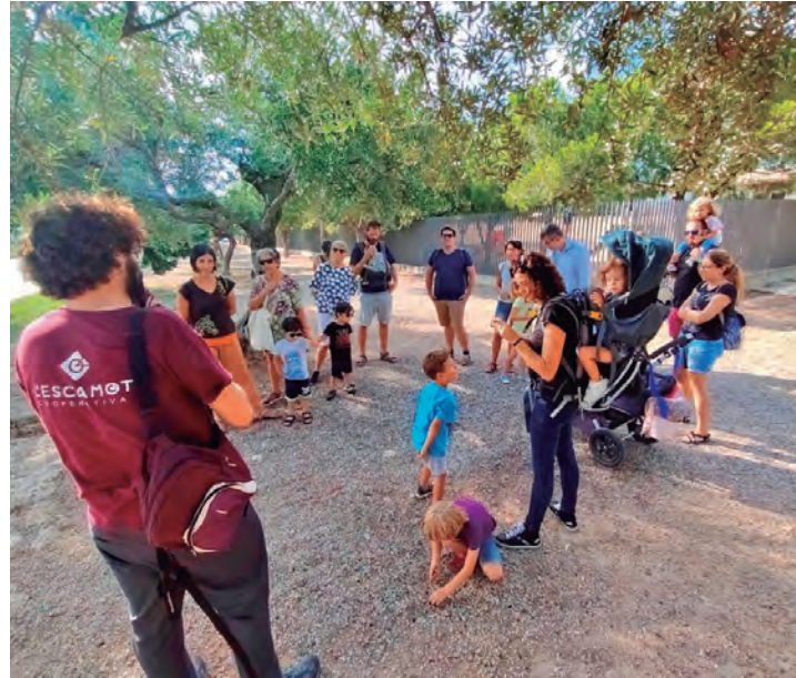
'Passejada crítica! Amb mirada escolar' en la Setmana Europea de la Mobilitat 2022 organitzada per l'Ajuntament i l'Escamot Cooperativa.