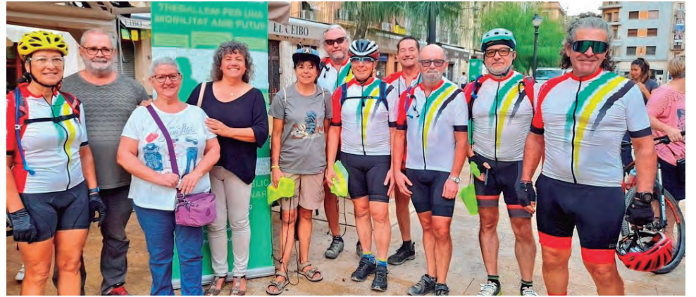
L'Ajuntament d'Altafulla va tornar a liderar el rànquing de municipis que més participació va aportar a la Cursa de Transports de la Setmana Europea de la Mobilitat 2022 amb la col·laboració de la Peña Ciclista.