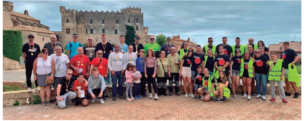
Foto de família amb els guanyadors i guanyadores de la 18a Baixada de Trastos dels Diables d'Altafulla.