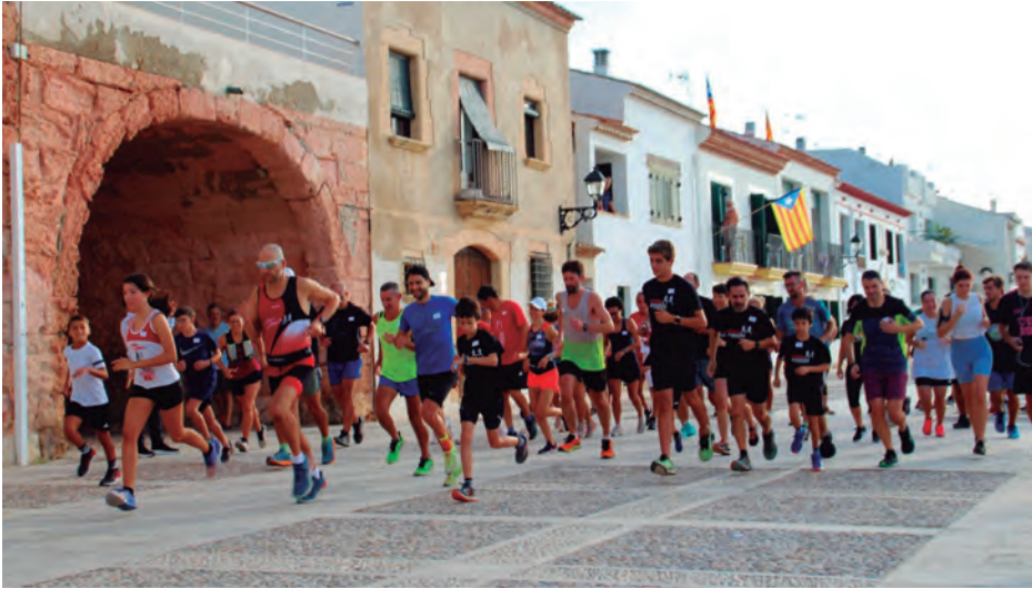
Una seixantena de corredors i corredores en la 24a Pujada a l'Ermita - Memorial Rabassa dels Atletes d'Altafulla.