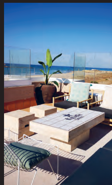
MARITIME BEACH CLUB