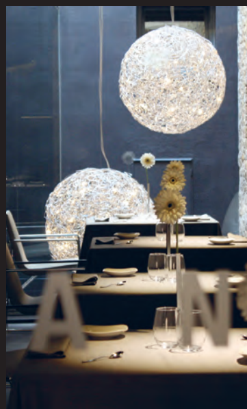
BRUIXES DE BURRIAC BY JAUME DRUDIS