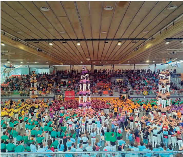
Els Castellers d'Altafulla van descarregar la primera clàssica de 7 de la temporada en un gran Concur7 a Torredembarra pels liles.