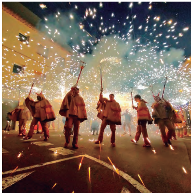
El correfoc dels Diables van tancar oficialment la Petita en una actuació espectacular pels carrers de la Vila Clossa amb el tradicional pilar a la plaça del Pou i amb una bateria de coets final.