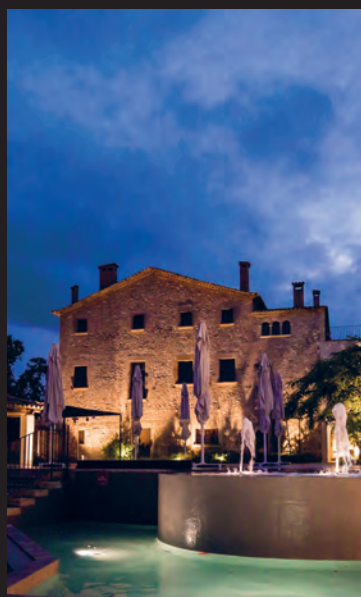
MASIA CAN MARTI