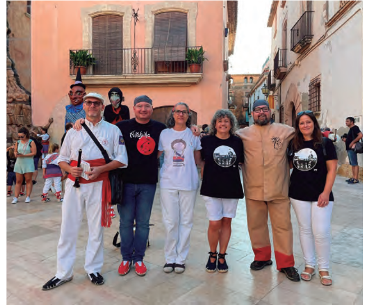
Imatge conjunta dels caps de colla dels Bastoners, els Diables Petits i els Gegants i Nans d'Altafulla abans d'iniciar la cercavila.