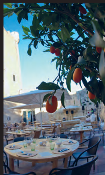
PATI DELS TARONGERS