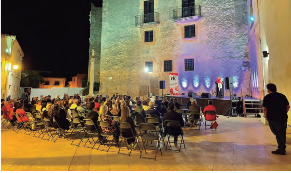
Ple en el 6è Festival Di(vi)nes de la mà de la rapsoda local Joana Badia i la cantautora Lia Sampai.