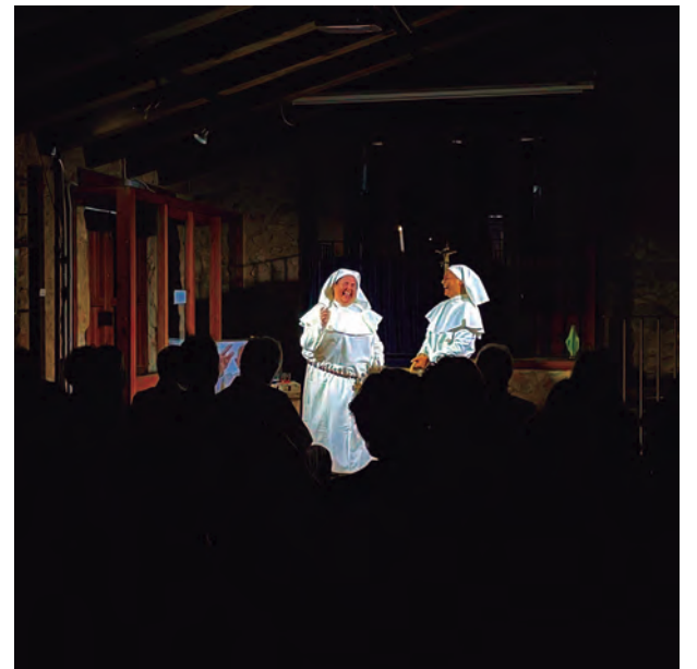
Èxit de públic en el I Festival Faustina de Microteatre que va exhaurir les entrades ofertades.