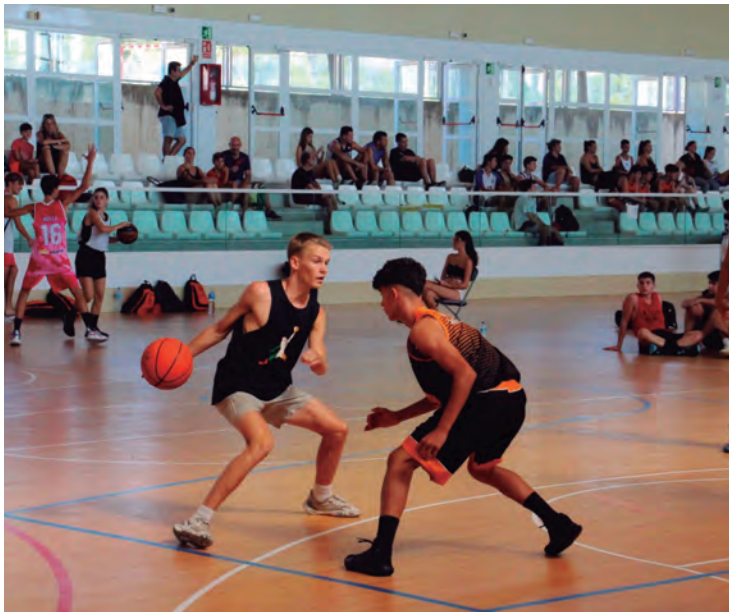
Més de 40 equips van participar en el 3x3 de Bàsquet.