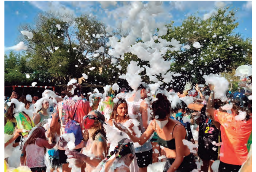
La festa Holi Colours dels Diables, èxit un any més.