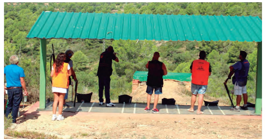
Històric 'Tir al plat' per les festes de 'la Petita'.