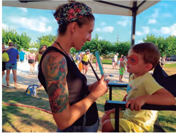
Brises del Mar va celebrar la Festa de l'Escuma amb pintacares i una alta participació.