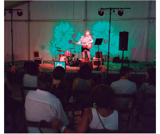
El Jardí Sonor, al Comunidor, per 'la Petita'.