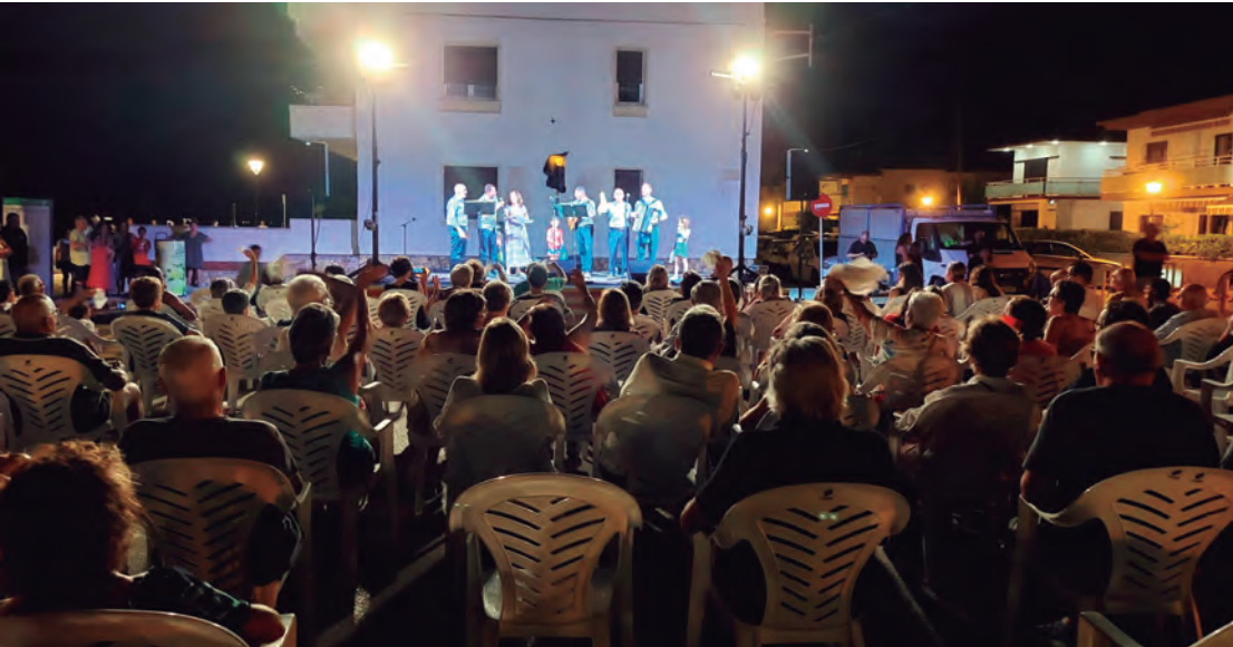
Ple de gom a gom a la tradicional Cantada d'Havaneres.