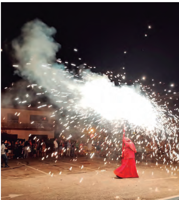
Correfoc dels Diablers a Baix a Mar.