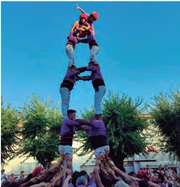
2d6 dels Castellers d'Altafulla en la Diada d'Estiu.