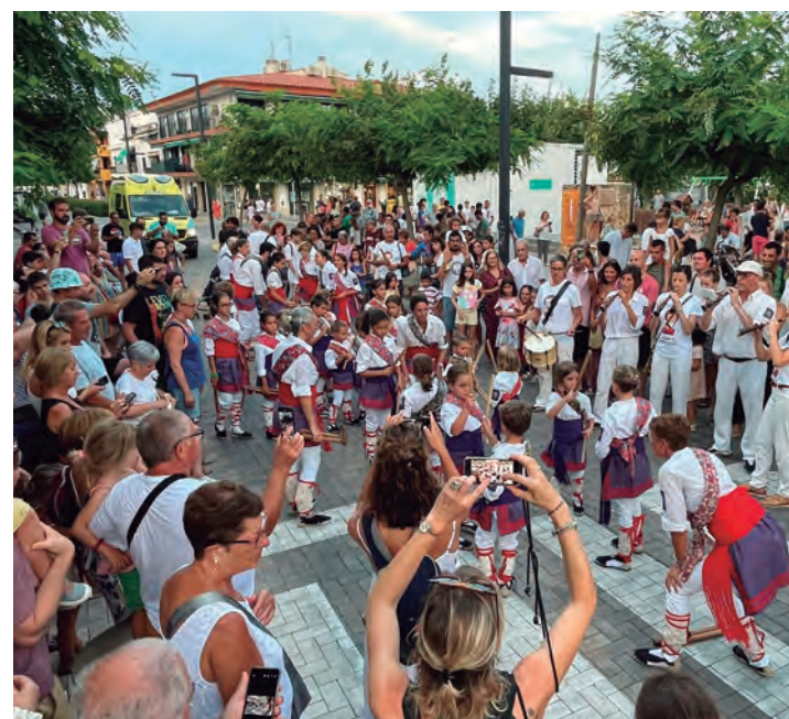
Cercavila d'estiu amb els Gegants i Nans, els Bastoners i els Diablers Petits d'Altafulla. / Fotos: E.V.