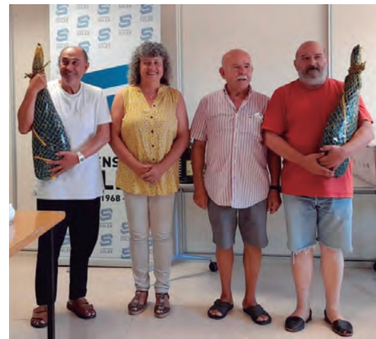
Nombrosa participació en el retorn de l'Open de Dòmino d'Altafulla.