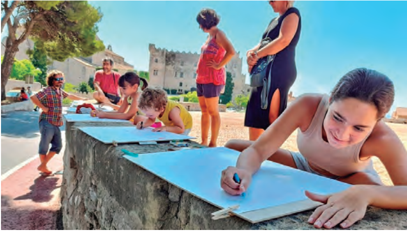
Concurs de dibuix infantil del Cercle Artístic per 'la Petita'.