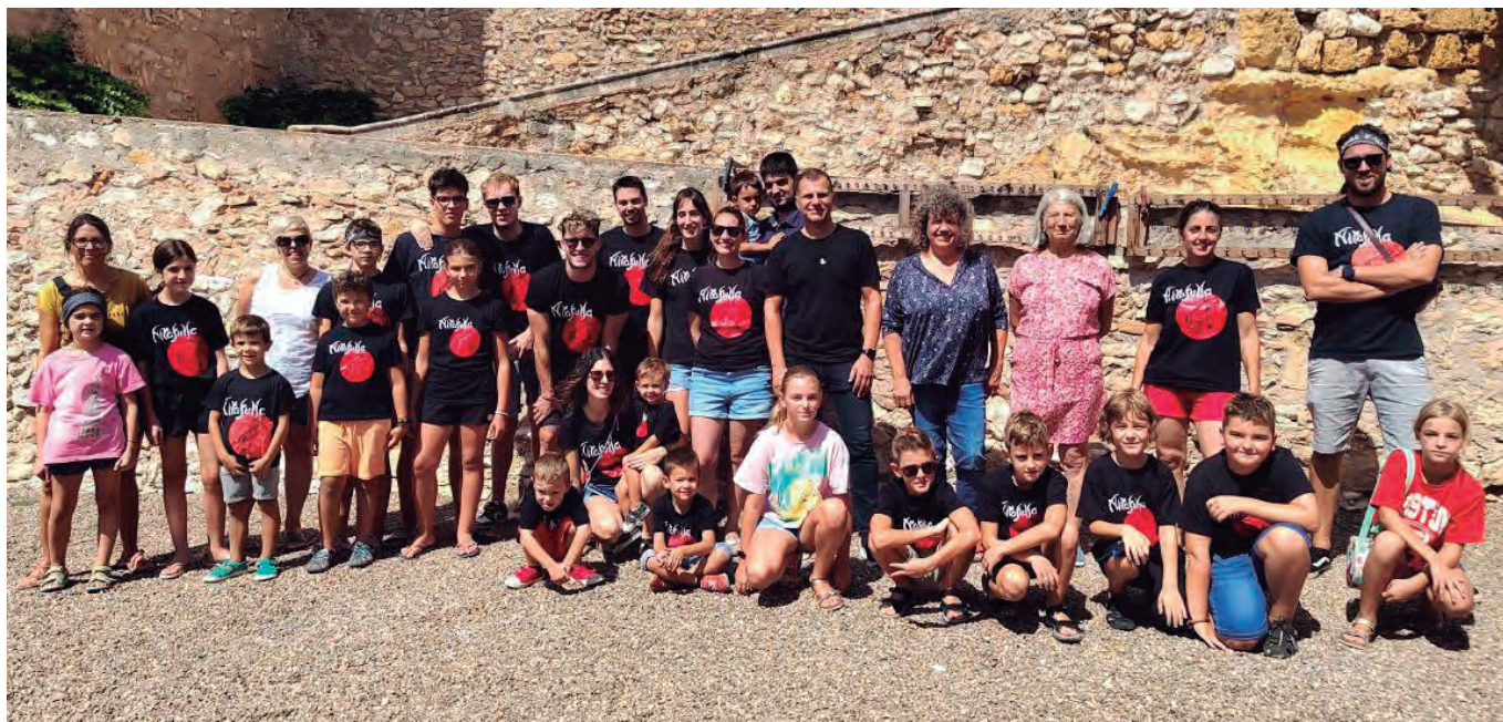
Els Diablers d'Altafulla van donar el tret de sortida a les festes de 'la Petita' amb els coets d'esclat de festa major.