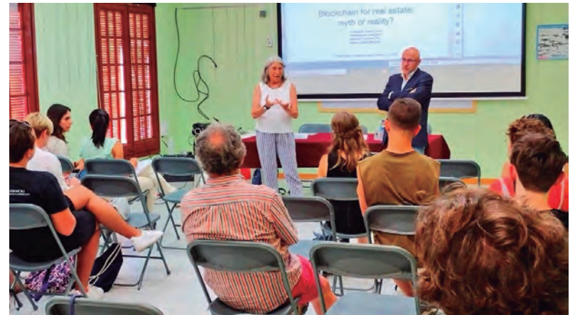
Altafulla va acollir a principi de juliol una sessió d'un curs internacional de la Càtedra UNESCO d'Habitatge de la URV.

ENRENOU DEL RACÓ DE RENAU Oli Verge Extra 100% Arbequina