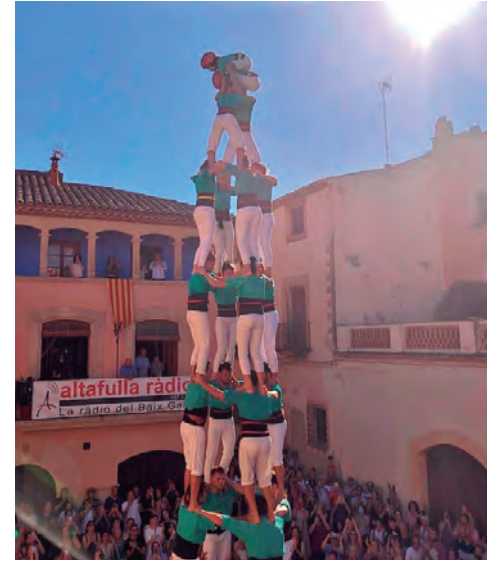
La Diada de les Cultures a la plaça del Pou va veure com els Verds van completar un nou doblet de 9; la Colla Vella de Valls va descarregar el tercer 3de9f de la temporada, i els Castellers d'Altafulla van estrenar els set pisos, mentre que els Xiquets de Tarragona van assolir els castells de vuit. / Fotos: A.J. / CdA