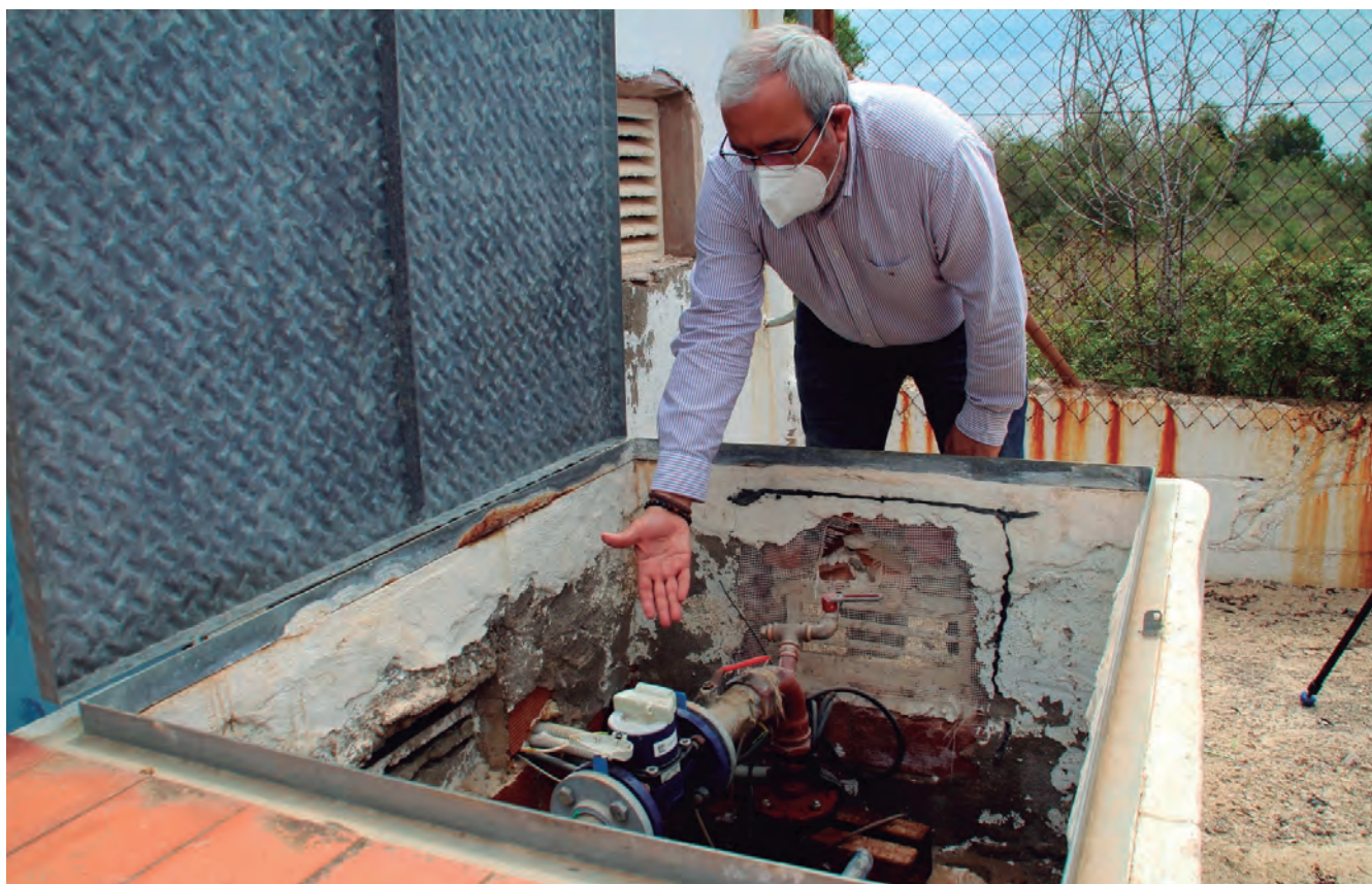
Dipòsit de Brises del Mar.

Els treballs consisteixen tècnicament en la instal·lació d'una canonada d'impulsió de 3.507 metres des del dipòsit de Sant Antoni al dipòsit de Brises del Mar; i la instal·lació d'un grup d'impulsió format per dues bombes multicel·lulars verticals model MXV-50/1603 de Calpeda de 3 KW cadascuna amb variador de freqüència. El projecte ha estat redactat pel despatx d'enginyeria i arquitectura SET enginyeria , i el director de l'obra serà Rafael Cabré.