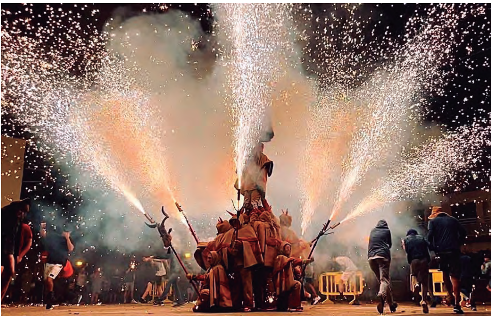
Actuació amb pilar de Foc inclòs del Grup de Diables d'Altafulla en el correfoç que van protagonitzar a Baix a Mar el passat 23 de juliol.