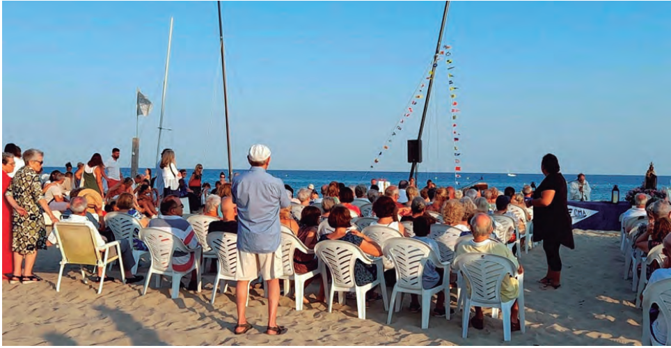
Centenars de persones van participar com cada any en la tradicional processó de la Mare de Déu del Carme.