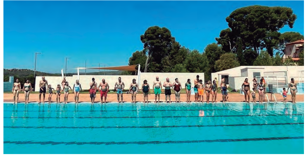
La recaptació definitiva del Mulla't per l'Esclerosi Múltiple a Altafulla va ascendir fins als 622 euros.