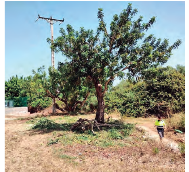
Treballs en camins rurals de Brises del Mar per part de la Brigada.

Gràcies a l'Expedient de Modificació de Crèdit que es va aprovar en el passat Ple de juny, l'Ajuntament d'Altafulla compta amb una partida de 50.000 euros que es destinaran a la remodelació de parcs. D'aquests, una part anirà destinada a la millora del parc infantil de Brises del Mar, demanda que sol·licitava el veïnat de Brises. Els treballs podrien començar a l'octubre. Una de les altres millores que es preveuen per a la tardor és la construcció de la nova rotonda d'accés a Brises del Mar, una petició llargament reivindicada per als veïns i les veïnes del barri que millorarà la seguretat i mobilitat de l'entrada principal de Brises. •