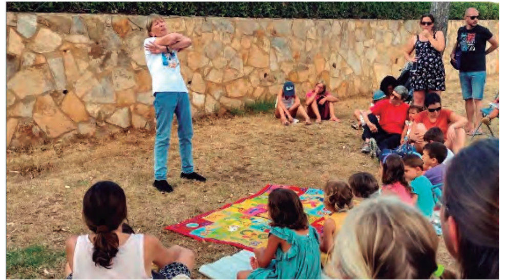
Des del passat 4 de juliol que tant veïns com visitants poden gaudir de la Bibliomar que, més enllà del servei de préstec de llibres, organitza diferents activitats destinades al públic familiar.