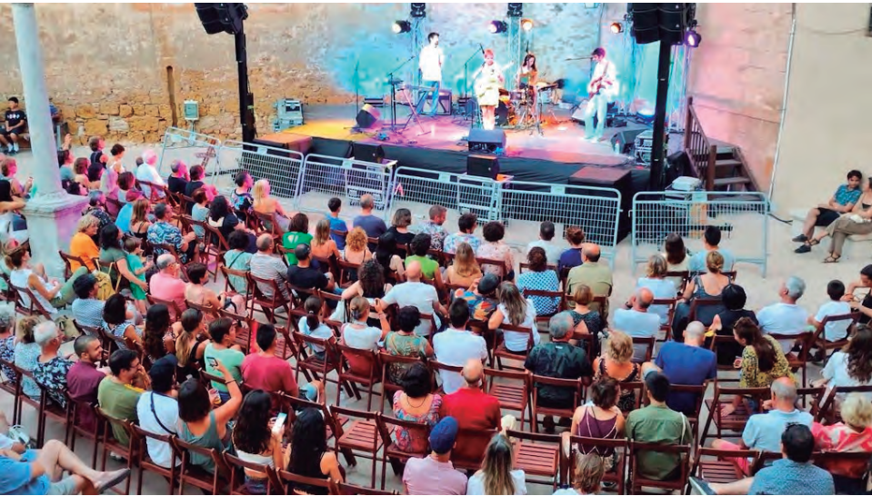
L'Altacústic va tancar amb èxit l'edició del retorn al format original i en la que complia nou edicions.