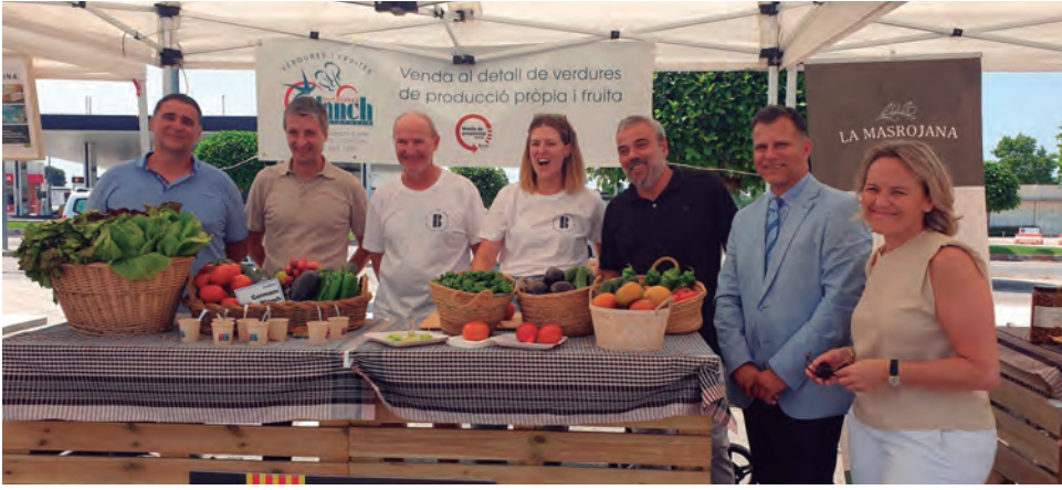
L'horta dels Germans Blanch va reivindicar el seu producte en la fira de proximitat de Caprabo a Altafulla.