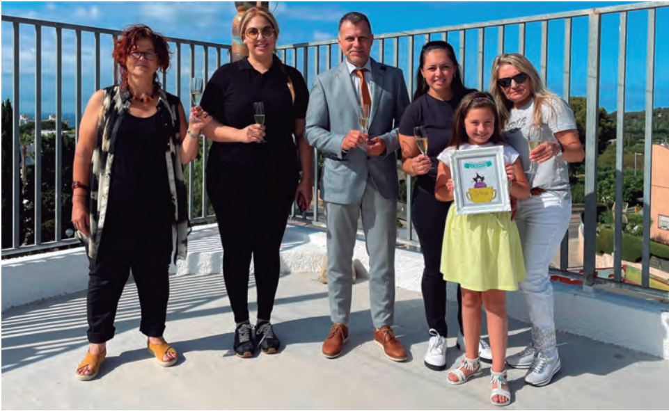
La minihamburguesa de La Bonita, guanyadora de la ruta de tapes bruixes La Xoixeta 2022.