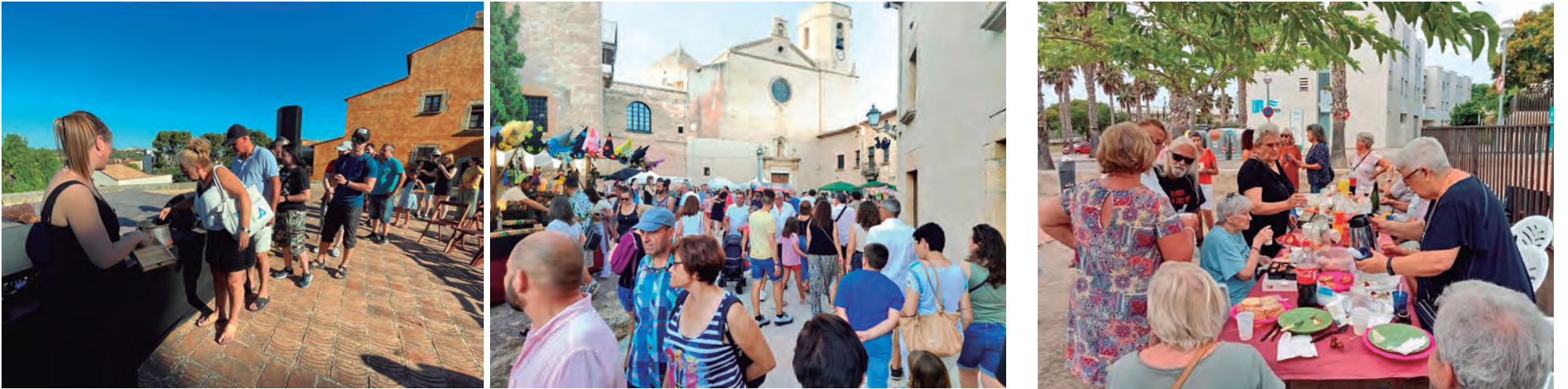
La Nit de Bruixes va recuperar el volum d'activitat i de visitants de les edicions d'abans de la pandèmia.