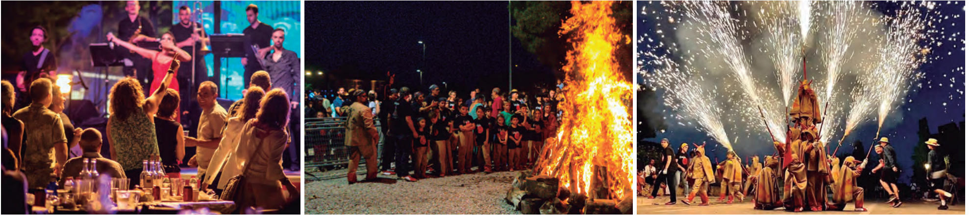
Revetlla de Sant Joan amb sopar, ball i els Diablers Petits d'Altafulla.