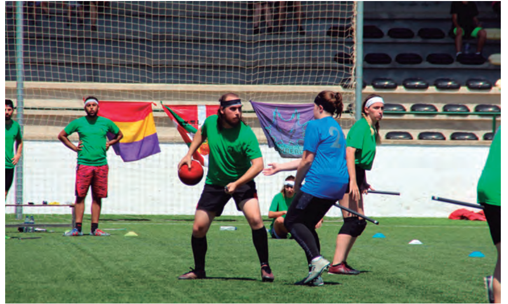
El Torneig del Drac Maragda de Quidditch es podria celebrar de forma anual a Altafulla després de l'èxit assolit de participació.