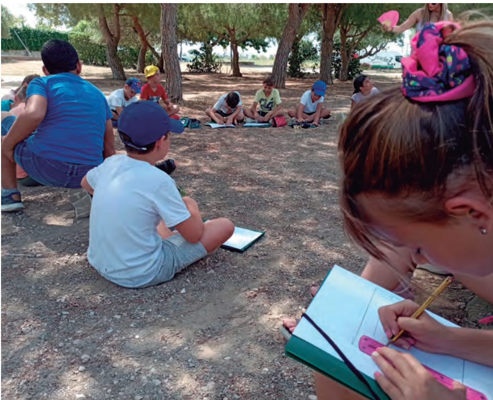
Taller als alumnes de l'Escola La Portalada en el projecte 'Camins Escolars' que començarà a implementar-se al setembre.