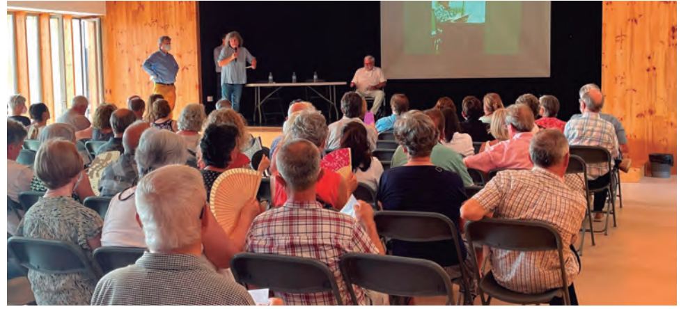
El viròleg i epidemiòleg de reconegut prestigi mundial Albert Bosch va protagonitzar el 8è Memorial Manel Chiva Royo.