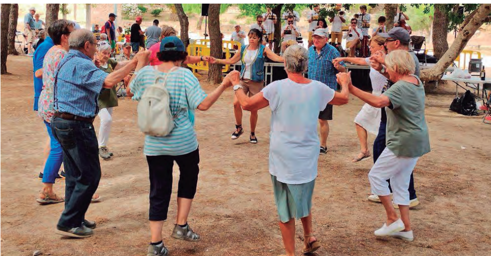
Un centenar de persones celebren el 20è Aplec de Sardanes Vila d'Altafulla al Parc del Comunidor.