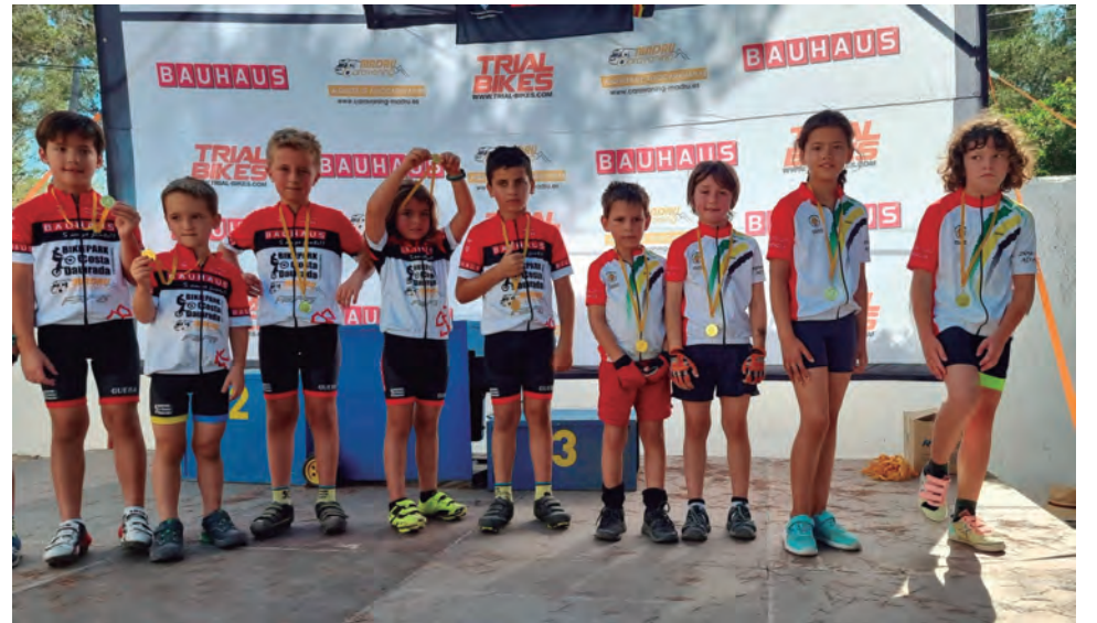
Ciclistes de la secció infantil de la Peña Ciclista Altafulla en el campionat de Catalunya de BTT celebrat a Altafulla.