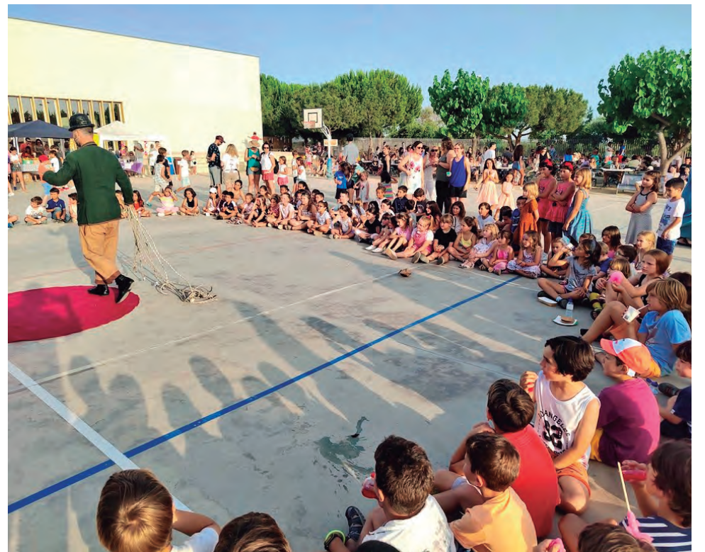
L'AFA de l'Escola La Portalada va organitzar, com és habitual, la gran Festa de Fi de Curs amb diferents espectacles.