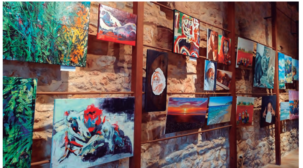
Inauguració de l'exposició col·lectiva del Cercle Artístic a la Pallissa de l'Era del Senyor on es mostra el resultat dels treballs dels diferents artistes.