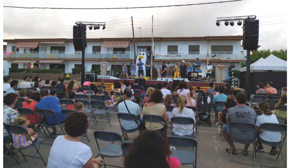
A bord del vaixell Calypso amb la banda musical 'The Penguins' van presentar el seu darrer àlbum a la plaça Consolat de Mar on la canalla i pares i mares van ballar a ritme de reggae.