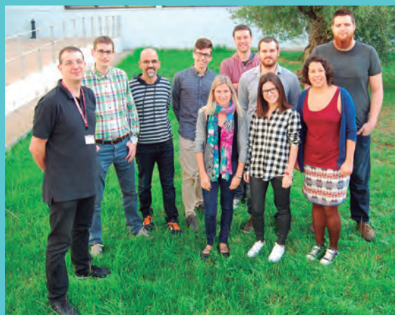
Imatge del grup de recerca en quimioinformàtica de la URV

Sí, però estem bastant acostumats, no sempre podem validar les nostres hipòtesis. De fet ja hem participat en mitja dotzena de concursos i en quatre ja sabem que ens han rebutjat.