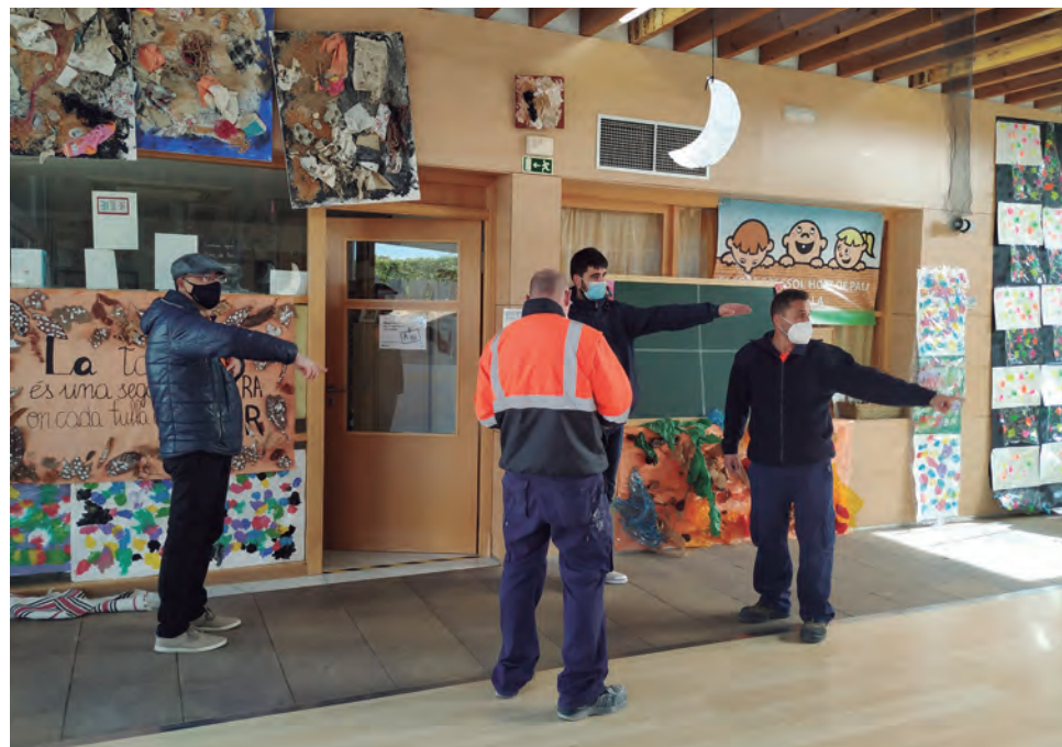
Preparació del dispositiu del 14F.

Des de l'Ajuntament d'Altafulla s'insisteix en la necessitat que tothom es fixi bé en el recorregut que cal fer per accedir al seu centre de votació i que el segueixi correctament tant per entrar com per sortir. L'objectiu és garantir la separació entre votants i evitar concentracions de gent mitjançant itineraris que evitin al màxim la trobada entre persones. A més cal anar a vo-