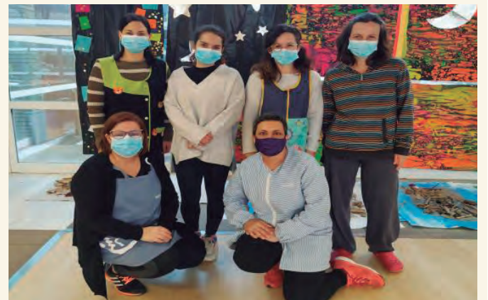
Noves educadores a Hort de Pau.

L'Ajuntament d'Altafulla ha mostrat la seva satisfacció per com s'ha resolt l'aparició d'un cas positiu de coronavirus a la llar d'infants Hort de Pau. En advertir-se, per part de la família de l'alumne, que aquest estava contagiada, es van activar els protocols al centre i es va procedir al confinament del