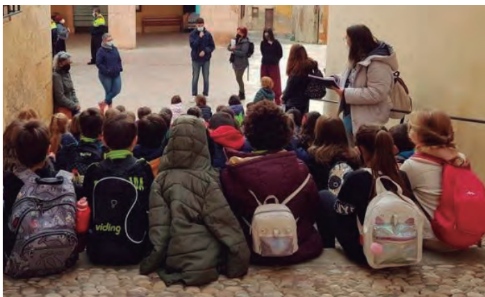
Els infants de visita a l'ajuntament.

L'Ajuntament d'Altafulla ha rebut la visita de l'Escola La Portalada a principi d'aquest mes de febrer. Un grup d'alumnes de tercer de primària ha compartit experiències amb diferents regidors de l'equip de govern, que els han explicat les tasques que tenen i quin és el funcionament de