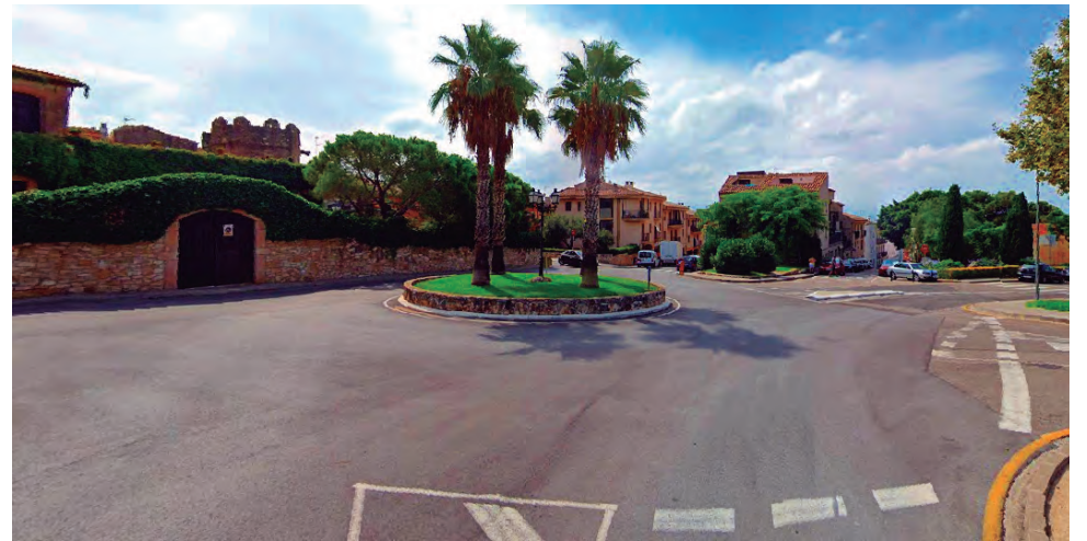
Lloc probable de l'assassinat de Pau Ramon Ramon.

Dels 15 enterrats a Altafulla fa 82 anys només n'hi ha sis d'identificats: