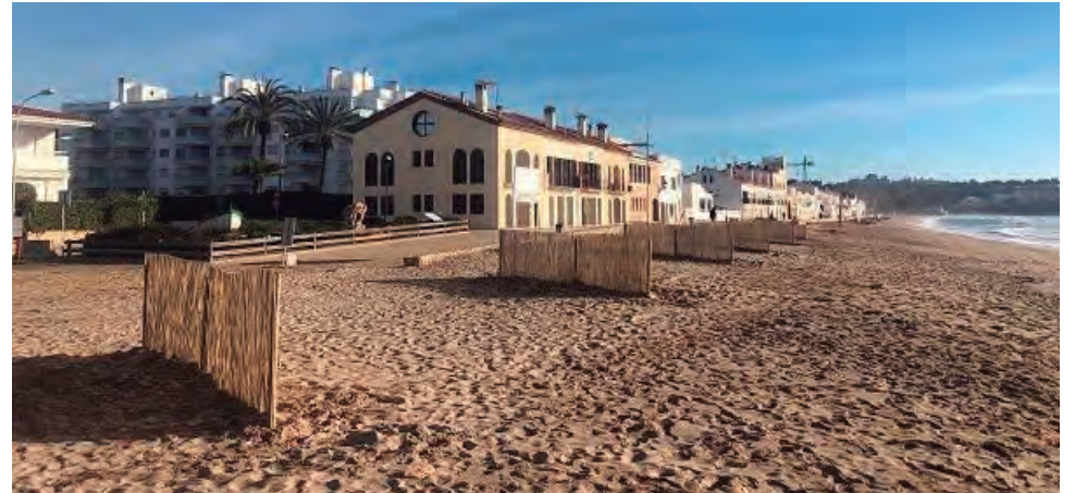
Trampes de captació sedimentària al final del passeig.

biental la Sínia i els alumnes del Programa de Transició al Treball d'auxiliar en vivers i jardins han començat de nou diverses accions vinculades a l'entorn natural d'Altafulla . Aquesta vegada el