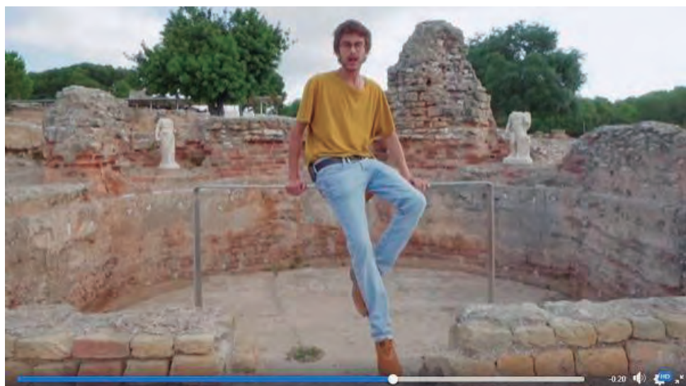
Captura de pantalla del vídeo del Museu d'Història de Catalunya.

La Vil·la romana dels Munts d'Altafulla forma part de la selecció d'elements patrimonials feta pel Museu d'Història de Catalunya per difondre el patrimoni català entre els més joves. A través d'uns vídeos breus que es donen a conèixer per les xarxes socials, el Museu pretén fer arribar la riquesa dels diversos vestigis històrics del país a un ampli ventall de gent . Així, com a representant de la petjada romana a Catalunya, s'ha triat la Vil·la dels Munts, ja que es tracta d'un jaciment molt important per les seves característiques, l'estat de conservació i els elements que s'hi van trobar durant l'excavació.