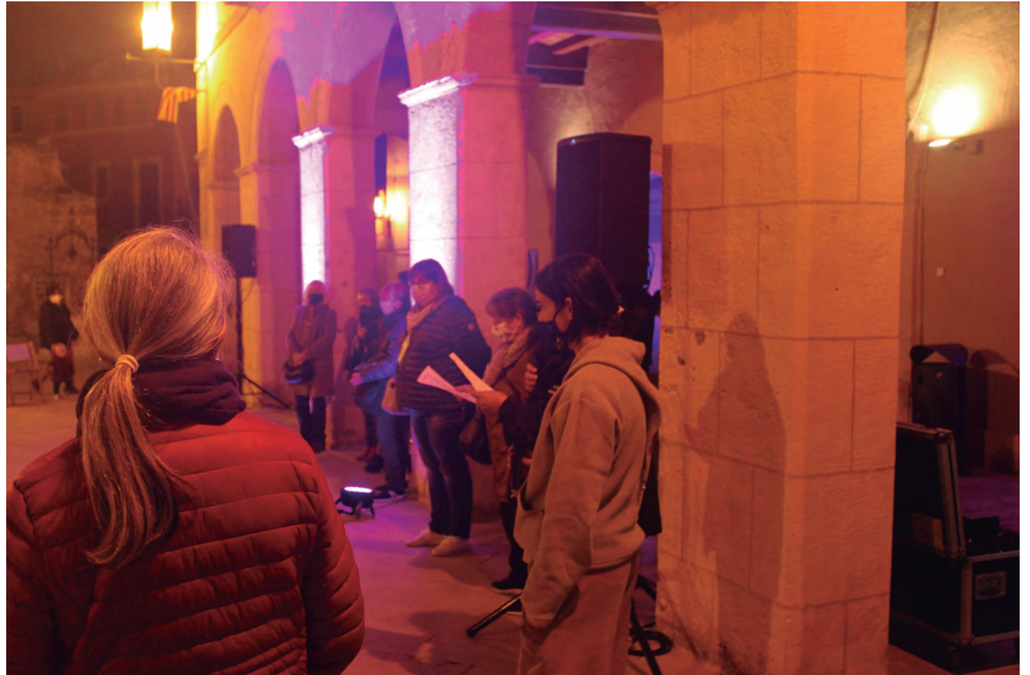
Lectura del #Manifest25N2020 a la plaça del Pou amb el color lila a la façana de l'Ajuntament.

La marxa es farà el dilluns, 14 de desembre, i s'adreça a tot tipus de dones a títol individual i dones que formin part d'alguna entitat local. L'activitat començarà a les 17:30 hores de la tarda a la Plaça del Pou i l' itinerari proposat recorrerà el Parc del Comunidor, l'Estadi Municipal Joan Pijuan, el cementiri, l'Ermida de Sant Antoni, el Parc de Safra-nars, l'estació Altafulla-Tamarit, el Club