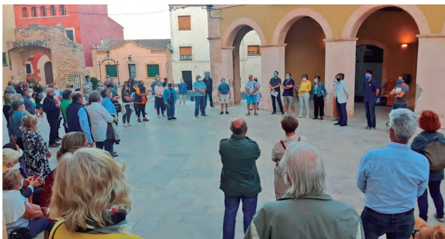
Una hora abans del Ple, un centenar de persones es van concentrar a la plaça del Pou en rebuig a la inhabilitació del president de la Generalitat.