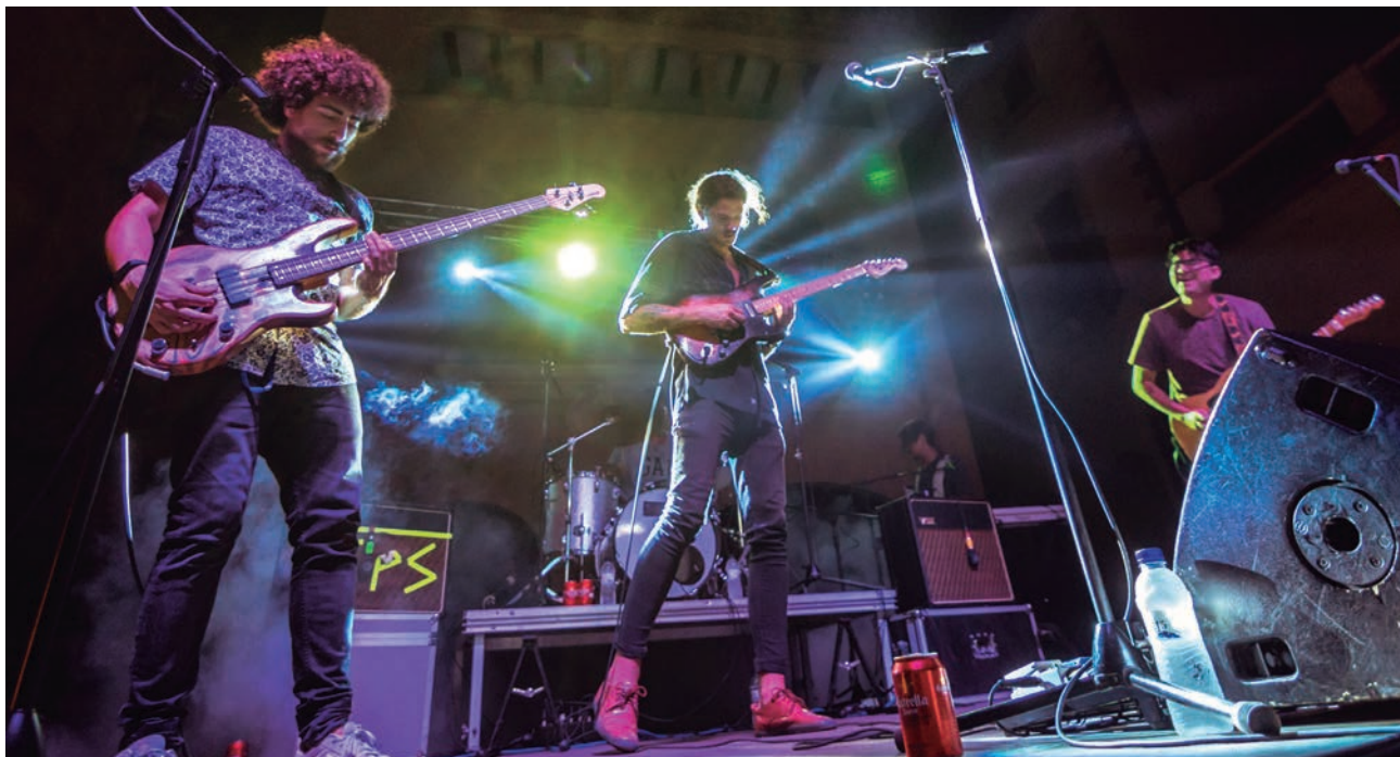
L'Altacústic és un dels esdeveniments que es mantindran.

23 de juny. Revetlla de Sant Joan virtual. Segueix-la a les xarxes socials de l'Ajuntament.