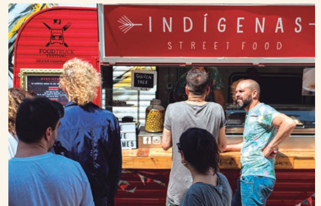
Una de les food truck que participen al Pleamar Vintage Market d'Altafulla.

En el pla d'usos de la platja que ha d'aprovar la Generalitat encara consta la guingueta damunt la sorra, tal com constava en anys anteriors si bé feia un parell de temporades que no s'hi instal·lava. Ara, amb les modificacions introduïdes, s'espera que la Direcció General de Costes doni el vistiplau a la nova ubicació i es pugui licitar el servei en breu. Una autorització que, quan entri en vigor el nou pla d'usos de la platja, al 2022, ja no serà necessària perquè la guingueta es trobarà sobre terreny municipal, al Parc de Voramar. •