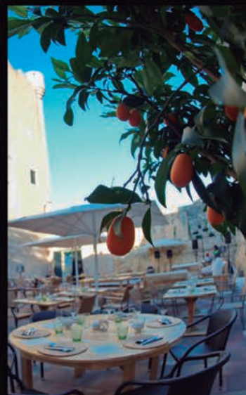
PATI DELS TARONGERS