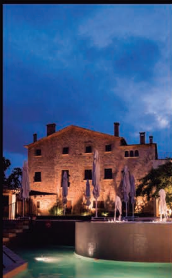
MASIA CAN MARTI