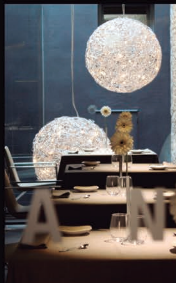
BRUIXES DE BURRIAC BY JAUME DRUDIS