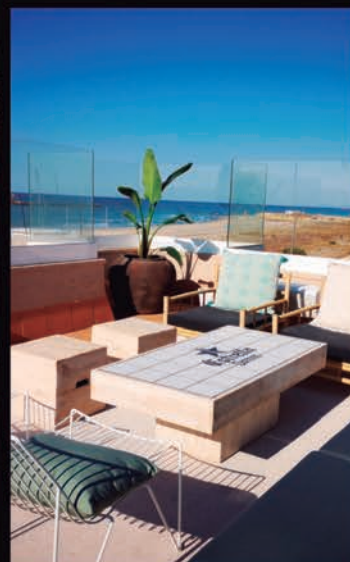
MARITIME BEACH CLUB