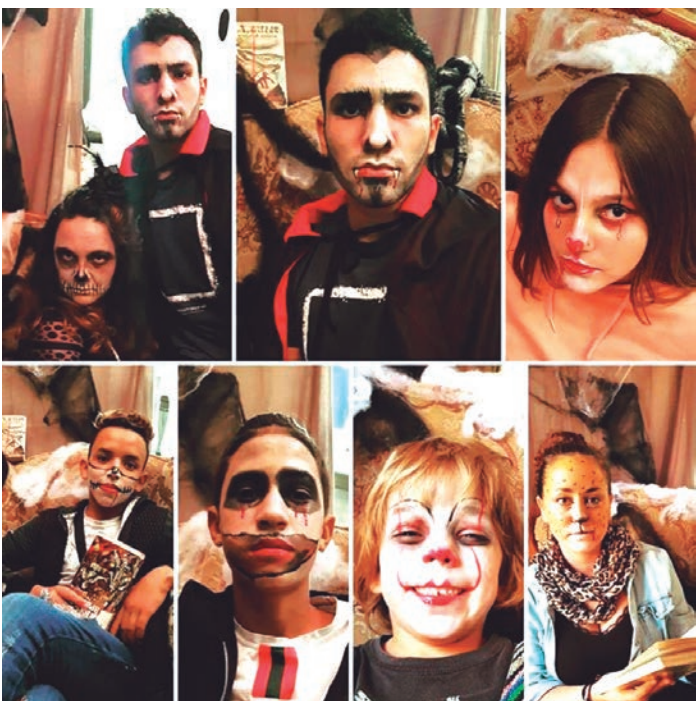
El Punt d'Informació Juvenil va organitzar el passat 25 d'octubre una tarda plena de terror amb motiu de Halloween. / Foto: PIJ Altafulla