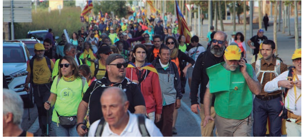
Altafulla va ser un dels municipis pel qual va transcorre una de les Marxes per la Llibertat.