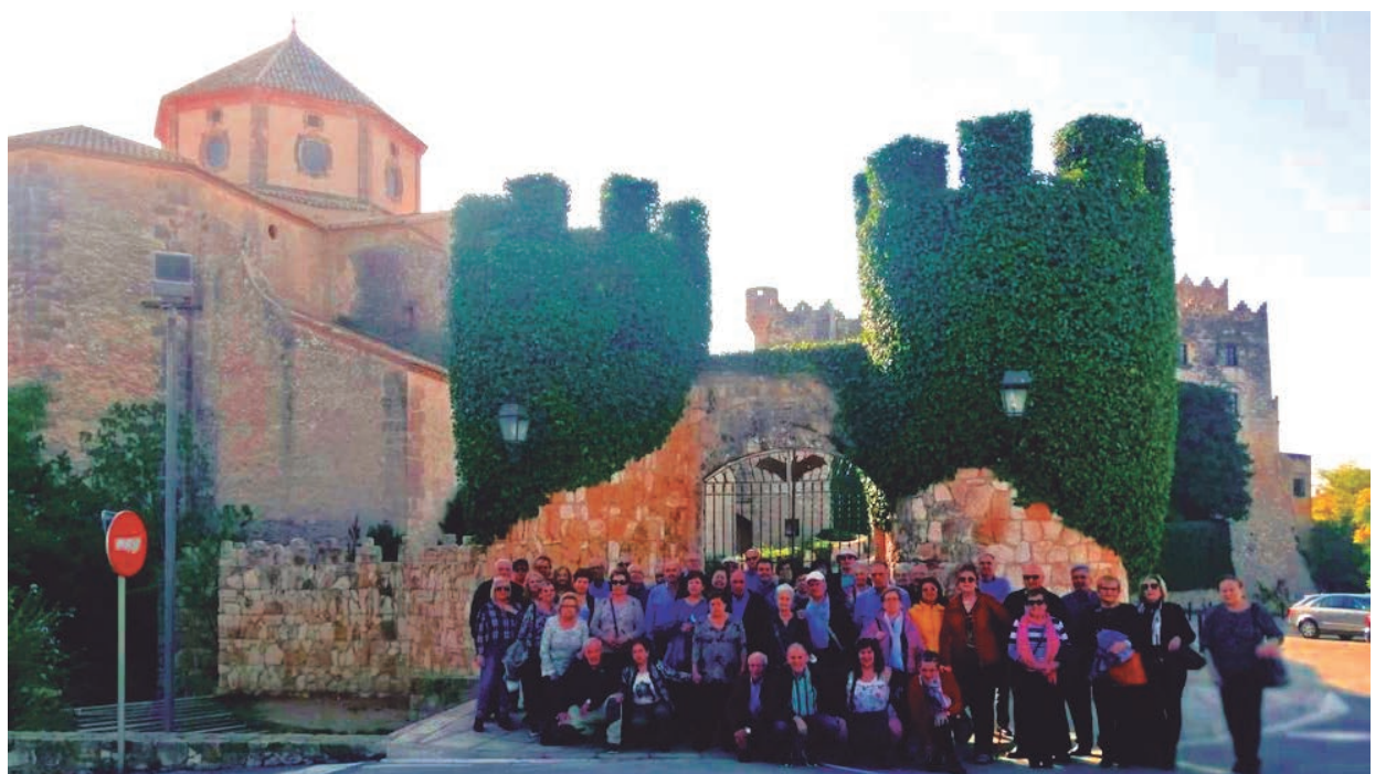
Unes 150 persones provinents de la Seu d'Urgell van visitar el darrer cap de setmana d'octubre la Vila Closa d'Altafulla.