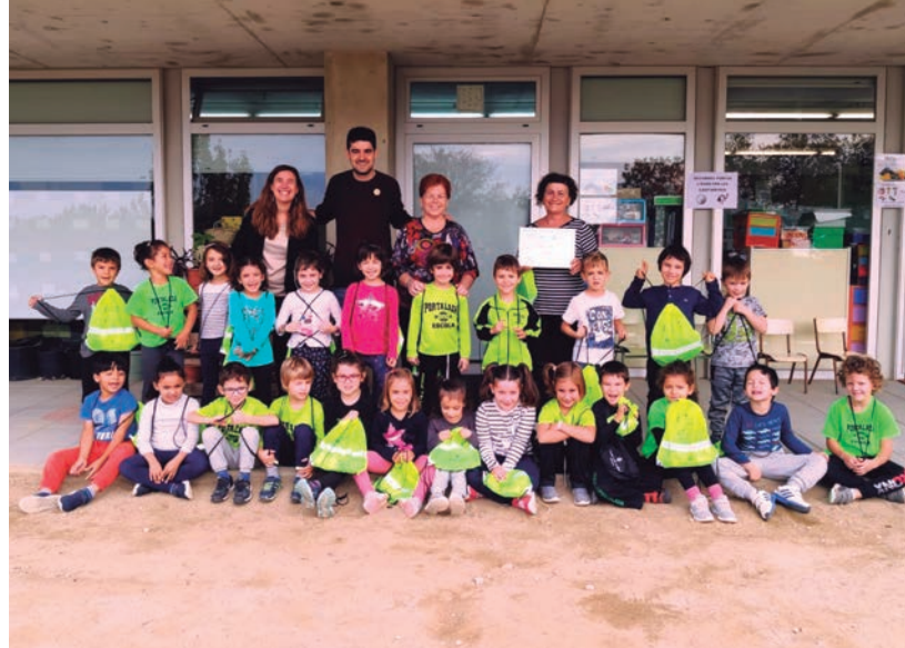
Els alumnes de P5 B de la Portalada, i de 6è del Roquissar, guanyadors dels Semàfors Verds de la Mobilitat.