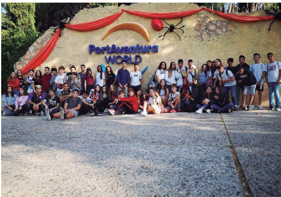
Sortida a Port Aventura dels joves de la zona TRAC (Torredembarra, Roda de Berà, Altafulla, Creixell i La Riera de Gaià).