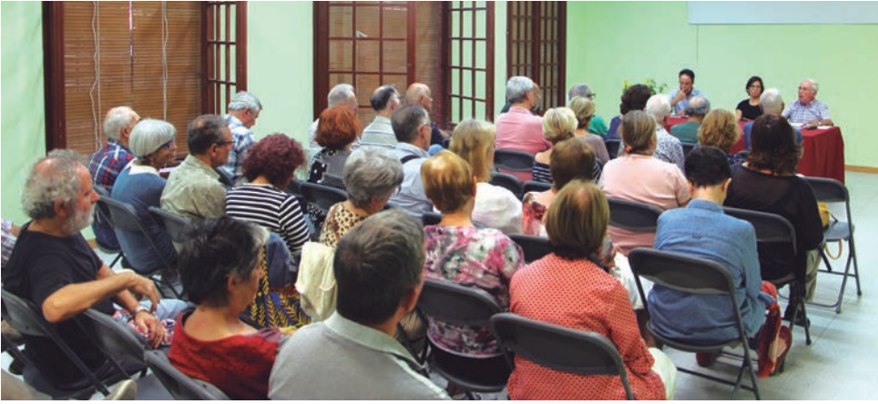
La Memòria Històrica de la Guerra Civil va ser enguany la temàtica del Cicle de Conferències de Tardor del Centre d'Estudis.