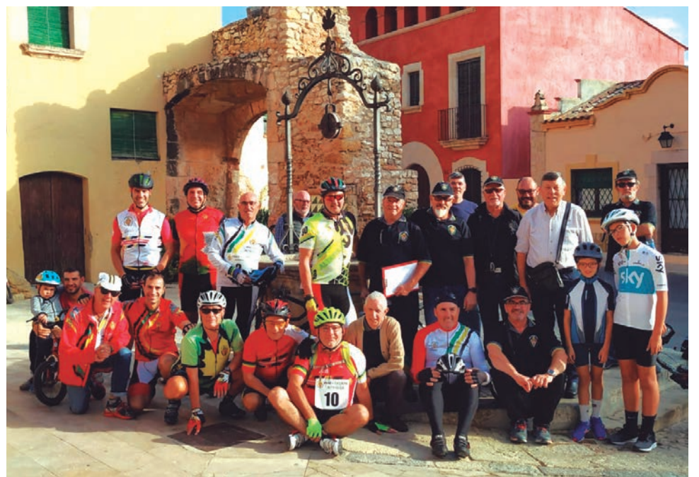
Una trentena de ciclistes van participar en la 35a Pujada a l'Ermita de Sant Antoni, que organitza la Penya Ciclista.