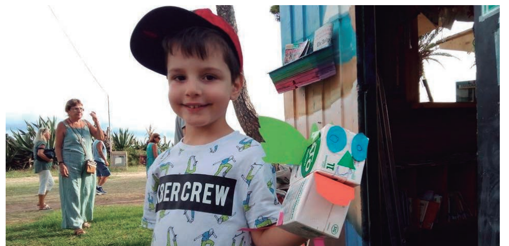
Un dels tallers de la Bibliomar, dedicat a l'elaboració de titelles fetes amb brics de llet.