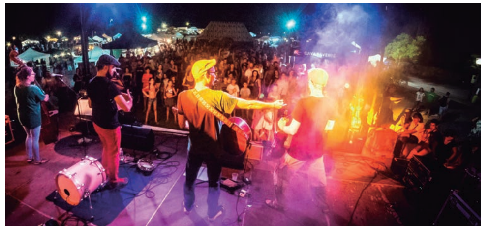
El grup torrenc de folk "Julivert" a la Fira d'Artesans d'Altafulla.