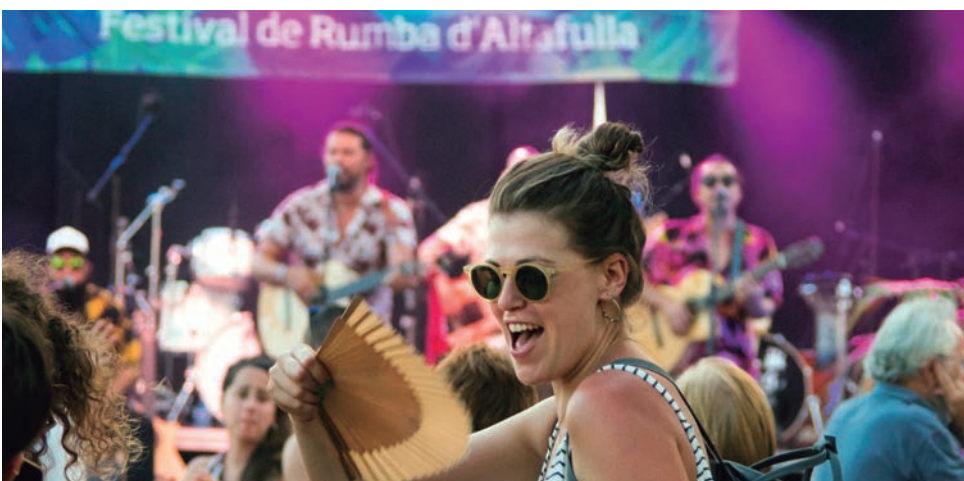
Un cop més, l'ambient festiu va envair el Parc de Voramar amb l'Afterbeach Rumbero.