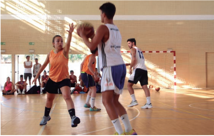
Nou èxit de participants al 26è 3x3 de Bàsquet al Pavelló Municipal d'Esports.