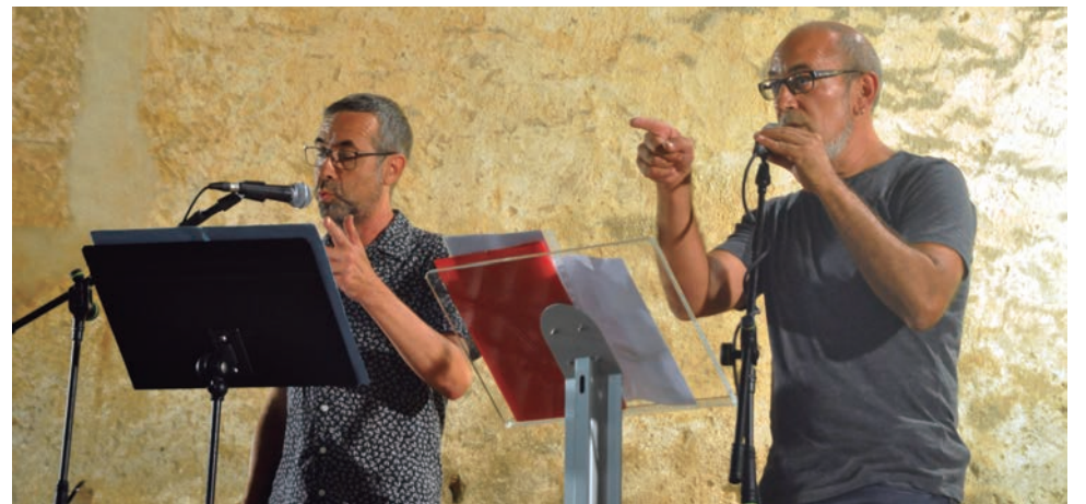
21a Nit de Piano i Poemes d'Altafulla, a la plaça de l'Església.