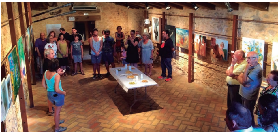
Exposició col·lectiva del Cercle Artístic a la Pallissa de l'Era del Senyor.