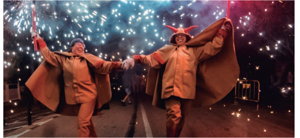
Correfoc amb els Diables d'Altafulla, la Bèstia la Farnaca i els Cagarrires de Cambrils a Baix a Mar.