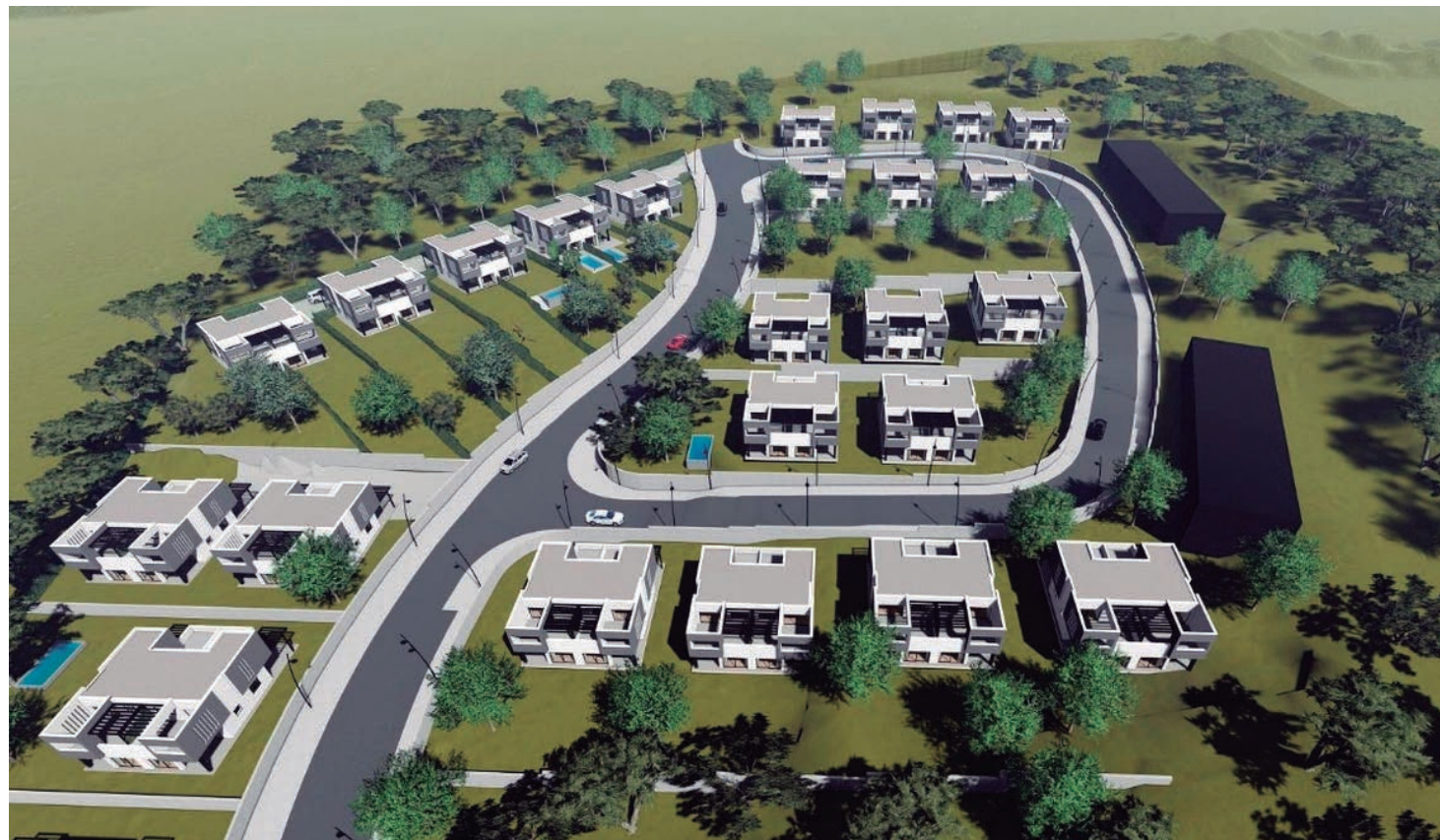
La proposta inicial planteja 62 xalets d'entre 125 i 215 m 2 a la cara exterior de la Ronda

La voluntat dels tres sectors afectats d'iniciar de manera imminent la urbanització de tota aquesta zona ha condicionat els terminis del consistori a l'hora de posar solució a les disfuncions que presenten. És per això que ha decidit suspendre de manera potestativa la tramitació de plans urbanístics derivats i de projectes de gestió urbanística i d'urbanització, així com l'atorgament de les llicències de parcel·lació de terrenys, d'obres, i d'edificació. Una suspen-