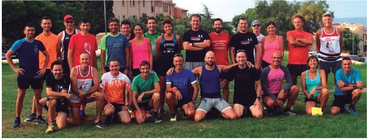
Els Atletes d'Altafulla comencen els entrenaments per a la nova temporada 2019-2020.