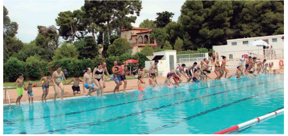
El "Mulla't" va recaptar 479 € a la Piscina Municipal que se sumen als 500 € que dona l'Ajuntament d'Altafulla en favor de la Fundació Esclerosi Múltiple.