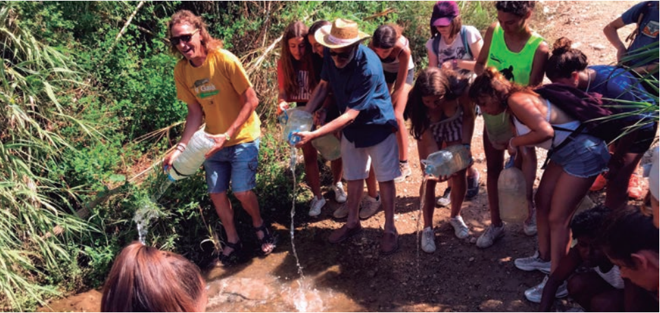
L'Associació Mediambiental La Sínia d'Altafulla es va sumar a l'acció reivindicativa "Big Jump" en defensa dels rius, en concret, el Gaià.