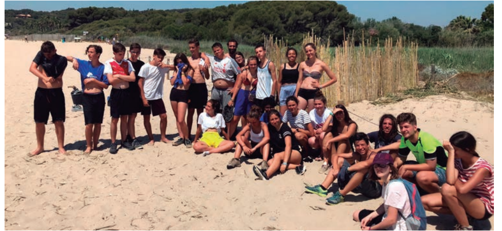
Un total de 24 joves d'arreu de Catalunya van participar al "Camp de Treball del Gaià: Un món entre Altafulla i Tamarit".