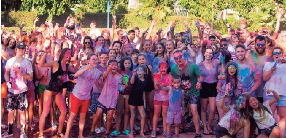
Una de les cites ineludibles en el calendari d'estiu és la Festa Holi Colours dels Diables d'Altafulla.