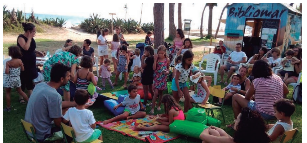
La Bibliomar d'Altafulla ofereix al Parc de Voramar a l'estiu diferents activitats, entre les quals destaquen els contacontes.