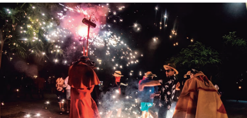
Els Diables d'Altafulla i els Diables de La Canonja van protagonitzar el Correfoc d'Estiu a Baix a Mar.