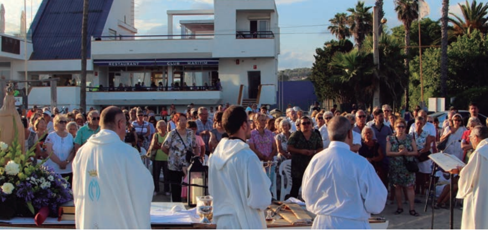
Més de 200 persones van retre homenatge a la Mare de Déu del Carme pels carrers de Baix a Mar.