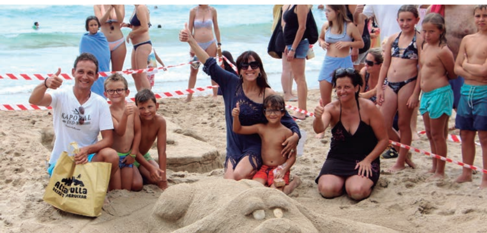
Més de 40 persones i 21 equips van participar en el Concurs de Castells de Sorra d'Altafulla.