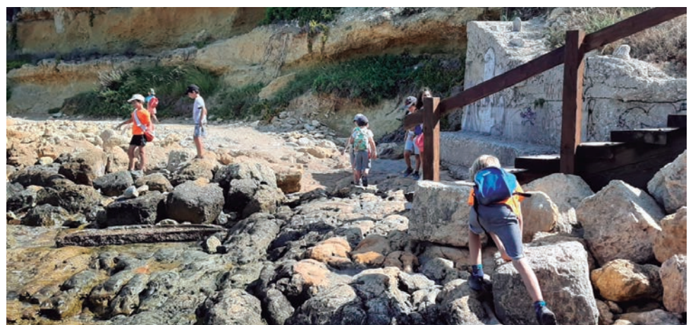
El Gepec organitza a la Finca Canyadell d'Altafulla un campus d'estiu adreçat als més petits.