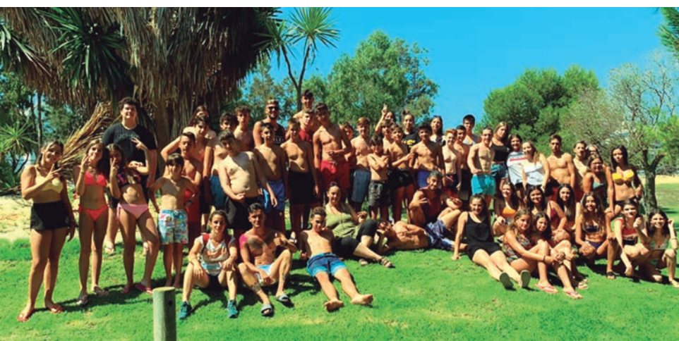
Més de 40 joves de la zona TRAC van participar en la sortida a l'Aquopolis.