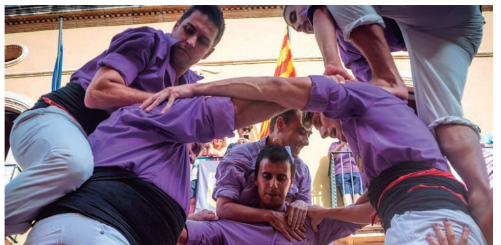
Els Castellers d'Altafulla van fer la primera clàssica de 7 del curs a la Diada de les Cultures, i el primer 5d6 de la temporada a la Diada d'Estiu.