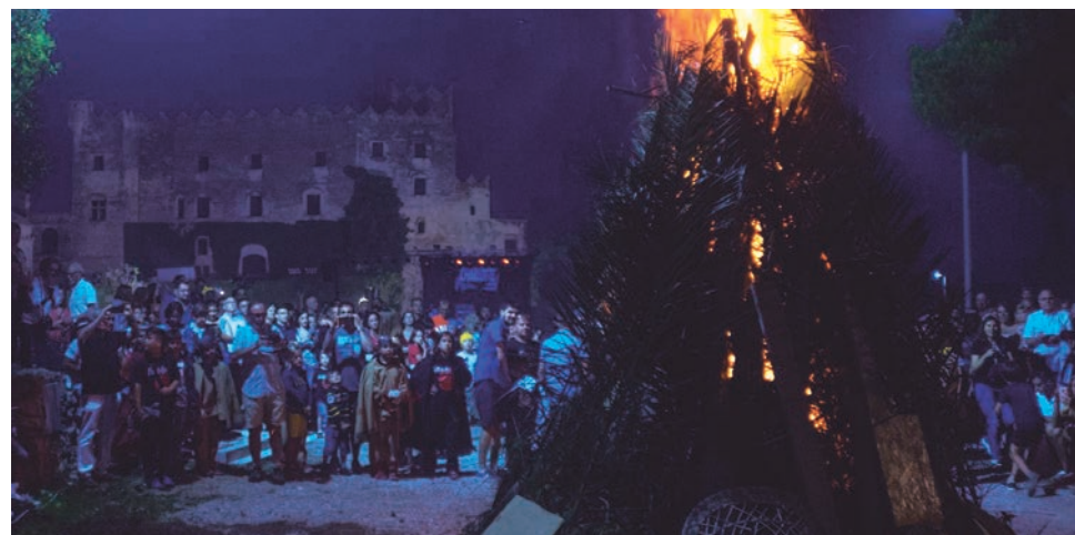
Un total de 350 persones van omplir la revetlla de Sant Joan davant del Castell on els Diables Petits van ser els encarregats de posar-hi el foc.