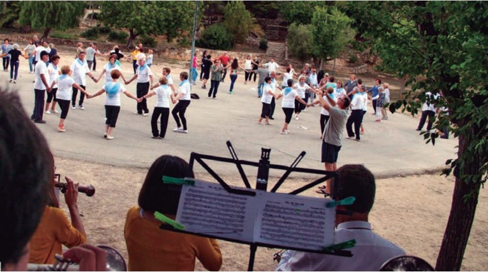
El 19è Aplec de Sardanes "Vila d'Altafulla" va reunir prop de 300 persones al parc del Comundor.