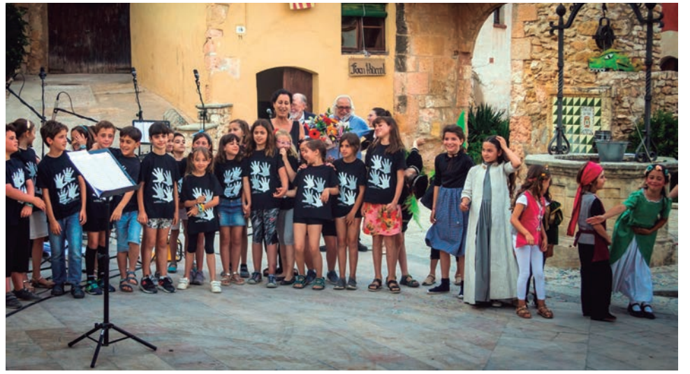
L'òpera infantil "Vet aquí que una vegada" va omplir de gom a gom la plaça del Pou el passat 21 de juny.