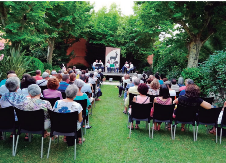
Els Grallers d'Altafulla van ser els convidats d'honor en un concert als jardins del Museu Deu del Vendrell.