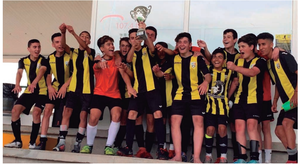
El cadet A del CE Altafulla es va endur el trofeu de campió de l'Altafulla Summer Trophy en una nova edició d'èxit.