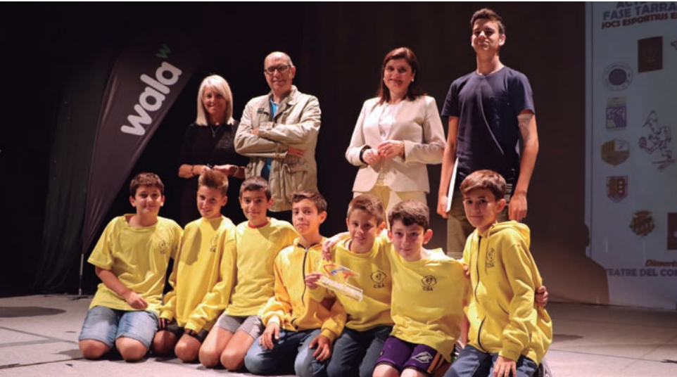
Els alevins del CB Altafulla van rebre el reconeixement de campions dels Jocs Esportius Escolars de Catalunya al Tarragonès.