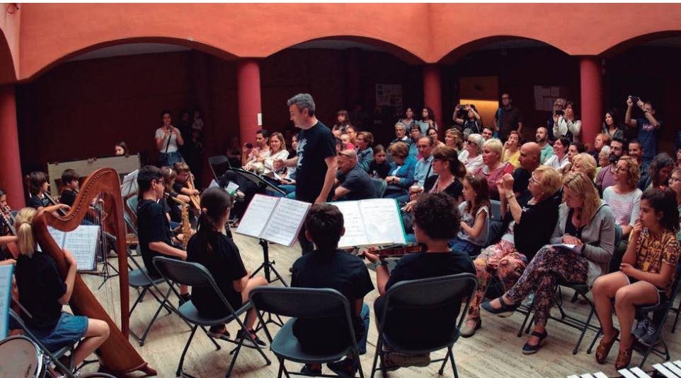
Com és habitual, els alumnes de l'Escola de Música van ser els protagonistes d'un concert de final de curs al pati de la Violeta.