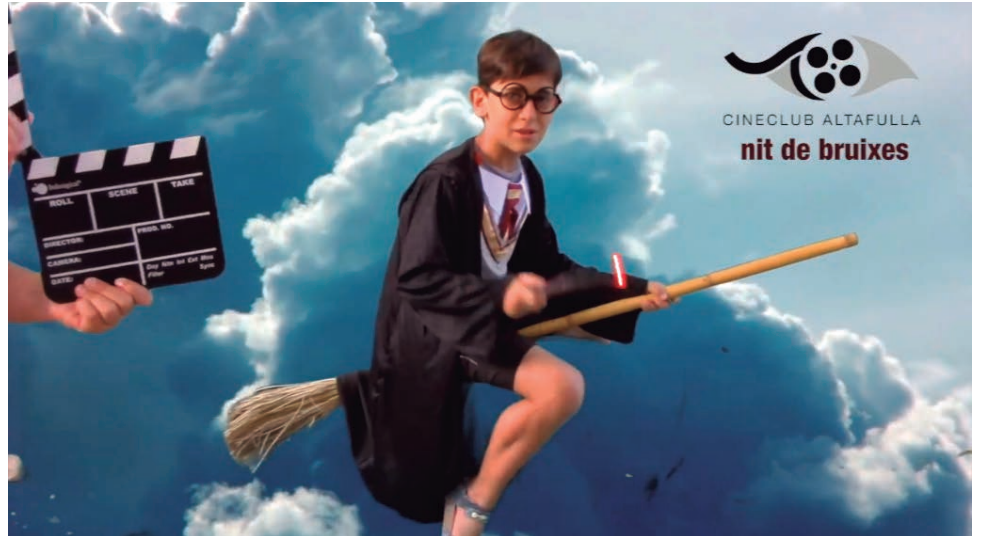
Per celebrar el 10è aniversari, el Cineclub Altafulla Link va participar a la Nit de Bruixes amb un taller on els infants van protagonitzar una escena de Harry Potter.