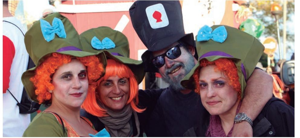
“Alicia en el país de las maravillas”, de la carrossa The Machines.