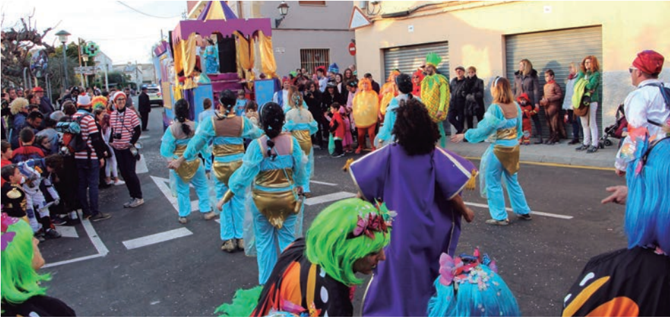
Carrossa d'“Aladí”, dels Castellers d'Altafulla.