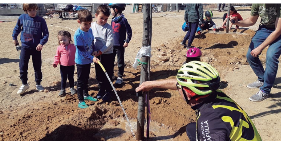
Quatre alzines, al parc de Clot de Torrell, amb motiu del Dia de l'Arbre.