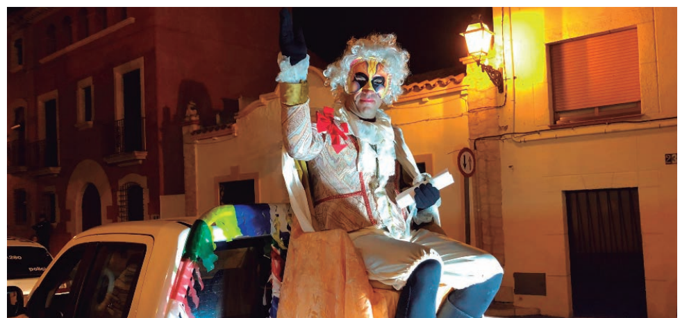
El pregó de Sa Majestat Carnestoltes, a la plaça del Pou.