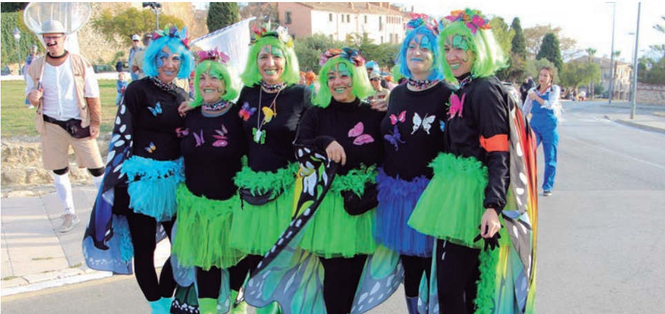
Els “Caçadors de papallones”, de la comparsa La unión hace la juega.