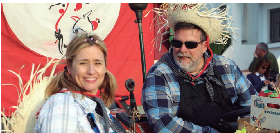
Els “Grangers”, de la carrossa dels Diables d'Altafulla.