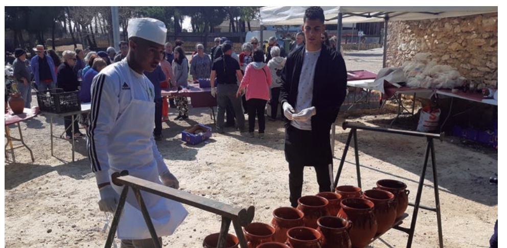
Els joves de l'Alberg van participar activament en la 38a Festa de l'Olla.