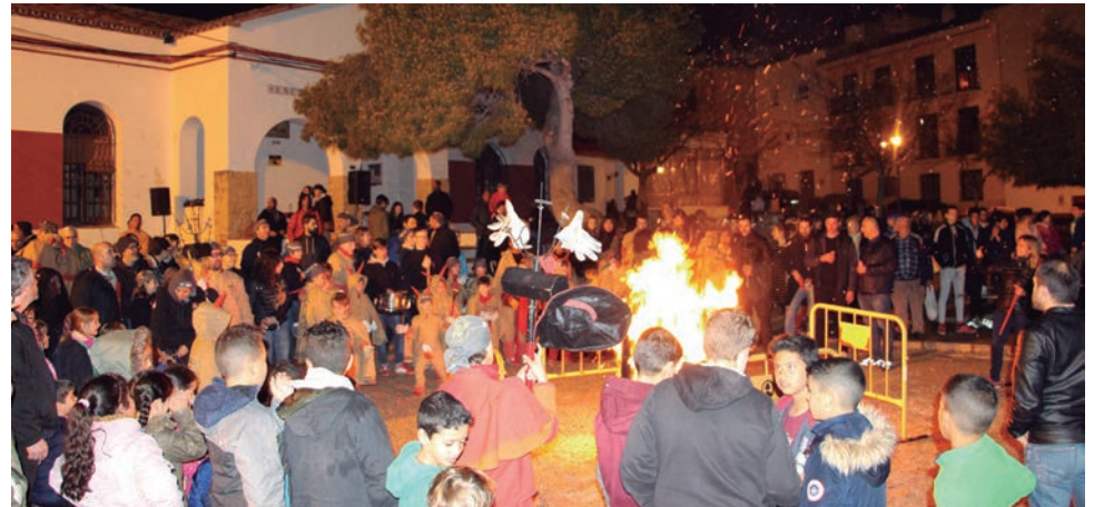
Els Diables Petits i Grans van participar en el tradicional Enterrament de la Sardina.