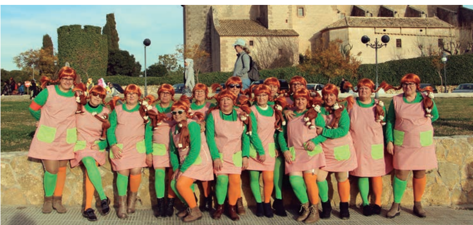
La comparses de “Pipi calzaslargas”, de la tradicional Jet Set.