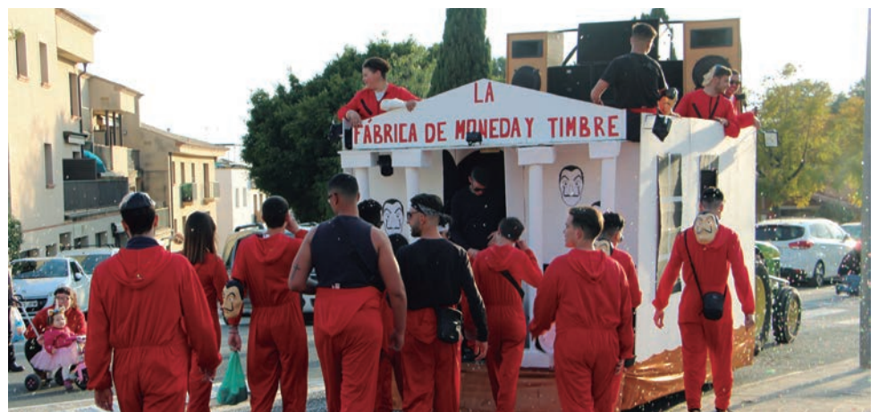
La carrossa de Los Fulleros amb “La Casa de Papel”.