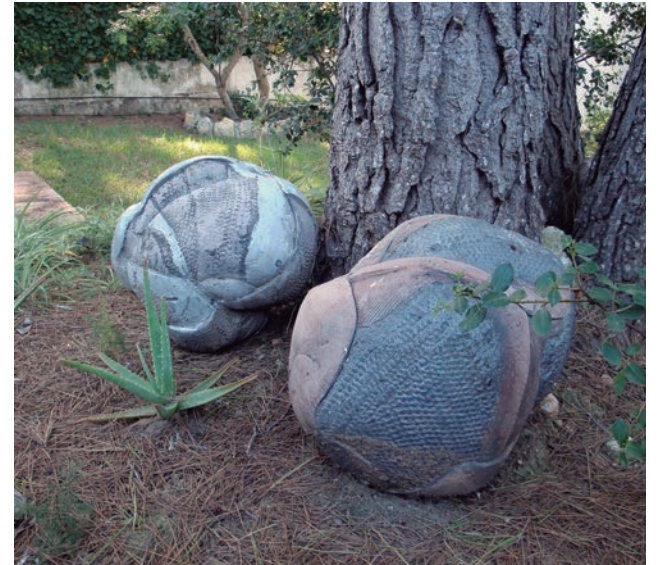
Meteorits, 1985. Peces de tècnica raku a jardins d'Altafulla.

Sense moure'ns de l'abril, es posarà en marxa una campanya de micromecenatge , amb l'objectiu de divulgar, i alhora, aconseguir fons per a les pròximes activitats de "Martí'70". Les aportacions s'han establert en deu euros i, qui col·labori, rebrà a canvi l'imant, el conte i el plànol carrerer. En un altre ordre de coses, el proper mes de juliol es compliran 50 anys de la inauguració, l'any 1969, del monument a l'explorador altafullenc Joaquim Gatell i Folch, el "Caid Ismail" (1826-1879), obra d'Albert Boronat i Joan Vives Milà. Degut al temps transcorregut i a la falta de protecció d'unes obres properes, el monument ha sofert desperfectes que cal reparar i estem segurs que així es farà. Entre els records del seu primer viatge, l'any 1865, l'africanista portà uns dàtils que foren plantats a l'Hort de Gatell i cresqueren. Encara en queden dues, d'aquelles palmeres, i ja tenen 154 anys! •