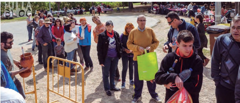
El bon temps i el bon ambient van acompanyar la 36a Festa de l'Olla d'Altafulla on es van repartir mig miler de racions d'aquest plat.