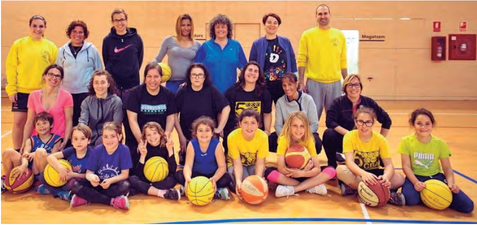
El CB Altafulla va organitzar un entrenament amb mares de joves esportistes per celebrar el Dia de la Dona.