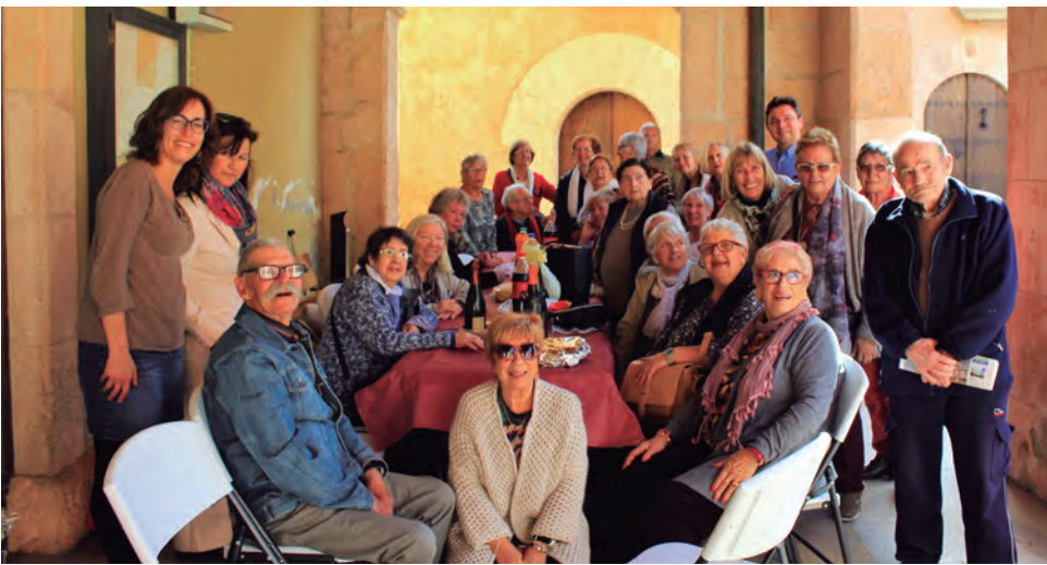
Els usuaris i col·laboradors del programa Bon dia de l'Ajuntament van organitzar com és tradicional el berenar de la gent gran de Primavera.