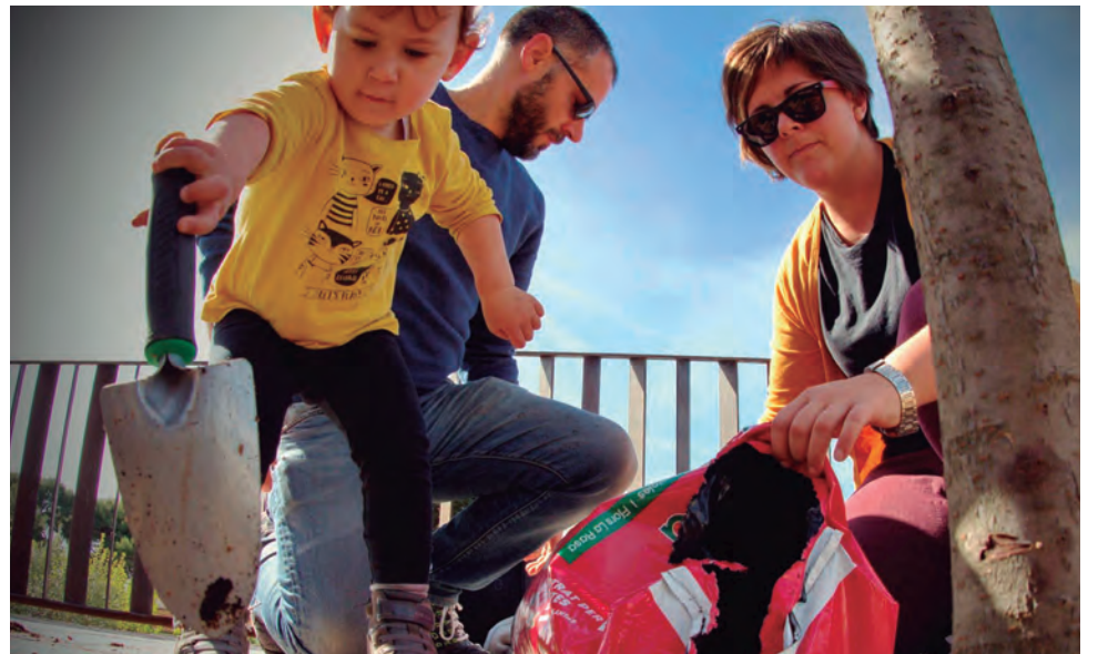
La Diada de l'Arbre va comptar un any més amb la Penya Ciclista d'Altafulla que, juntament amb La Sínia, van plantar diferents espècies al carrer Alcalde Pijuan.