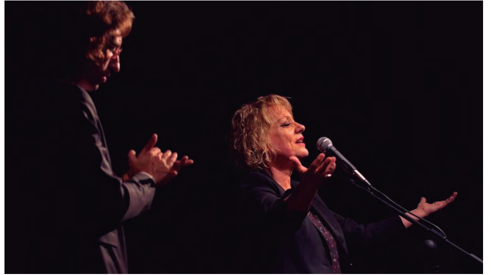
El concert de "Marina Rossell canta Moustiqui" posa la cirereta final al Barnasants a Altafulla.