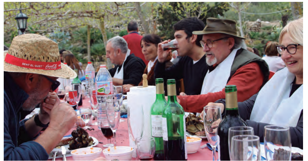
Unes 140 persones van gaudir de la calçotada anual d'ATECA on va destacar el bon ambient i des d'on s'espera una bona Setmana Santa.