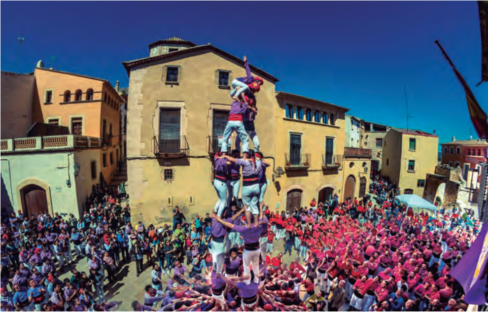
La millor Diada d'Inici dels Castellers d'Altafulla descarregant els castells de set més matiners com el 4d7 de la imatge. / Foto: Ildefonso Cuesta