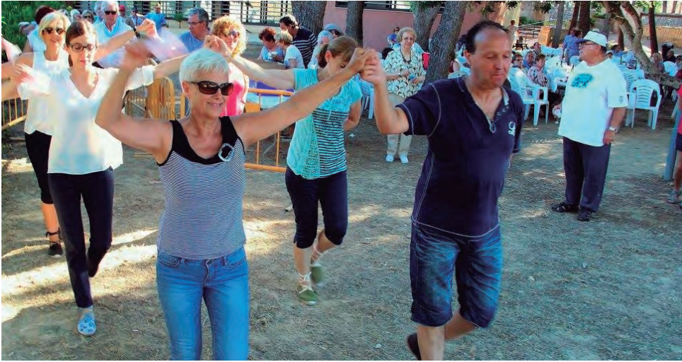
Unes 200 persones van gaudir del 17è Aplec de Sardanes "Vila d'Altafulla".