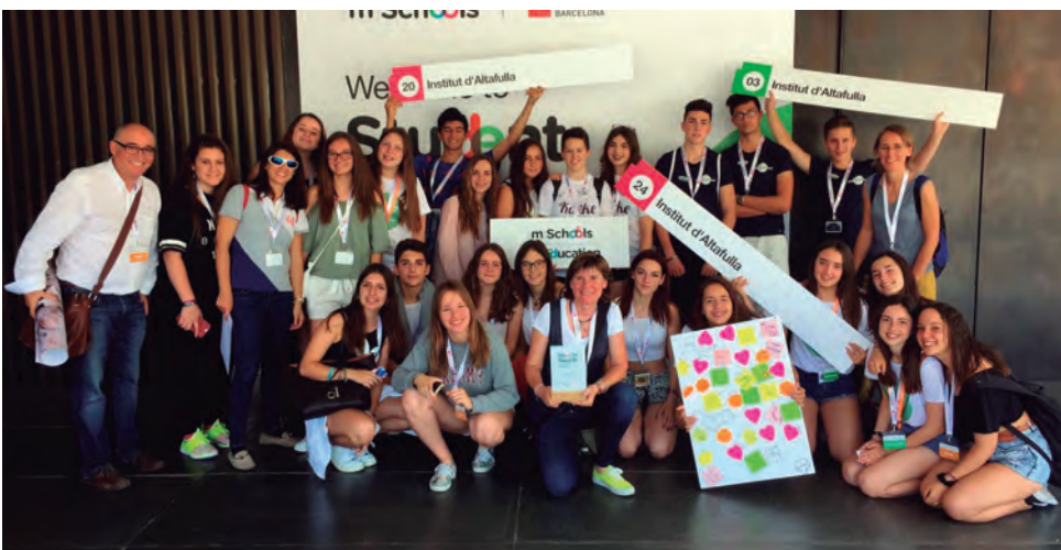
Alumnes de l'Institut són reconeguts en els premis de la modalitat "Inclusió, equitat i educació accessible" dels mSchools Awards.