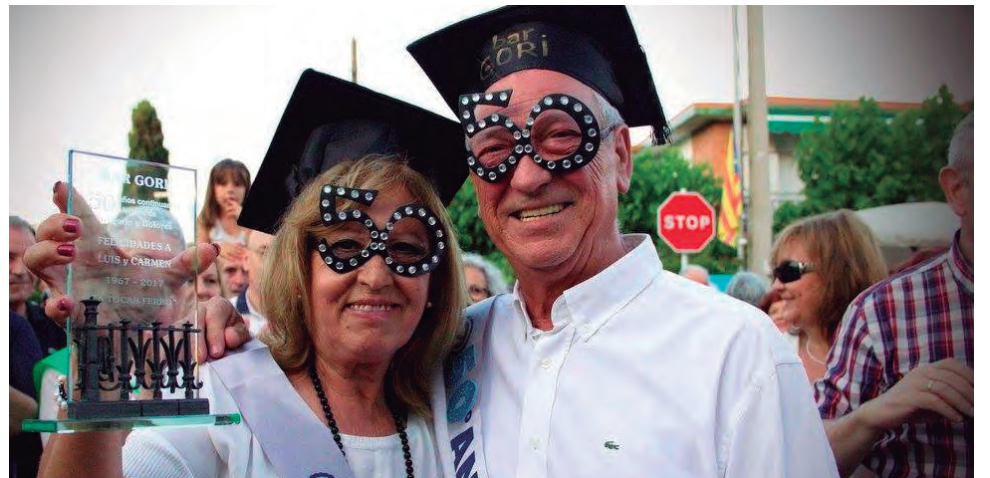
Un dels bars més populars d'Altafulla, com el Gori, va celebrar amb una gran festa els 50 anys de trajectòria.