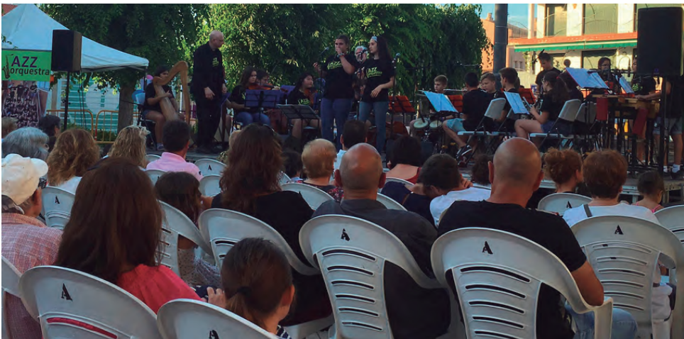
Concert de la Jazzorquesta de l'Institut a una plaça dels Vents plena a vessar.