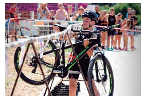
Un total de 65 infants del Tarragonès van participar en la IV Mini-Tri-Aletes d'Altafulla.