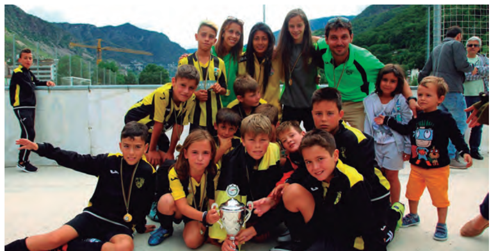
Els benjamins del CE Altafulla es van proclamar campions del torneig internacional Andorra Cup davant l'Escaldes.