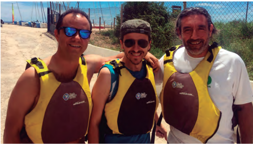
El programa Fricandó Matiner, de RAC 105, va visitar Altafulla el passat 1 de juliol.