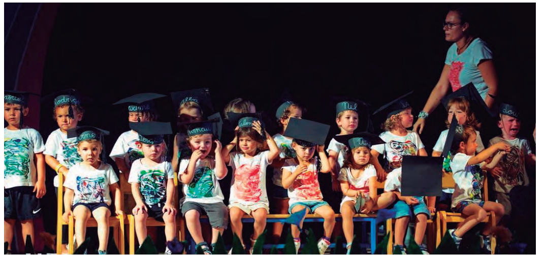
Teatre de fi de curs de la llar d'infants Hort de Pau on els de P2 començaran el col·legi.