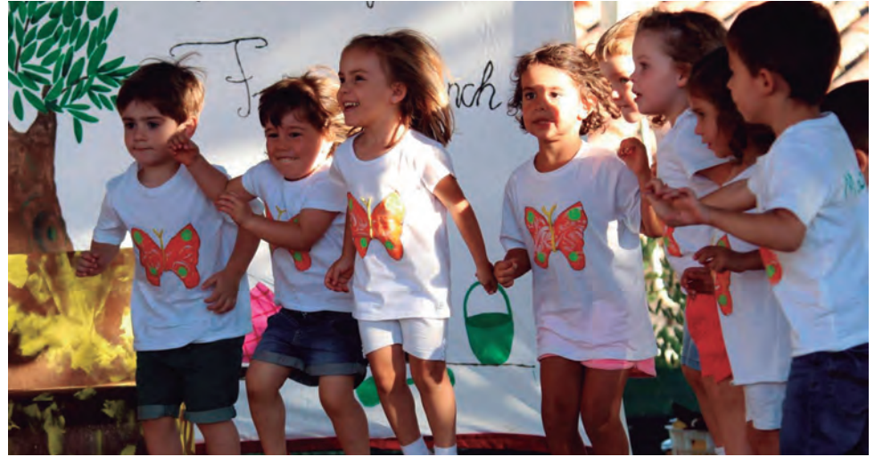
Festa de fi de curs de la llar d'infants Francesc Blanch amb els de P2 de protagonistes.