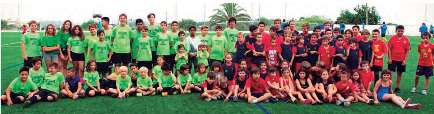
Les AMPA's del Roquissar i la Portalada van organitzar els tradicionals partits de futbol de fi de curs.