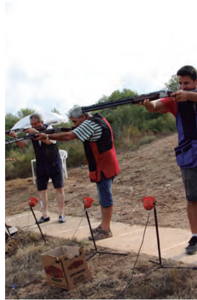
La Societat de caçadors "La Coma" va organitzar el tradicional Concurs de Tir al Plat darrera l'Ermida.