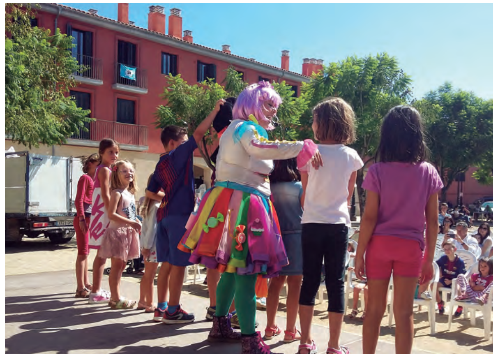
Espectacle infantil "El país de les festes", a la plaça Martí Royo, amb la col·laboració del Col·lectiu d'Atesans d'Altafulla.