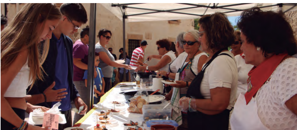
La pluja de dissabte no va impedir que l'endemà se celebrés la 17a Fira Gastronòmica de les Cultures.