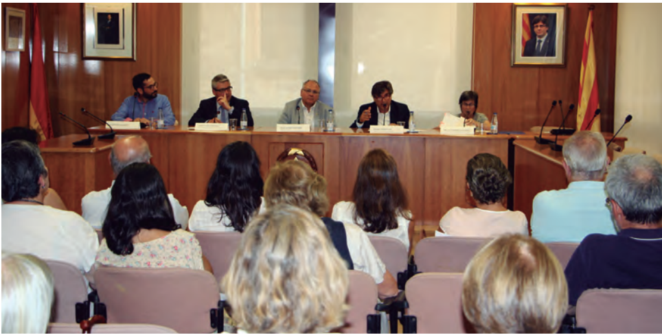
Acte d'ingrés del fons i presentació de l'exposició "L'Arxiu de la família Martí: testimoni de la història", organitzat per l'Arxiu Històric de Tarragona.