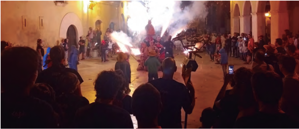
Castell dels Diablers Petits d'Altafulla a la plaça del Pou en el Correfoc infantil amb els Cagarrires de Cambrils a la plaça del Pou.