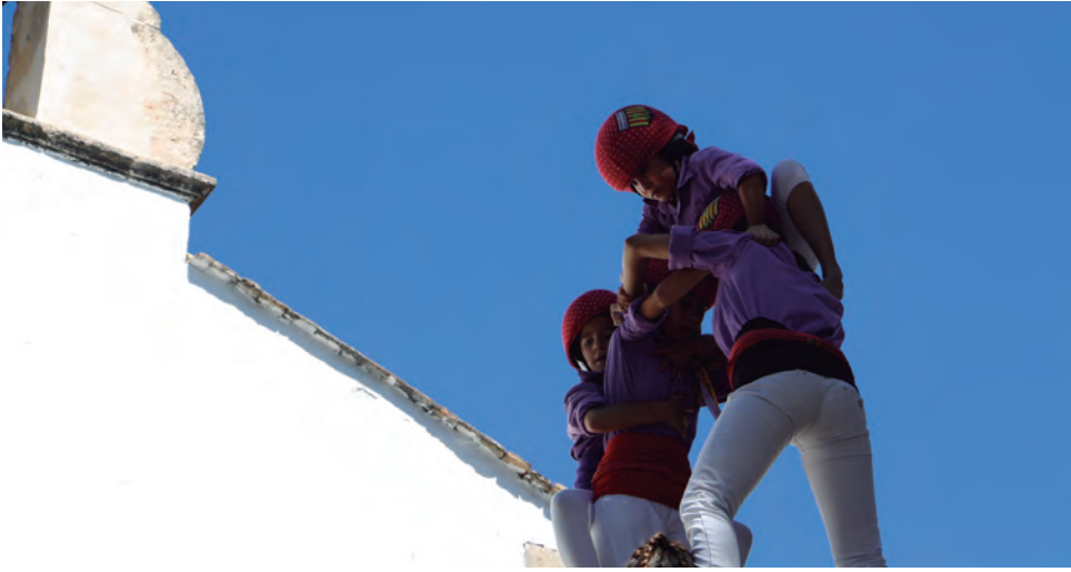
Actuació dels Castellers d'Altafulla a l'Ermida de Sant Antoni el passat 11 de setembre.