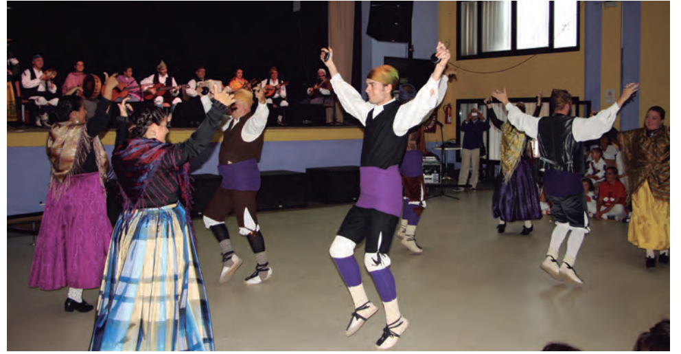
Tot i que la pluja va obligar a traslladar l'Altafulla Balla a la Violeta, el Grupo Folklorico Alto Aragón va fer gaudir al públic intensament.