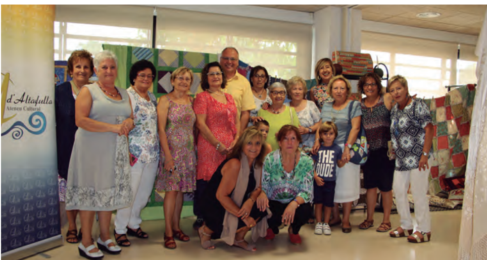
Exposició de tallers i activitats de l'Ateneu Cultural de Dones al Centre d'Entiats.