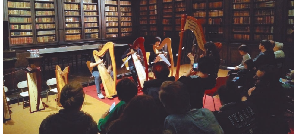
El grup d'arpes de l'EMMA al Museu Víctor Balaguer de Vilanova.