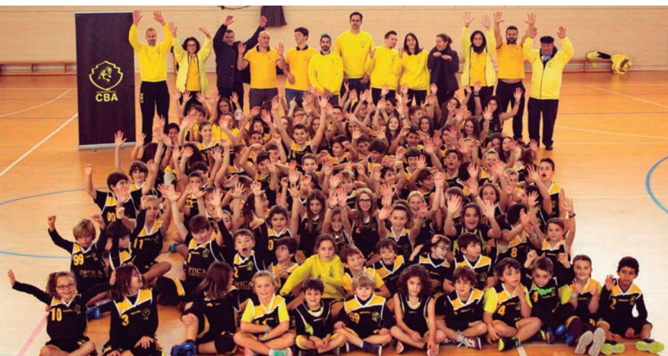
Presentació del Club Bàsquet Altafulla.