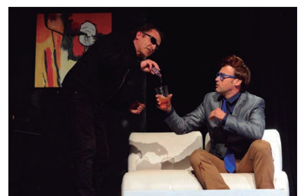
L'obra d'èxit altafullenca "Pla de xoc".