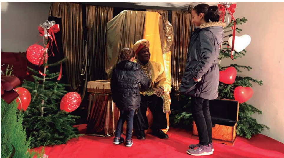
El Patge Reial va recollir les cartes al Parc de Nadal.