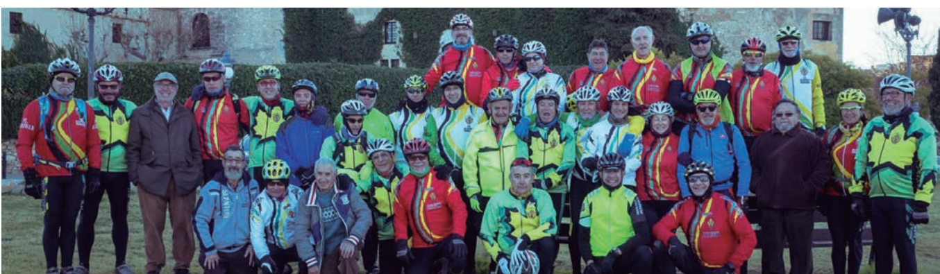
Última sortida del 2017 de la Penya Ciclista.