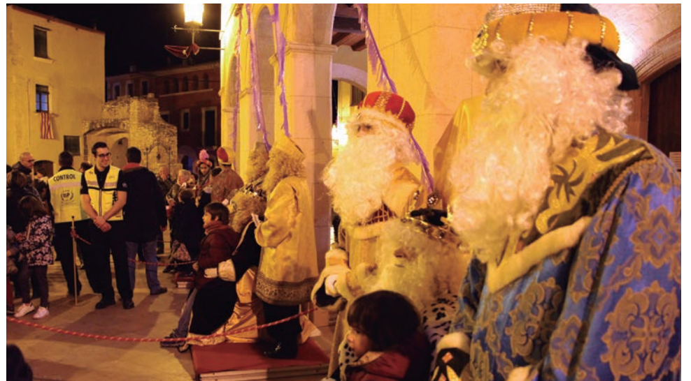
Els infants van fotografiar-se amb els Reis a la plaça del Pou.