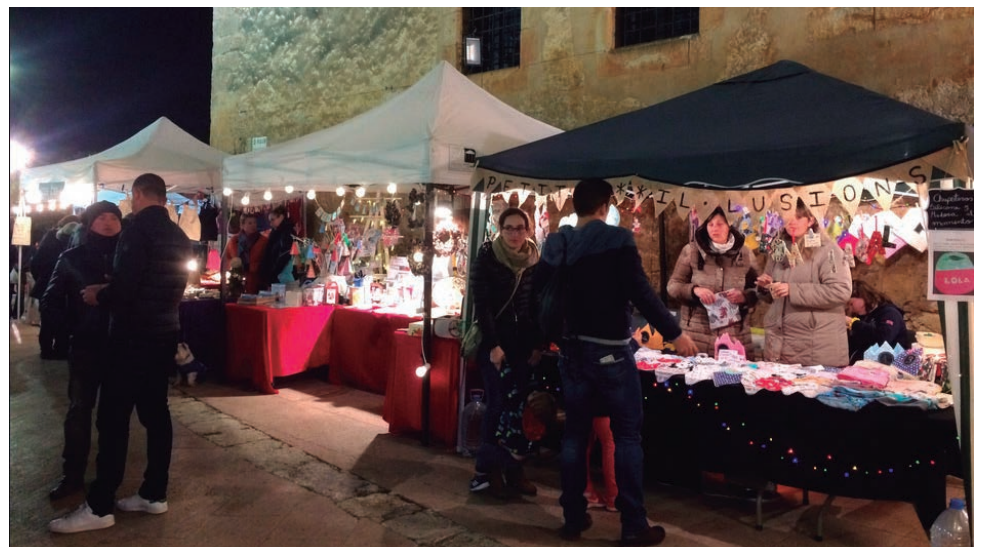
Fira de Nadal a la plaça de l'Església.