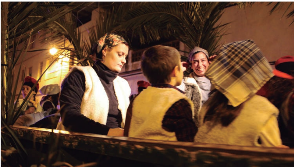
La rua va repartir més de 300 quilos de caramels.