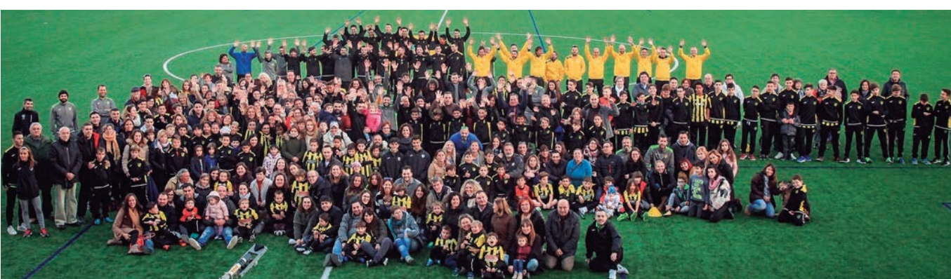
Presentació del Centre d'Esports Altafulla.