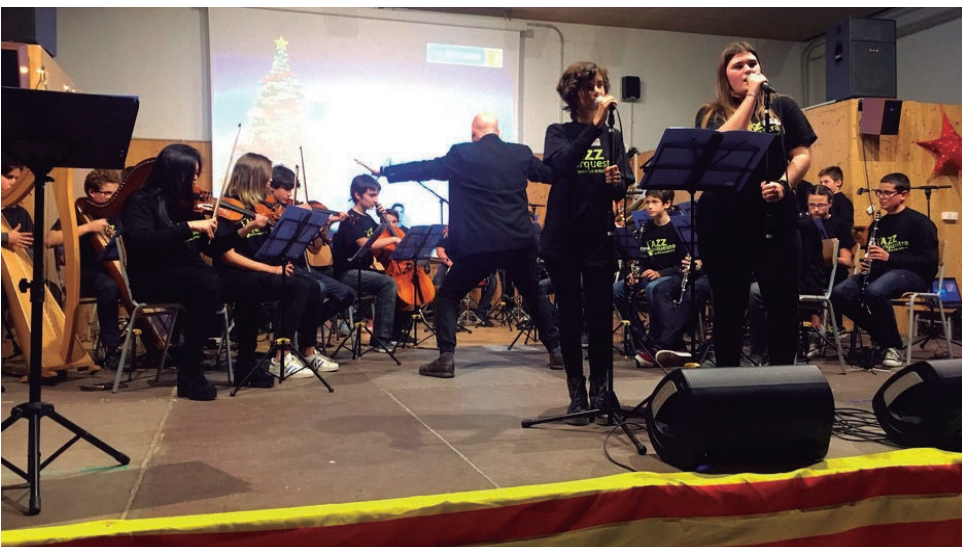
Concert de la Jazzorquestra en favor de la Marató.