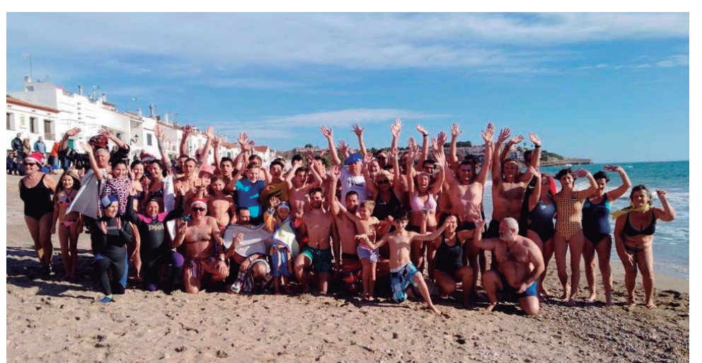
Primer Bany de l'Any al Pont de Mar.