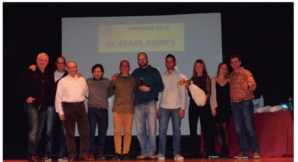
Els Atletes d'Altafulla, els més premiats per la Lliga Trail TGN Nord.