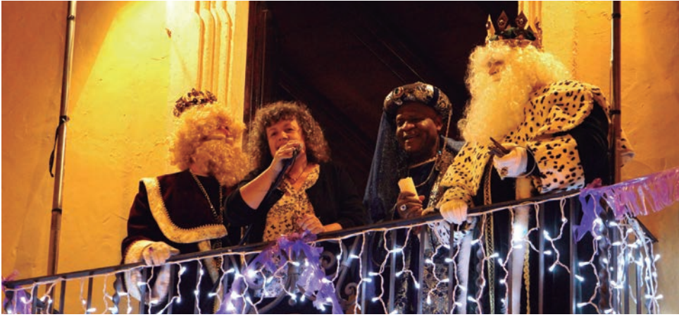
Ses Majestats els Reis, al balcó de l'Ajuntament.