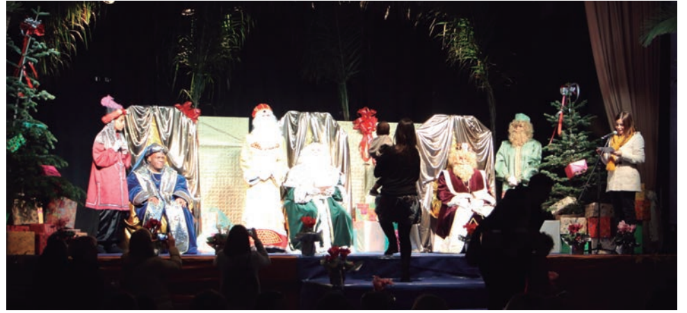
A la Violeta van repartir més de 100 regals. / Foto: A.J.