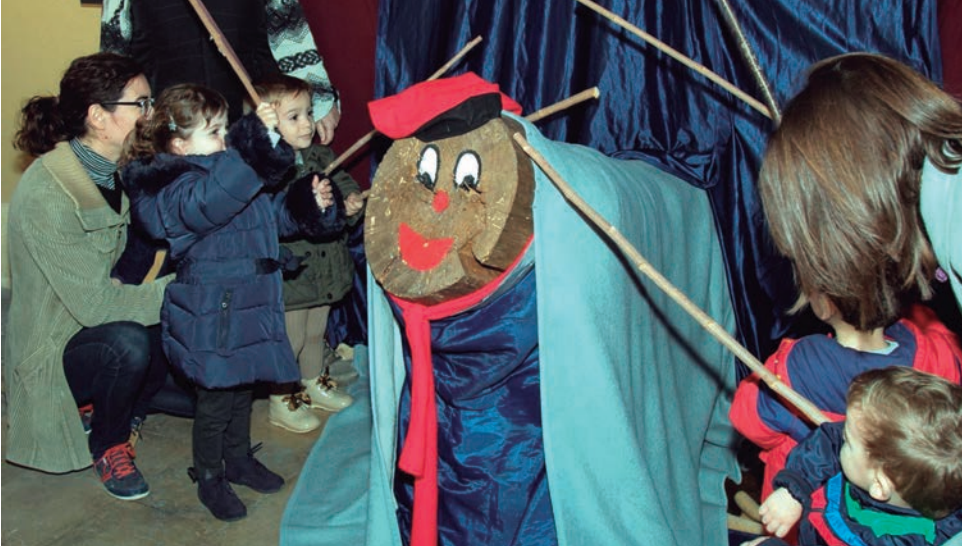
Més de 200 infants van participar al cagatió.