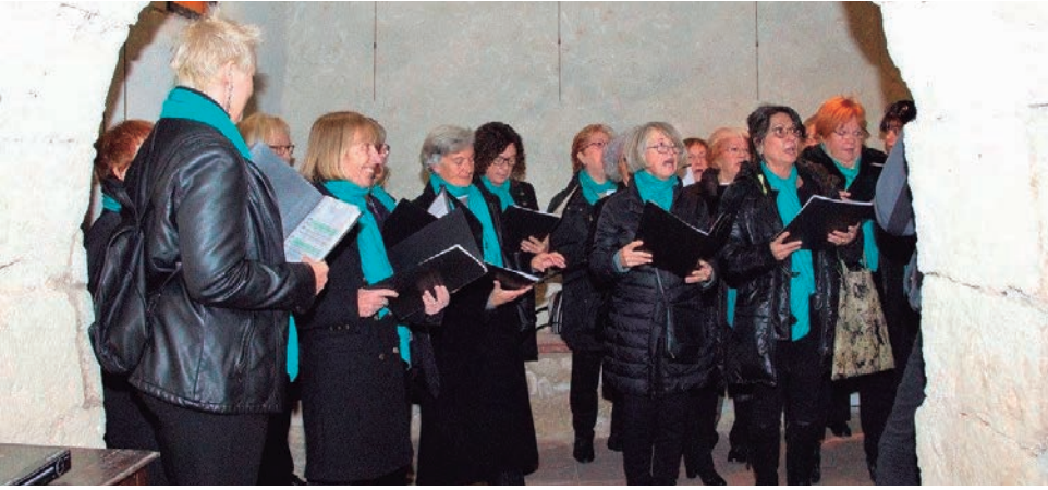
Cantada de la coral Nous Rebrots al Fòrum.