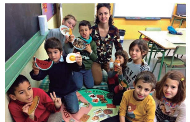
Taller nutricional a La Portalada.