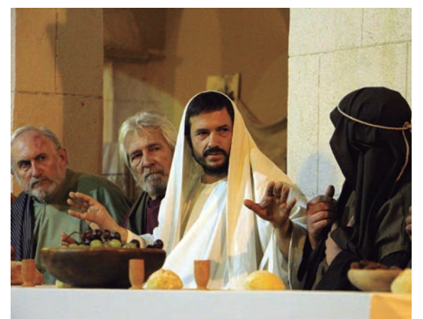
XVIIIè Camí de la Creu d'Altafulla.