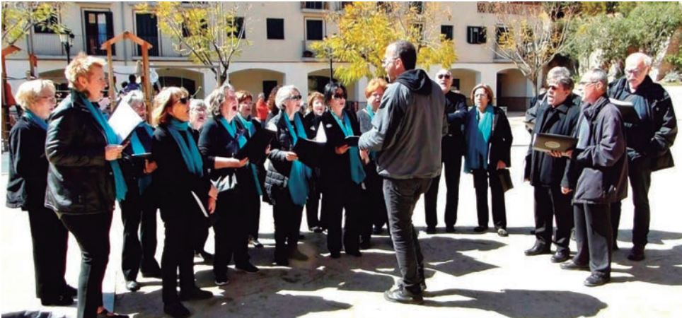
La Coral Nous Rebrotos va protagonitzar un any més les caramelles.