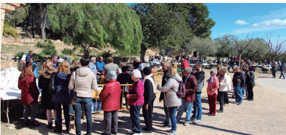
Unes 200 persones van gaudir de la 37a Festa de l'Olla al Comunidor.