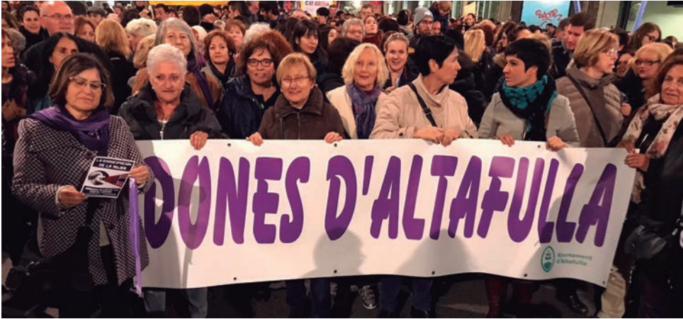
Les dones d'Altafulla, a la manifestació unitària i feminista de Tarragona.