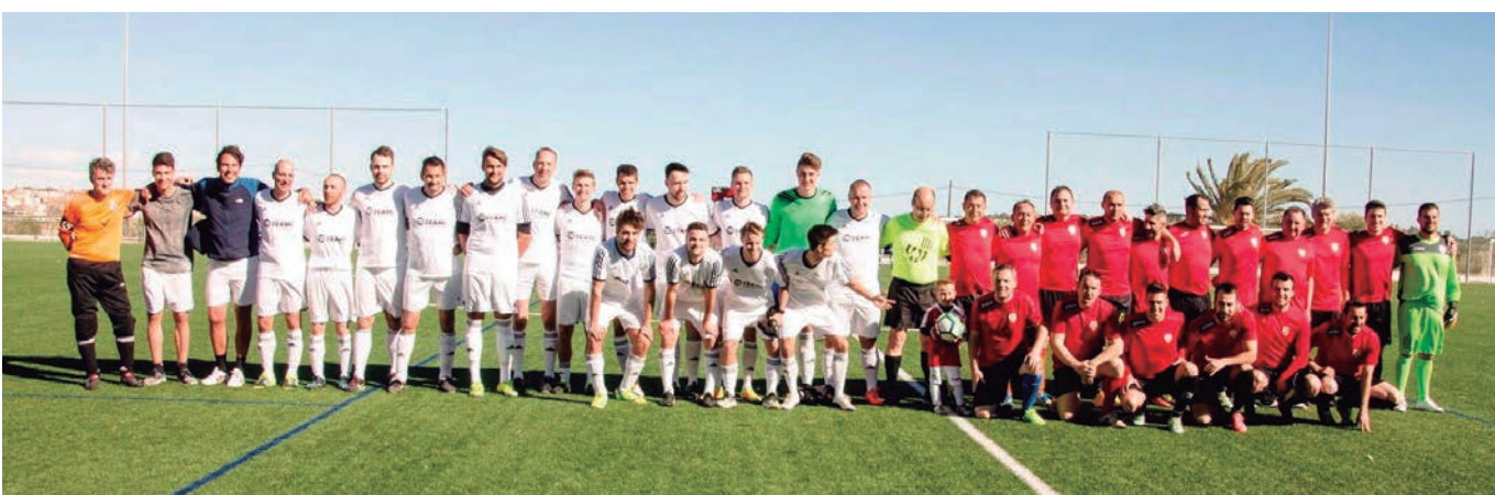
Tradicional partit entre els combinats d'Altafulla i Alemanya amb resultat local de 6 a 4.