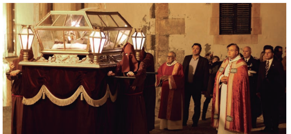
Processó del Divendres Sant a Altafulla.