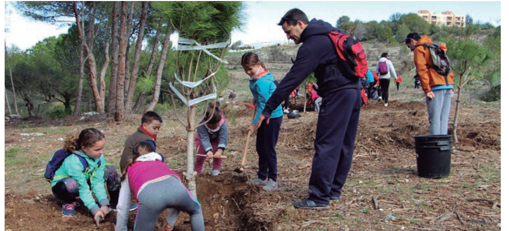
Dia de l'Arbre a la zona verda del carrer Santa Marta, als Munts.