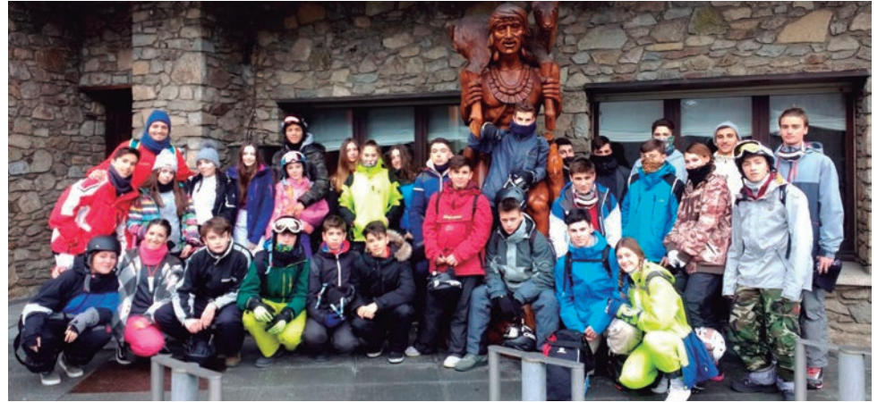
Segona edició de l'Esquiada Jove de la zona TRAC.