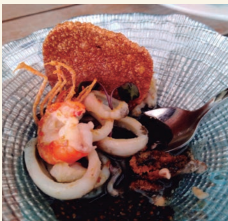
"Eclipsi d'arròs", deconstrucció dels arrossos del restaurant Voramar amb fumet negre i allolioli thai.

La regidoria de Comerç i Consum de l'Ajuntament d'Altafulla, que encapçala l'edil Jaume Sànchez, ha fet un balanç molt positiu de la tercera edició de la ruta gastronòmica "La Xoixeta. Tapes Bruixes Altafulla". En tres setmanes, s'han repartit un total de 7.512 racions d'entre els 18 bars i restaurants participants. Més enllà del número de tapes servides, el regidor de Comerç ha destacat la qualitat de les propostes, i el fet que, tot i no coincidir enguany amb les vacances de Setmana Santa, la resposta de la ciutadania ha estat excel·lent "ja que coneixen La Xoixeta i surten ex-