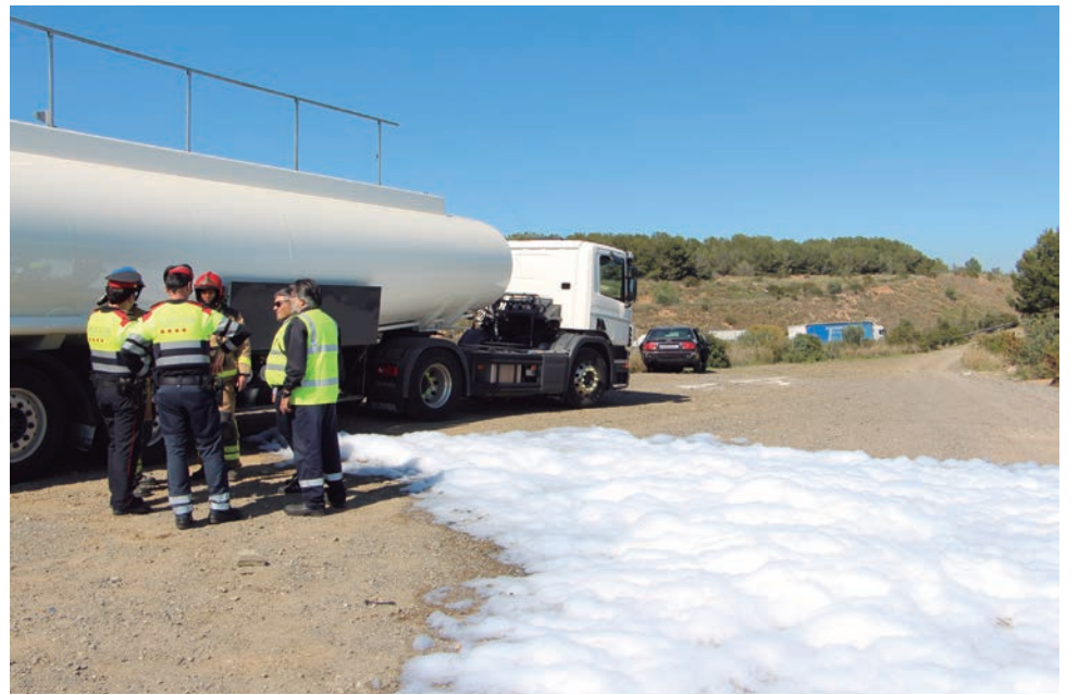
Quatre imatges del que es va viure en el simulacre per activar el TRANSCAT i el DUPROCIM en el desdoblament de l'N-340.

Protecció Civil de la Generalitat i l'Ajuntament d'Altafulla van organitzar el passat 17 d'abril a la tarda un simulacre d'accident entre un camió de transport de mercaderies perilloses de l'empresa Transquality que va xocar frontalment amb un turisme a l'N-340 al punt quilomètric 1.175, al nord d'Altafulla, a l'entorn del camí de servei cap a Torredembarra. A conseqüència de l'accident es va activar el Pla especial d'emergències per accidents en el transport de mercaderies perilloses per carretera i ferrocarril a Catalunya TRANSCAT, així com el DUPROCIM o Document únic de protecció civil municipal del municipi d'Altafulla en el que s'inclouen els plans d'actuació municipal i els plans específics municipals d'Altafulla. Precisament Altafulla és l'únic municipi de la demarcació de Tarragona que té aprovat el DUPROCIM.