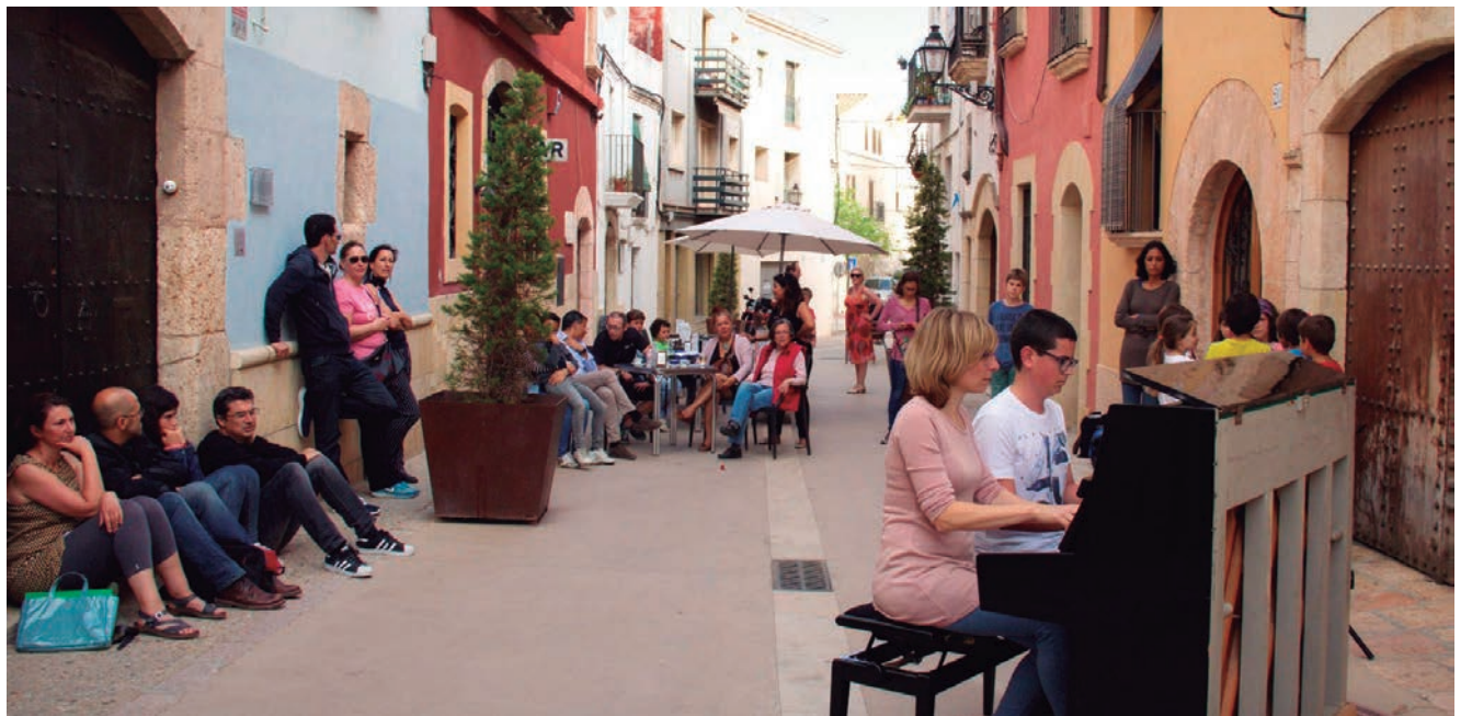
"Pianos al carrer", iniciativa de l'Escola de Música per apropar-la a la ciutadania.