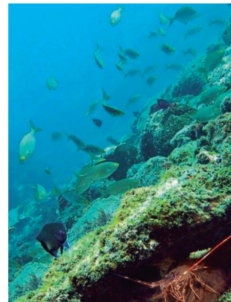
Simulació del parc subaquàtic al litoral d'Altafulla, i un exemple d'escull artificial al parc de Torredembarra.

bretot, respectuoses amb el medi natural que les envolta . Les condicions actuals del Mar Mediterrani fan que, degut al nivell de salinitat de l'aigua, així com també la seva temperatura, una roca d'origen marí i de composició bàsica sigui la més adequada per aquest projecte.