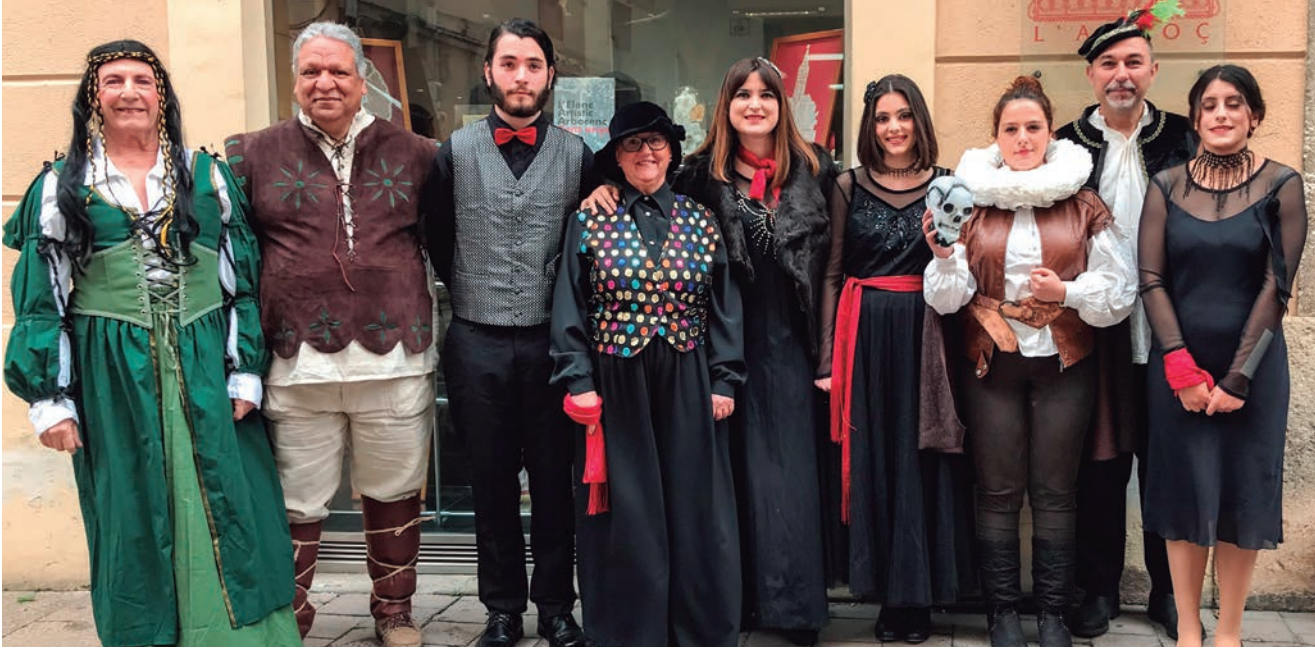
El grup altaullenc Teatre + A prop va actuar a la Fira Modernista de l'Arboç.