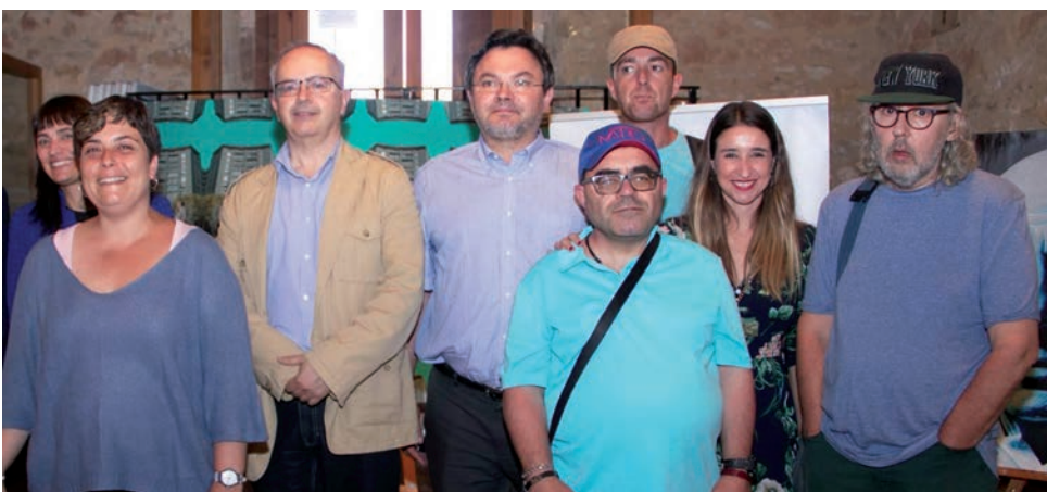
El Museu d'Altafulla torna a acollir el projecte "Parelles artístiques".