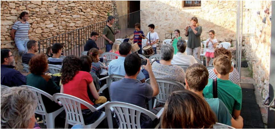
Concert de gralles amb els Grallers d'Altafulla i les escoles de música d'Altafulla i Torredembarra pel 45è aniversari dels Castellars d'Altafulla.