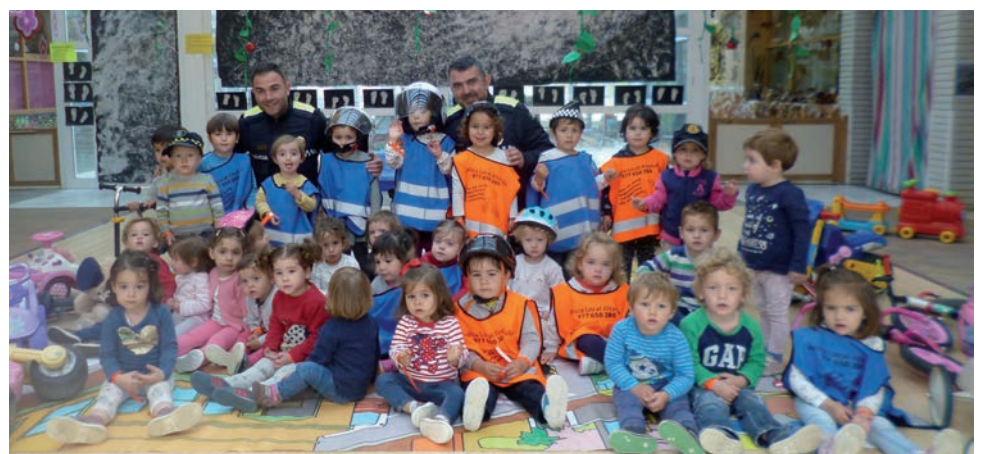
Taller de la Policia Local a la llar d'infants Hort de Pau per donar a conèixer la figura de l'agent.