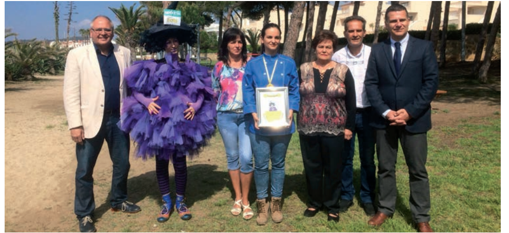
La tapa "Eclipsi d'arròs", del restaurant Voramar Cal Vitali, guanya la 3a Ruta gastronòmica d'Altafulla.