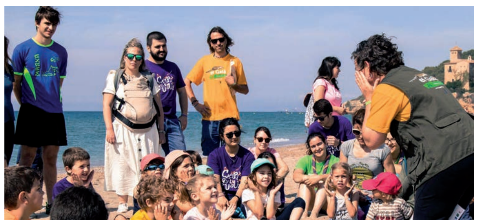
L'Associació Mediambiental La Sinya celebra el Dia Mundial del Medi Ambient amb la benvinguda a la tortuga babaua.