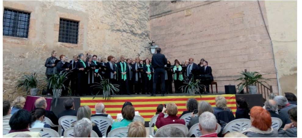
Concert conjunt de la coral Nous Rebrotis i el Coro Musicalia de Saragossa.