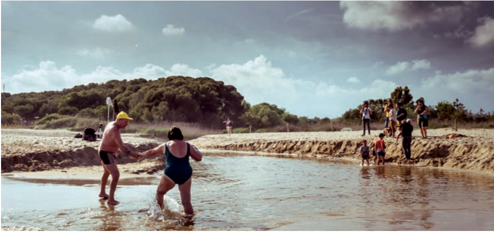
Centenars de veïns van revivre la desembocadura del riu Gaià amb aigua .