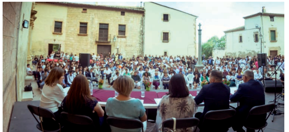
Graduació dels alumnes de 2n de Batxillerat de l'Institut d'Altafulla a la plaça de l'Església.