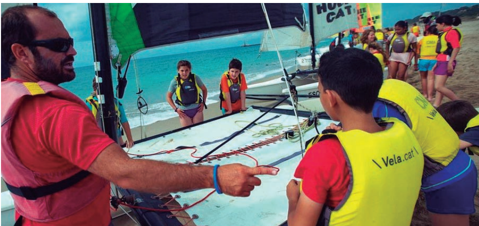
Alumnes de 5è de la Portalada i el Roquissar van finalitzar el passat 6 de juny el projecte de vela escolar al Club Marítim Altafulla.