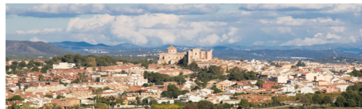
Fotografia | Altafulla Bloc